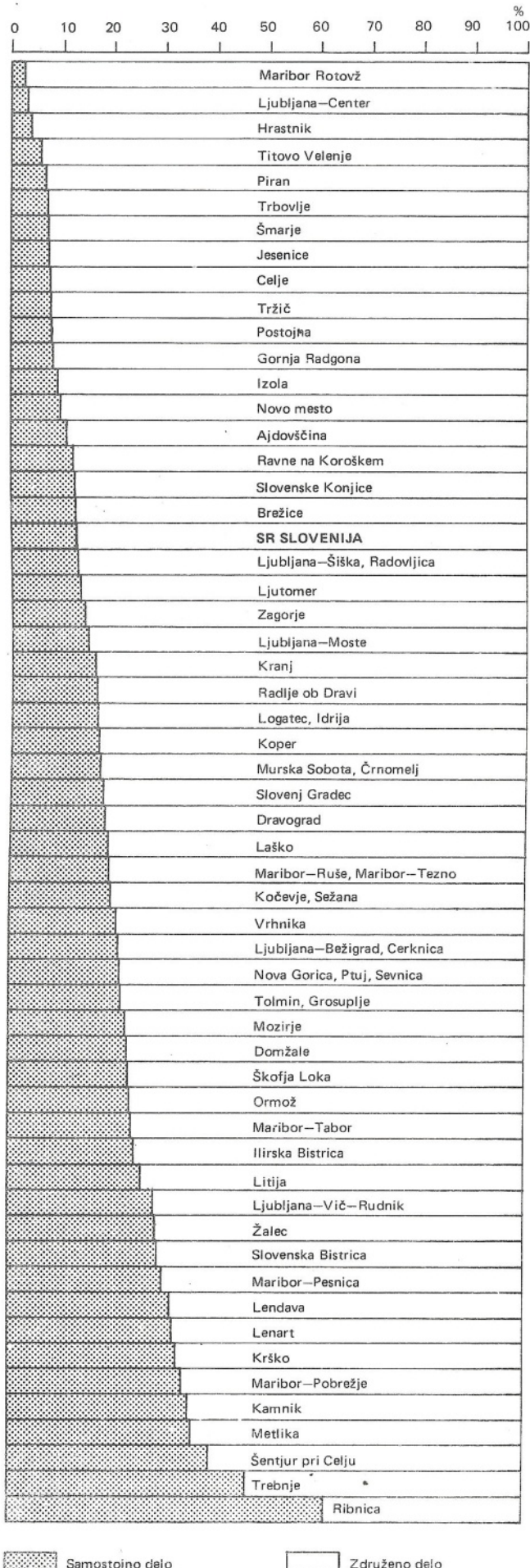
SLIKA 1. Struktura vrednostnega prometa v gostinstvu po občinah SR Slovenije 1983

in tovrstnih podatkov za samostojno osebno delo nima, lahko z navedenimi kazalniki za združeno delo za preteklih nekaj let ugotavljamo relativno nizko oziroma celo negativno stopnjo rasti za fizični obseg gostinskih storitev.