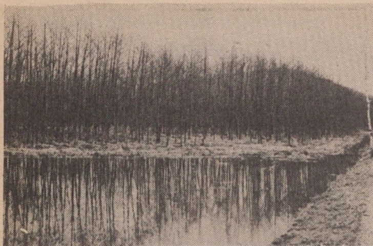
Poskusne drevesnice na Ljubljanskem barju pri Škofljici