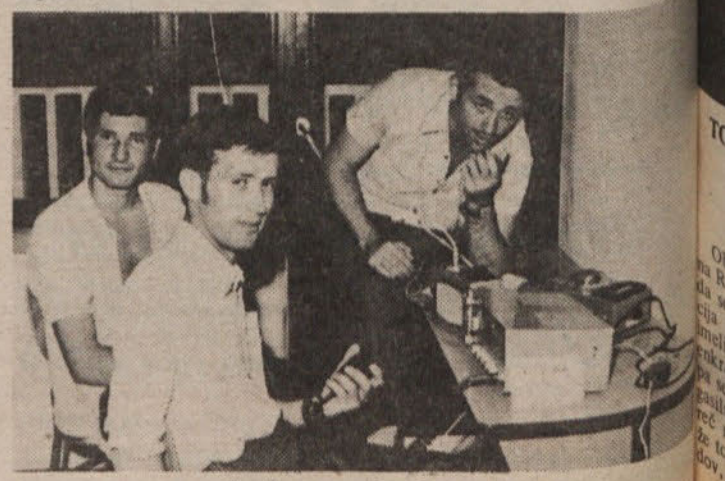
Radioamaterji na Lepem potu

Če boste neveščni skrivnosti sveta, v katerem že desetletja živijo naši radioamaterji, povprašali mlade zanesenjake, kaj jim je na radijskih valovih najljubše, vam bodo v hipu odgovorili: