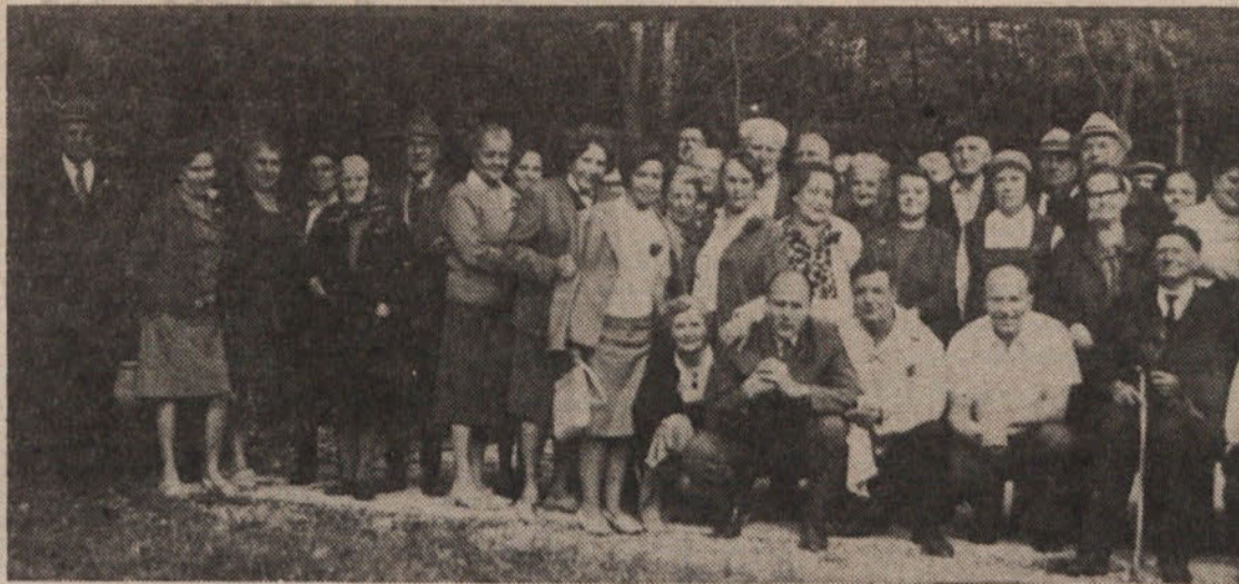
Izlet v Polhov Gradec, „za spremembo v enolični vsakdanjosti, kakršno preživljajo v veliki večini starejši ljudje“. Organizator: RK „Milan Česnik“.

V odgovorih so kmetje tudi izrazili željo, da bi se povezali v organizacijo, kjer bi si izmenjavali izkušnje. Nekateri so napisali, da bi morala biti preskrba z nadomestnimi deli za stroje boljša, nekateri pa se so zavzeli za odpravo carinskih dajatev na kmetijsko mehanizacijo. A. A.