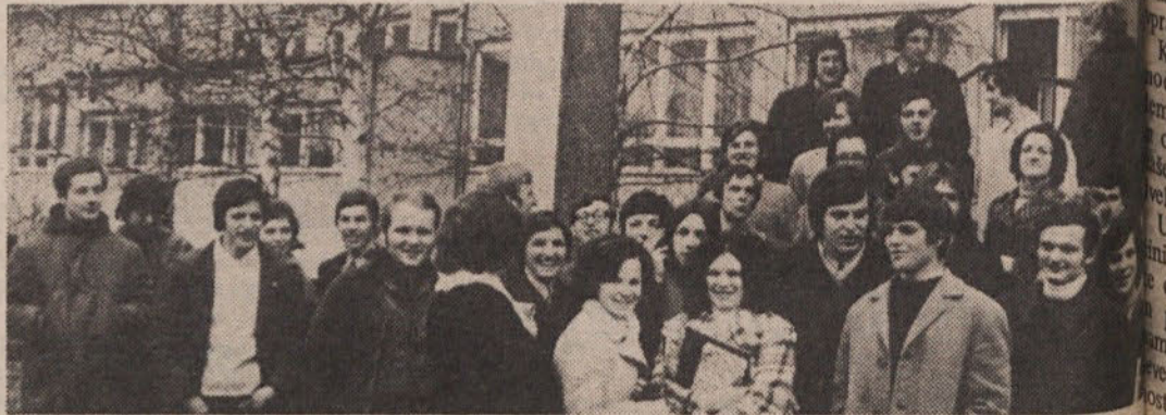
Z ene izmed mnogih uspešnih krvodajalskih akcij v naši občini. Tudi dijaki srednje veterinarske se polnoštevilo odzvali.