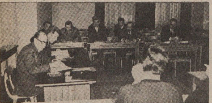
Na marčni seji občinskega odbora ZRVS so obravnavali lansko delo in letošnje naloge.