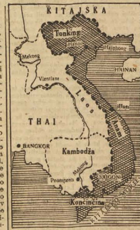
Demokratična republika Vietnam (črtkano ozemlje), ki je bila proglašena avgusta 1945, obsega Tonking, Anam in Končičino. — Najbogatejša pokrajina Vietnamu je Končičina, ki je pred vojno izvažala 7 milijonov kvintalov riža na leto. Kraljevini Kambodža in Laos sta francoski protektorat, tu je Francija zadržala še kontrolo o svojih rokah

Francoska kolonialna uprava je skušala razbiti narodnoosvobodilno borbo