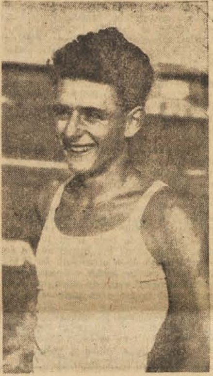
Mladinec Vozel iz Litije je skočil ob palici 3,20 m