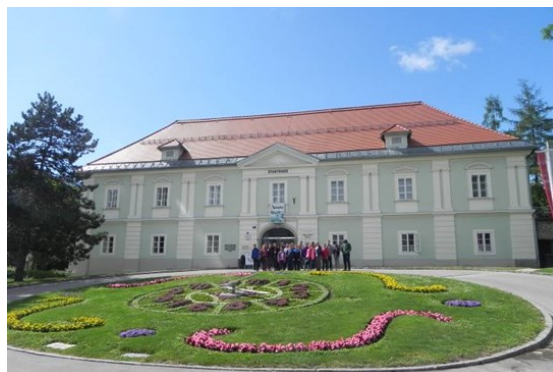
Pred mestno hišo v Celovcu.

V sodelovanju s Slovensko prosvetno zvezo iz Celovca je ZPM Krško že tretje leto zapored organizirala in izvedla Mednarodni tabor v Celovcu, ki je potekal od 19. do 21. junija 2015. Tabor je bil namenjen druženju in izmenjavi izkušenj med mladimi. 21 mladih je spoznavalo posebnosti življenja na etnično mešanem območju, se izkustveno učilo strpnosti in osvežilo znanje nemškega jezika. Udeleženci so si ogledali Mladinski dom v Celovcu, kjer delujejo dijaški dom, knjižnica, popoldansko varstvo in vrtec. Na Gosposvetskem polju smo si ogledali Vojvodski prestol. Na poti proti domu smo se ustavili tudi v znameniti Dovžanovi soteski. V Športnem centru CENTRIS v Šentjanžu v Rožu so se mladi družili ob družabnih in športnih igrah ter se preizkušali na plezalni steni.