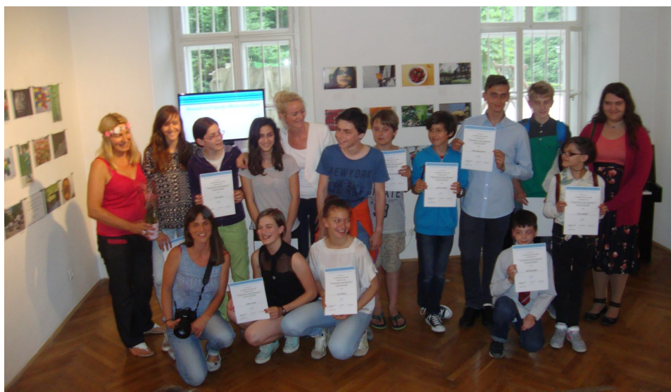
Foto tečaj TrenutkiSkoziMojeOci