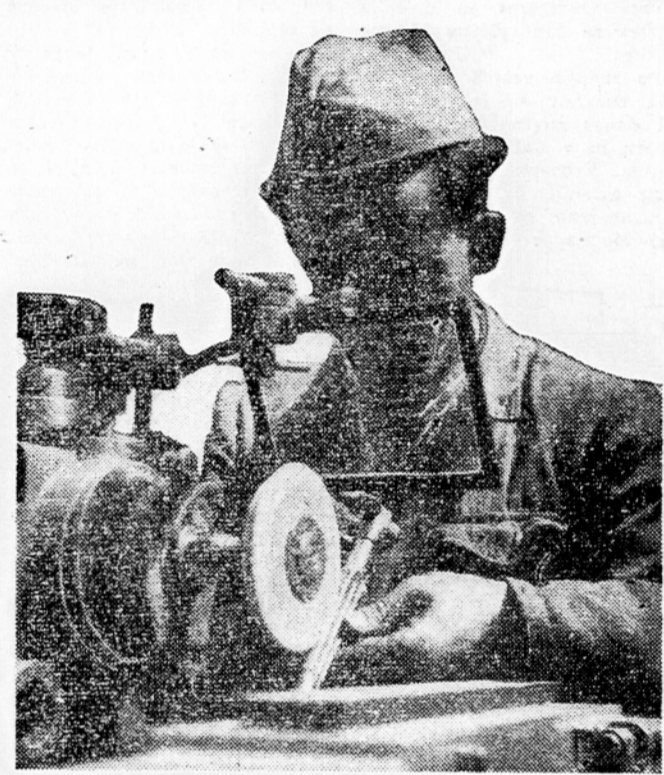
Prilava, ki naj varuje oči pri delu