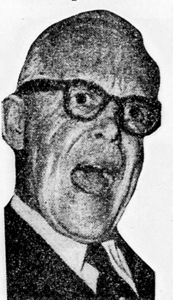
Predsednik kanadske vlade Louis St. Laurent

Izidi parlamentarnih volitev v Kanadi niso nobeno presenečenje, kajti v tej deželi že desetletja ni pravega boja za politična načela in za oblast tekmujejo od ene petletne parlamentarne periode do druge pravzaprav samo dve stranki. Liberalna stranka je na oblasti že od leta 1935. Od sedanjih parlamentarnih volitev so precej pričakovali konservativci kot tekmečiki liberalcev, ker so menili, da se mora tudi v Kanadi po dolgih letih politična situacija spremeniti, kakor se je spremenila pri predsedniških volitvah v ZDA.