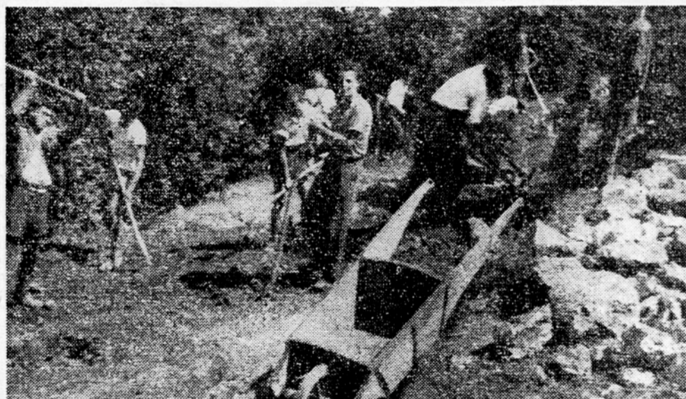
Mladina, kmetje žene in delavci gradijo novo cesto, na Polževo, kjer bo na znani turistični postojanki kmalu odprt nov dom.