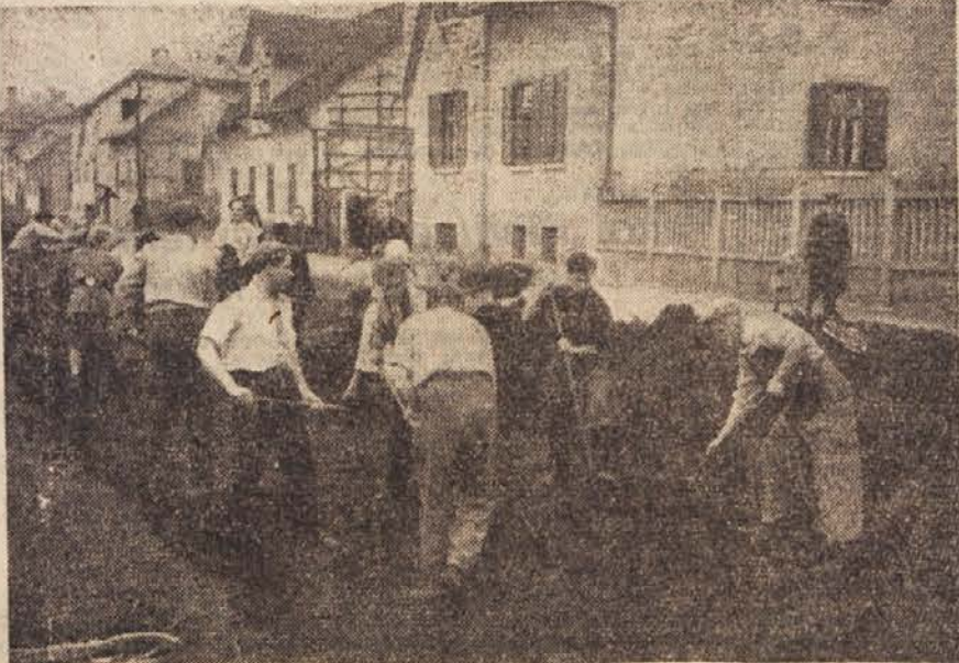
Po volitvah razširjajo ljubljanski frontovci Verovškovo ulico

V Primskovem so že ob pol 12. uri skoro zaključili volitve. Le dva zastojkarja sta še manjkala. Volilna komisija se je jezila, toda kaj hočete. Morali so čakati. Med Primskovo in Gorenjem je bila nenapovedana volilna bitka. Kdo bo koga? Ze malo pred 8. uro so se Goren-