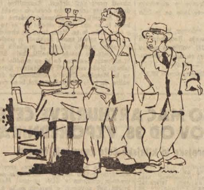
Kakor že večkrat je tudi na konferenci v Parizu skušal evropski predstavnik barantati s Trstom na račun jugoslovanskih narodov.