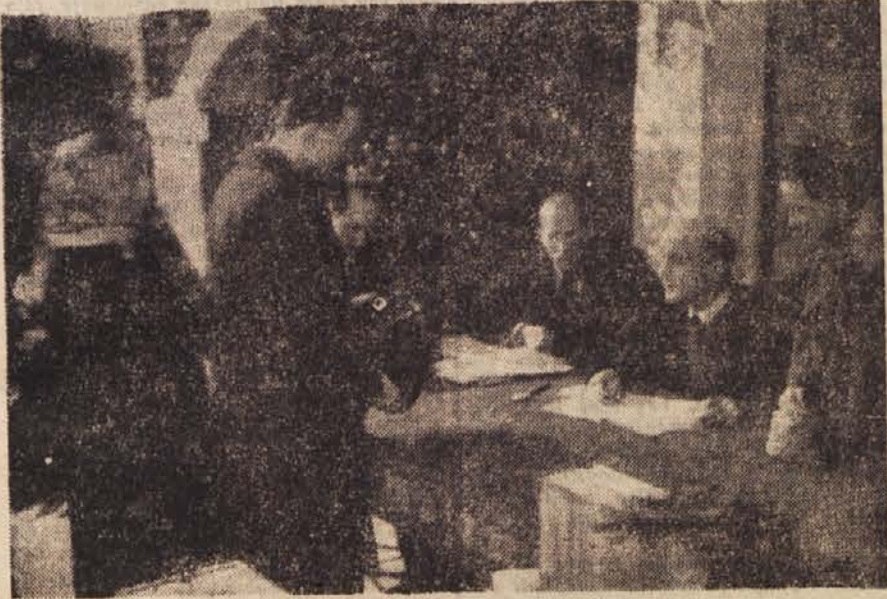
Tako je bilo na 6. volišču II. rajona v Ljubljani

Ljubljancani so se tudi ta dan kosali z Mariborčani, kajti uspeh na volitvah je tudi ena izmed važnih točk njihovega medsebojnega tekmovanja. Kdo je zmagoval tekmovalca, pa bo odločila ocenjevalna komisija.