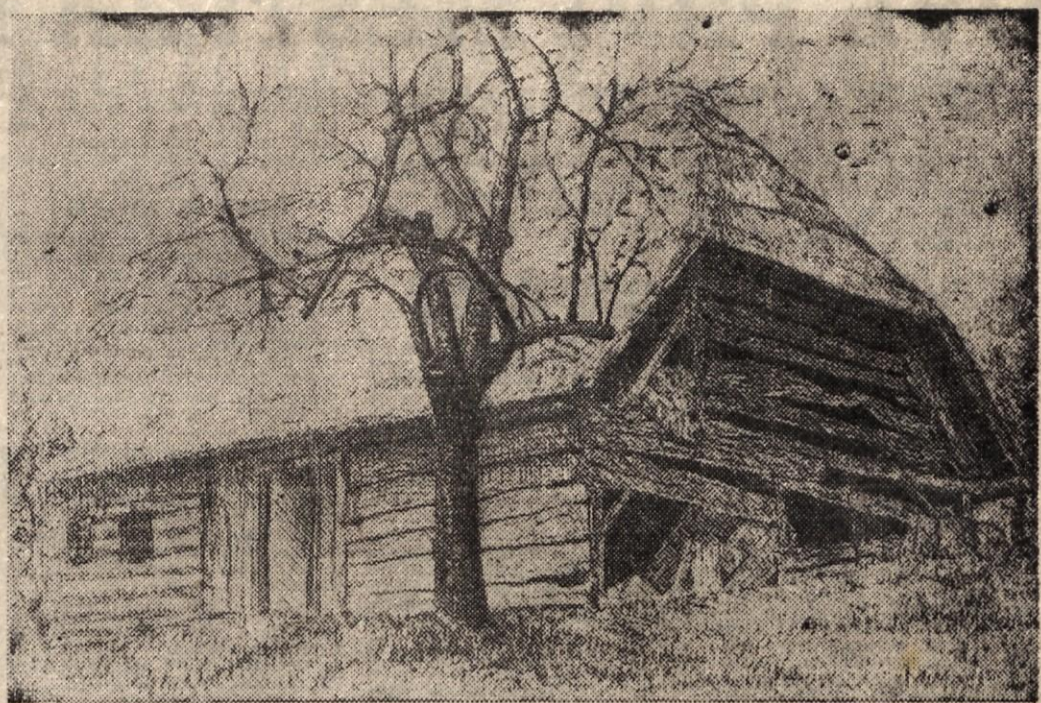
Viktor Povše: NA KONCU VASI (1960)

Pedagoški teden naj pomaga reformo osnovne šole čim dlje razviti in jo uresničiti v praksi.