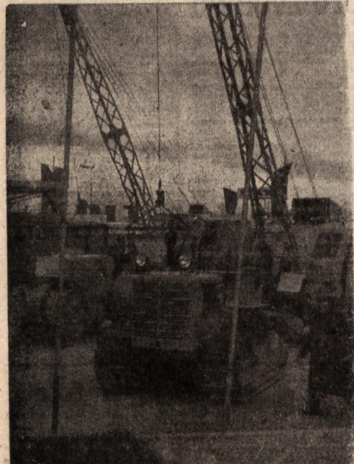
X razstave domačih strojev za gradbenstvo na letošnjem Zagrebem velesejmu