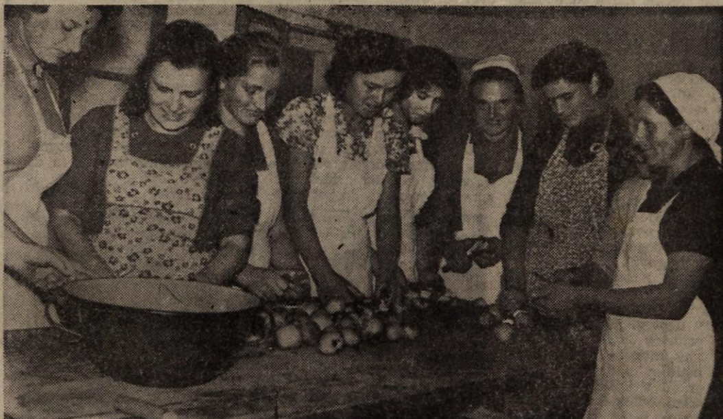
Marsijske so žene, matere in dekleta te dni vkuhale precej dobrot za šolske mlečne kuhinje, da bo čez zimo pestrejša izbira malice in dodatkov za učence se glavic. Na sliki: žene-zadružnice iz Mirne, o katerih berite kaj več na 6. strani današnje številke

Tudi družbeno prehrano smo zanemarili. Lani in predlani se je nekaj podjetij resno lotilo te naloge, ostala še vedno stoji ob trani. Obratne menze v okraju nudijo vsak dan 1700 delavcem malico, 470 delavcem kosilo in 550 delavcem večerjo. V okraju pa je zaposlenih 28.000 ljudi; najmanj dobra tretjina teh je od delovišča toliko oddaljena, da se na delo vozi. Oskrbeti jim moramo tople obroke in organizirati tudi dovoz na delo. To ni le naloga sindikata in gospodarskih centrov, ampak naloga delavskih svetov, kolektivov in zbora proizvajalcev. Le če bomo izboljševali življenjske pogoje delovnih ljudi in se res potrudili, bomo zmanjšali bremena zaradi boleznij in nesreč pri delu.