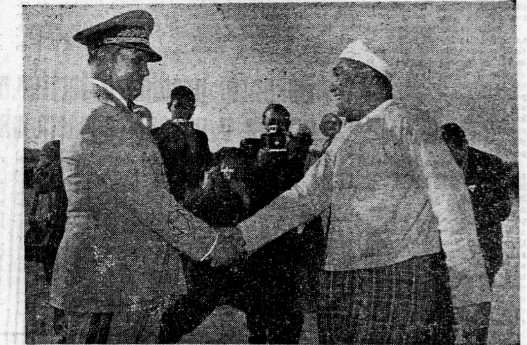
Predsednik Tito in U Nu na zemunskem letališču.