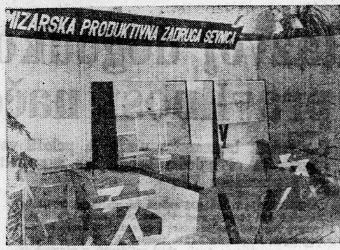
Z mednarodne lesne razstave — pisarniško pohištvo, izdelek Mizararske produktivne zadruge Sevnica

vzgojni nastop, nato pa mladinsko rajanje. Podjetje ECZ v Ljubljani je odobrilo vajencem za vožnjo na travmaju na relaciji »Evropa-Sentvid 50% popust ob Sentvidu do Vikrc pa je organiziralo posebne avtobuse, ki bodo udeležence vajenskega slavlja zapeljali do Vikrc za 10 dinarjev.