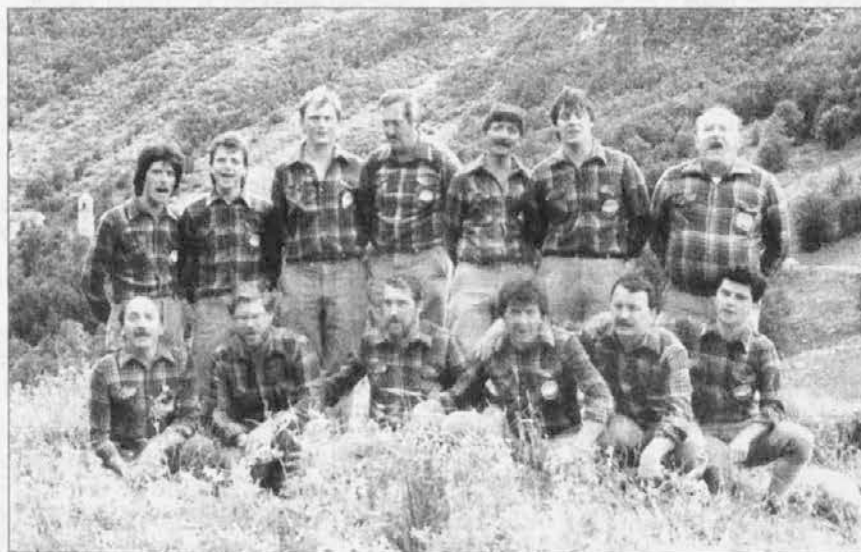
Coro Monte Canin (foto d'archivio)

Il coro, per festeggiare degnamente il suo trentennale, all'inizio dell'anno si era prefisso di presentare un CD, contenente una quindicina di brani inediti in lingua resiana, ed un volume che descrive le usanze,