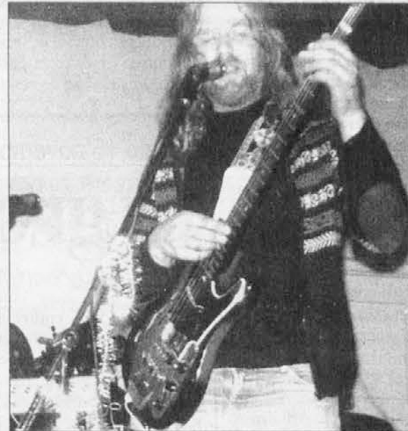
Zadnji dan lieta 1983 na Liesah (Kekko, gode bas)

Smo ti bli parjatelj, kar se je zdielo, de zivljenje ti je samuo teklo blizu an nies biu v stanu ga darzat.