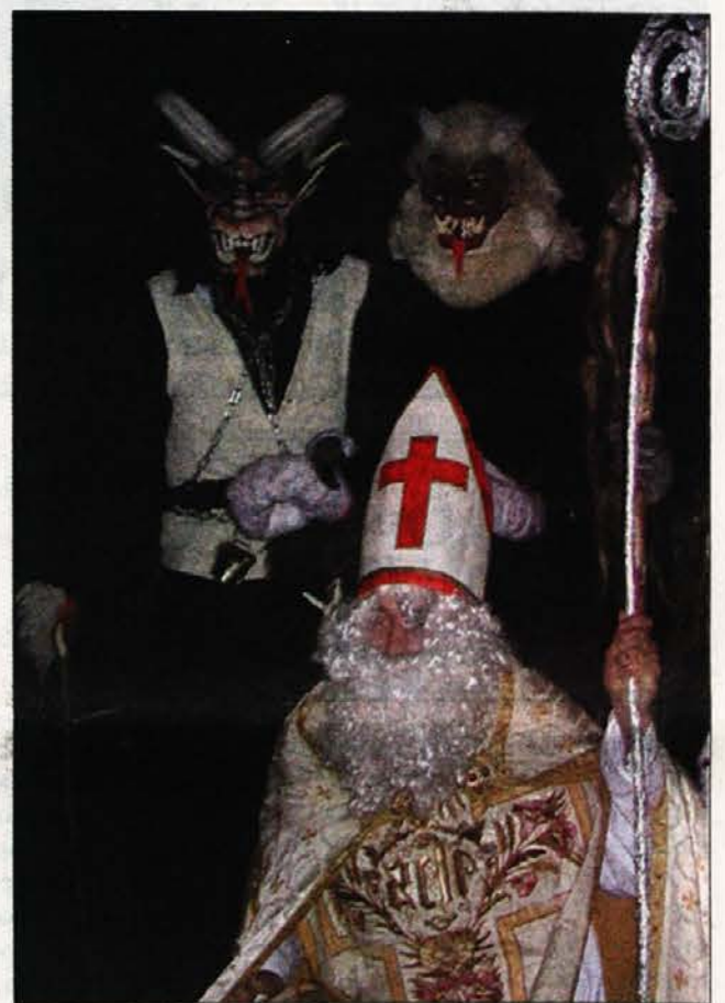
Krampuži so se za sv. Miklavž tudi lietos parkazal v Kanalski dolini

Lese, Grmek - cerkev Marije Dobrega sveta sobota 15. decembra ob 20.30. uri