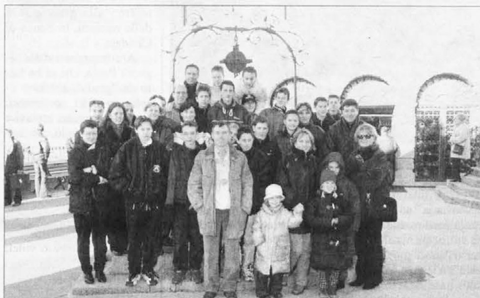
La fotografia dei Giovanissimi della Valnatisone con i genitori a Castelmonte

Pellegrinaggio dei Giovanissimi della Valnatisone a Castelmonte, raggiunta a piedi attraverso Picon assieme ai genitori, dove