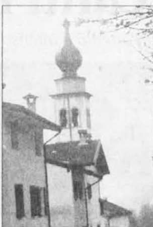
Motiv iz Rezije

Sarà anche l'occasione per fare il punto della situazione e presentare la spedizione speleosubacquea regionale "Resia 2002".