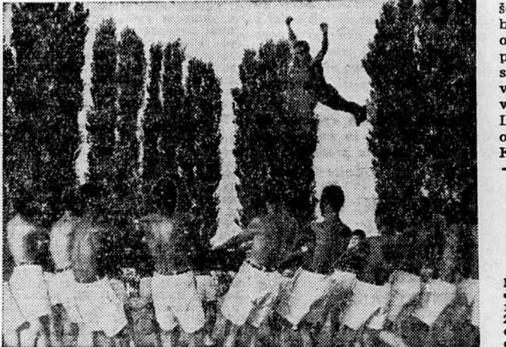
Za nastop mornarjev naše vojne mornarice je vsepovsod ogromno zanimanje. V svojem sporedu, ki obsega osem različnih vaj, bodo naši mornarji pokazali velike sposobnosti — mojtrovstvo, česar Ljubljancem doslej gotovo še niso videli. Prireditev bo jutri ob 16 na stadionu Odreda. Vstopnice se dobe v prodaji v Narodnem domu in v trgovini Slovenija sport (Ajdovščina)

Strokovna dela pri obnovi kočevskega vodovoda vodi inž. Stojan Guzelj, načelnik Zavoda za urbanizem in komunalno tehniko v Ljubljani. Sedaj je za ureditev kočevskega vodovoda odobrenih 9 milijonov din kredita. Stroški bodo sicer precej večji, toda prihranki, ki jih bodo s tem dosegli v Kočevju, so skorajda neprecenljivi. A. P.