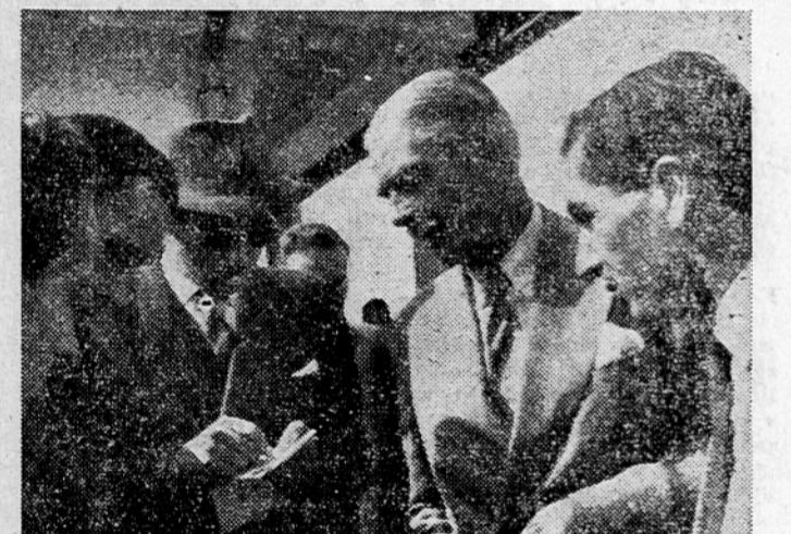
G. Anthony Eden daje na letališču izjavo za javnost