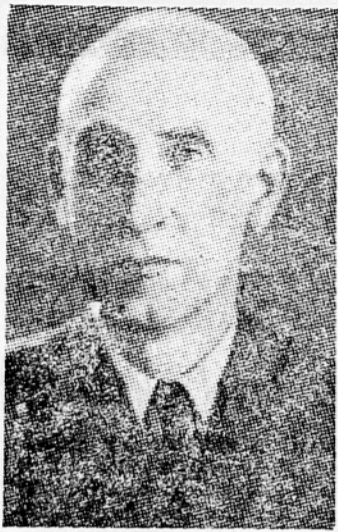
Predsednik perzijske vlade dr. M. Mosadik