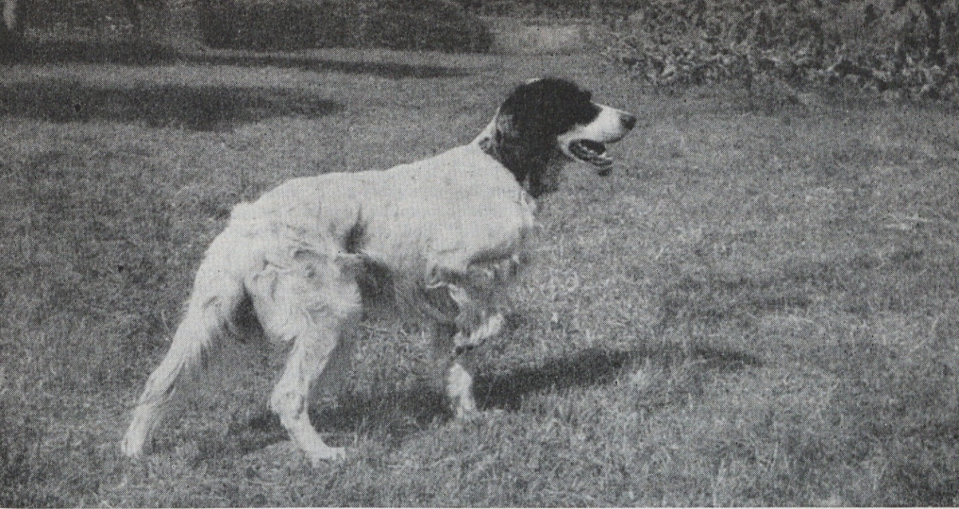
Ledika, angl. seterka, 3 leta; rejec R. Zemljč, Ljutomer