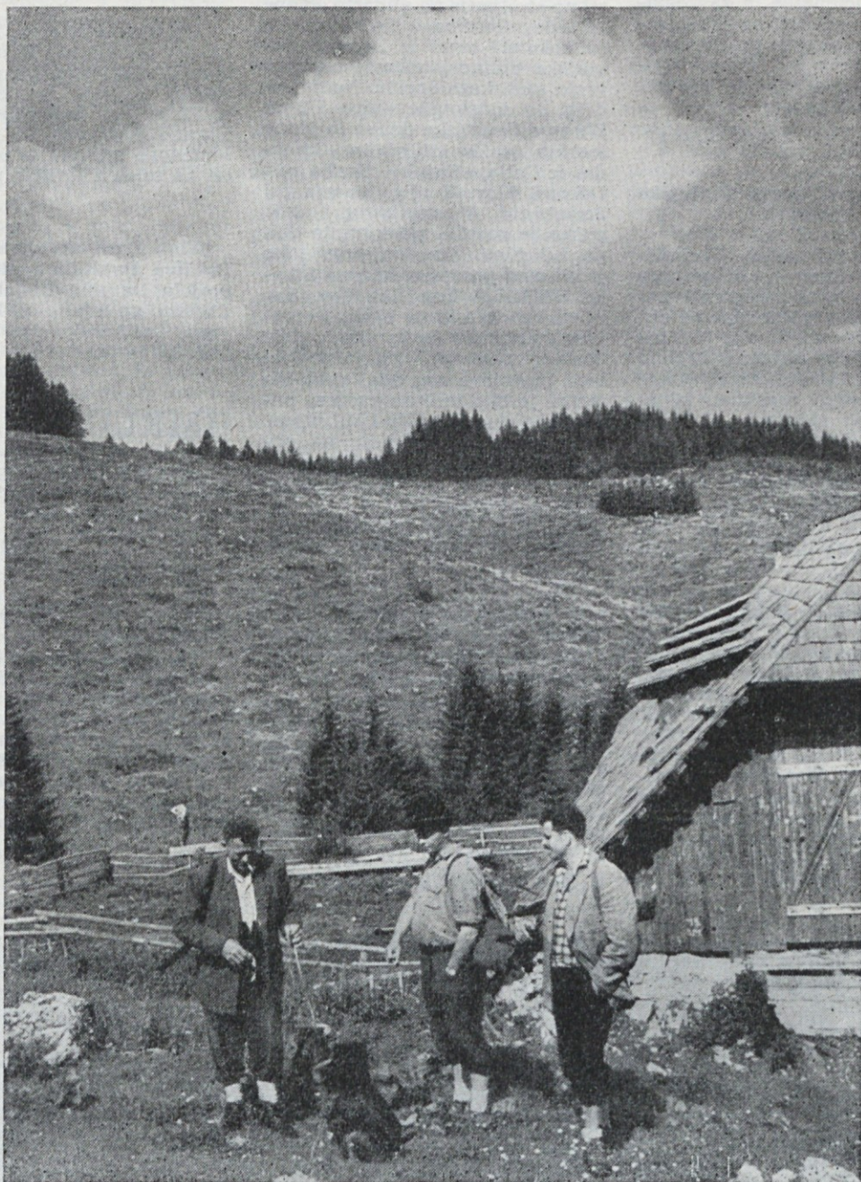
Na Jelovici — Gorenjsko