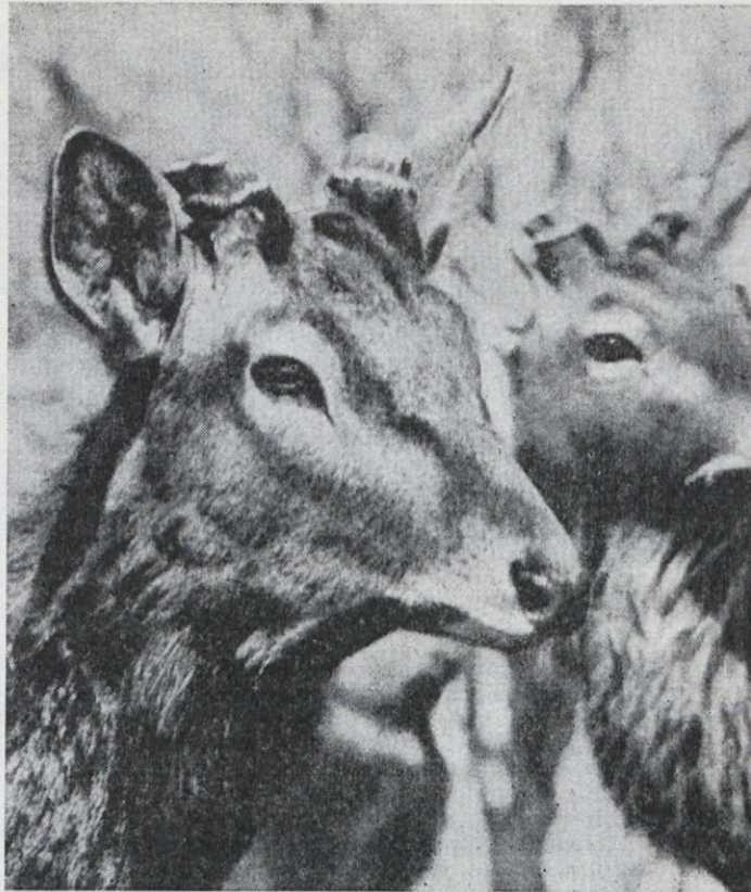
Jeleni s požaganim rogovjem

V teh stajah imajo navadno osamljene, zaprte prostore. Iz teh zvabijo jelena v poseben prostor