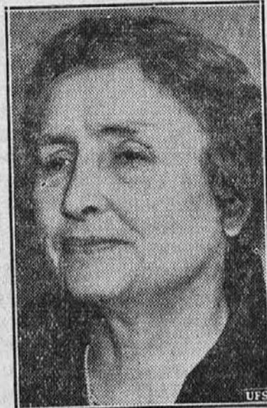
Helen Keller, priznana ameriška pisateljica, ki je slepa in gluha že od svojega drugega leta, je dobila Rooseveltovo medaljo za 1936. Medalja ji je bila po-dana v priznanje odličnih zmoglosti in dela za vzgojo ameriške mladine.