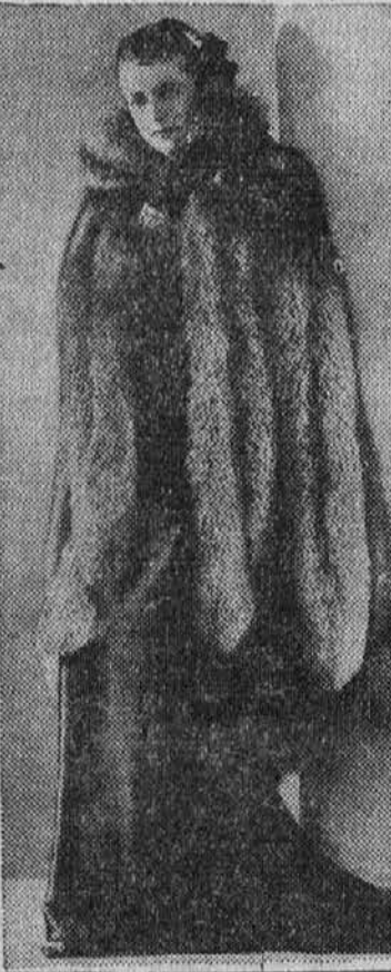
Na avtomobilski razstavi v Clevelandu bo pokazana tudi najnovejša ženska moda. Eno teh vidite na sliki in sicer kožuh iz kože srebrne lisice.