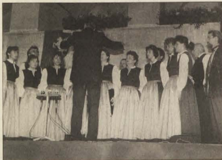
Mešani pevski zbor „Srce“ je pozdravil publiko

Prireditelji poletnega koncerta so si zastavili cilj, da turistom približajo del slovenske kulture. Mislim, da jim je to s sporedom prireditve „glasbeni kontrasti“ kar uspelo.