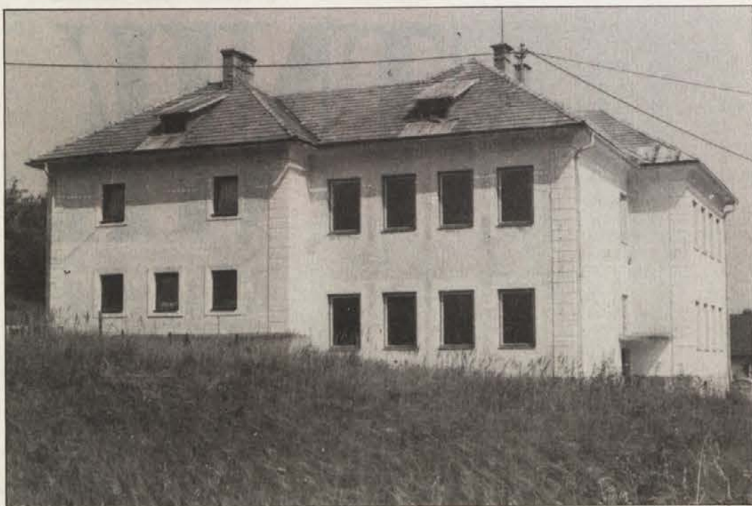
1,8 milijona šilingov za obnovo šolskega poslopja 'Schulvereina Südmark' v Področici?