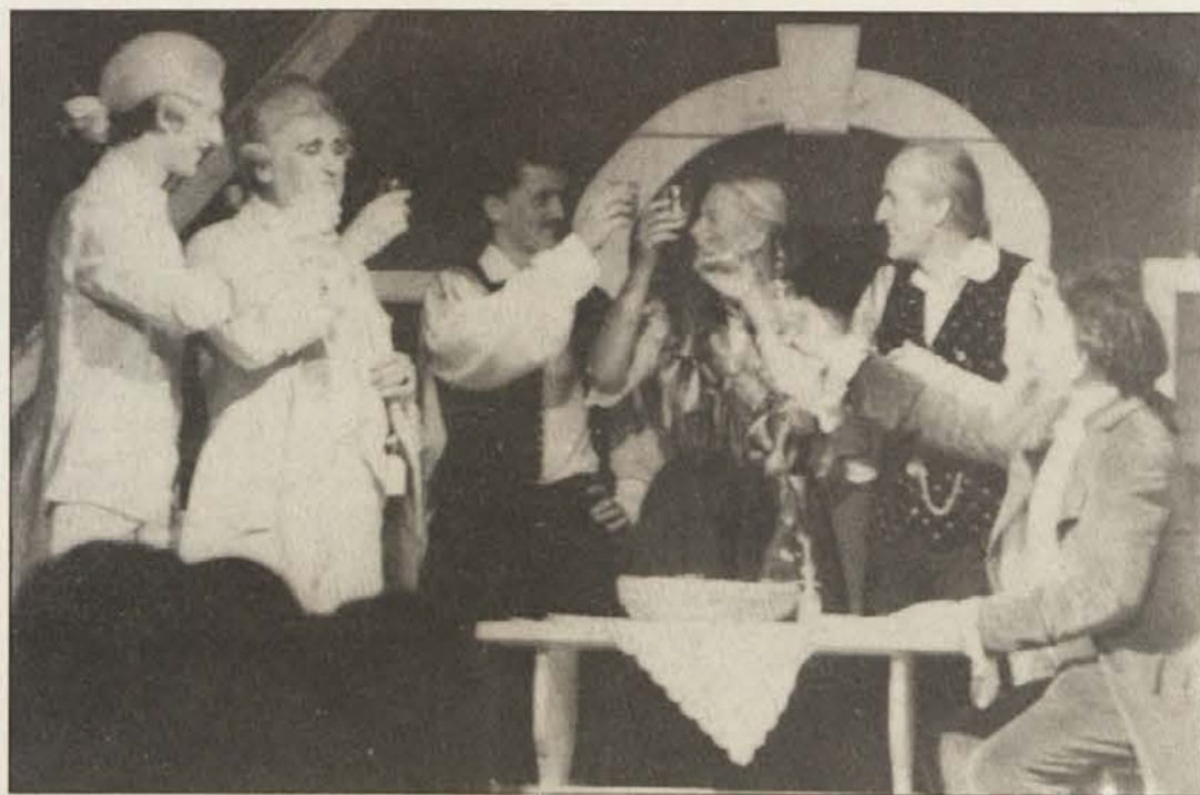
Šribanje poročnega pisma, celovška gospoda se pošlata po žepih – ena zaključnih scen 'Županove Micke'.

DUNAJ.- Pretekli teden je svojo 65-letnico obhajal lirik Ernst Jandl. Bolj kot katerikoli drugi sodobni avstrijski avtor se je Jandl zapisal inovativnemu obnavljanju svojega ustvarjalnega področja. Sprva je z jezikom eksperimentalni in ustvarjal za uho nenavadne besedne igre, nato pa je vedno bolj odkrival pomen ritmike ter glasbene dinamike za pesem. Čeprav nikdar ni bil glasbenik, se je s svojim ustvarjanjem podal globoko v področje glasbe. Zlasti v osemdesetih letih so mnoge Jandlove pesmi priredili v jazz-kompozicije.