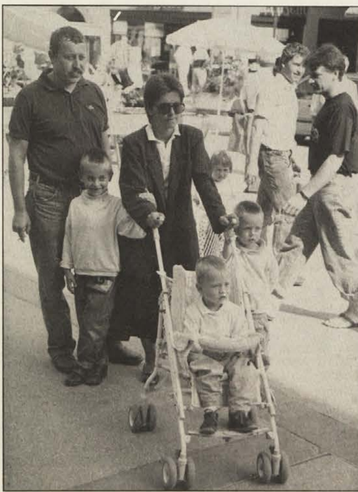
Vsi starši za svoje otroke ne najdejo prostora v kakšnem vrtcu