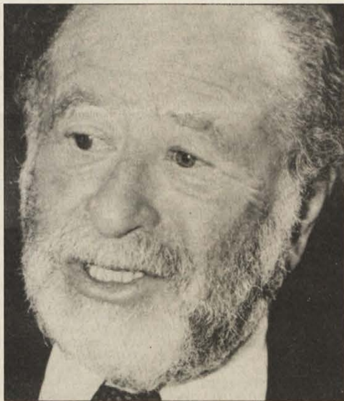
Geslo Bruna Kreiskega ob volitvah v sedemdesetih letih se je glasilo „za moderno Avstrijo“.

Bil je trinajst let zvezni kancler republike, kar je do zdaj najdaljša doba v Avstriji. Vsega skupaj je bil 26 let član avstrijske vlade – tudi to je avstrijski rekord. V letih med 1956 in 1983 je bil član avstrijskega parlamenta. Leta 1967 je nasledil Bruna Pittnerja kot vodja SPÖ ter jo vodil vse do odstopa leta 1983. Leta 1987 je Kreisky odstopil tudi kot častni predsednik SPÖ, ker se je sprl z vodstvom stranke predvsem zaradi velike koalicije z ljudsko stranko ter prepustitve zunanega ministrstva Aloisu Mocku. Obdržal je le še funkcijo podpredsednika Sociali-