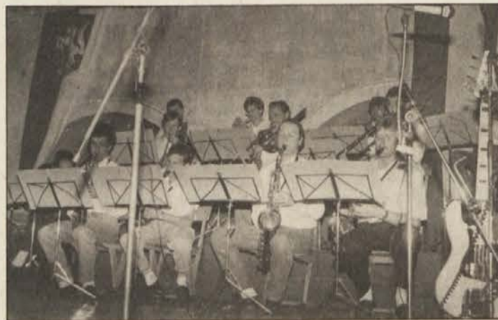
„Big Band“ iz Šmihela išče nove smeri