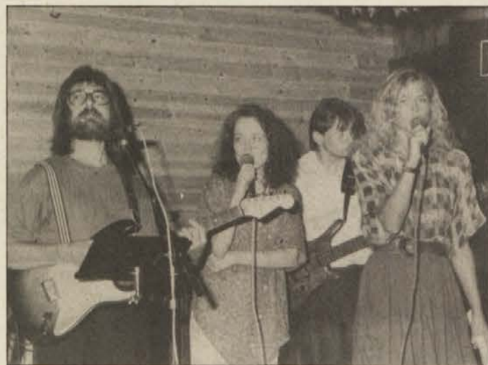
Po koncertu je zaigral domači ansambel Drava