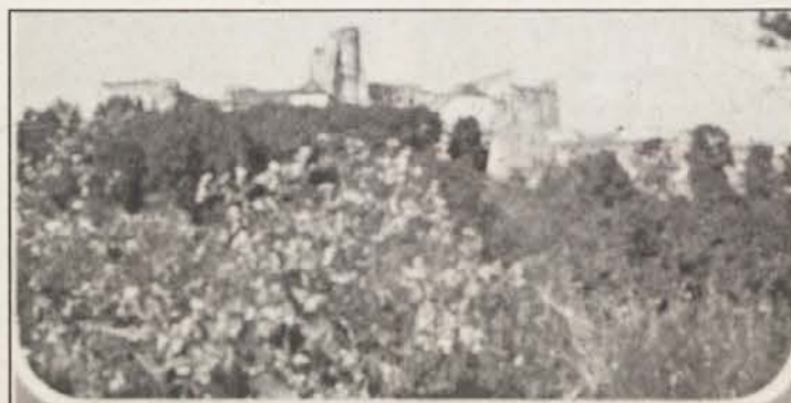
STARÁ LUBOVŇA A OKOLIE

Pripravi: Franček Černut in Miha Travnik