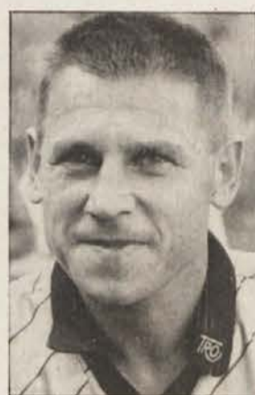
Cilj Bilčovščanov (na sliki levo) in legionarja Stojilkovskega (zgoraj) je tudi letos obstoj v spodnji ligi. Predvsem je letos slaba obramba.