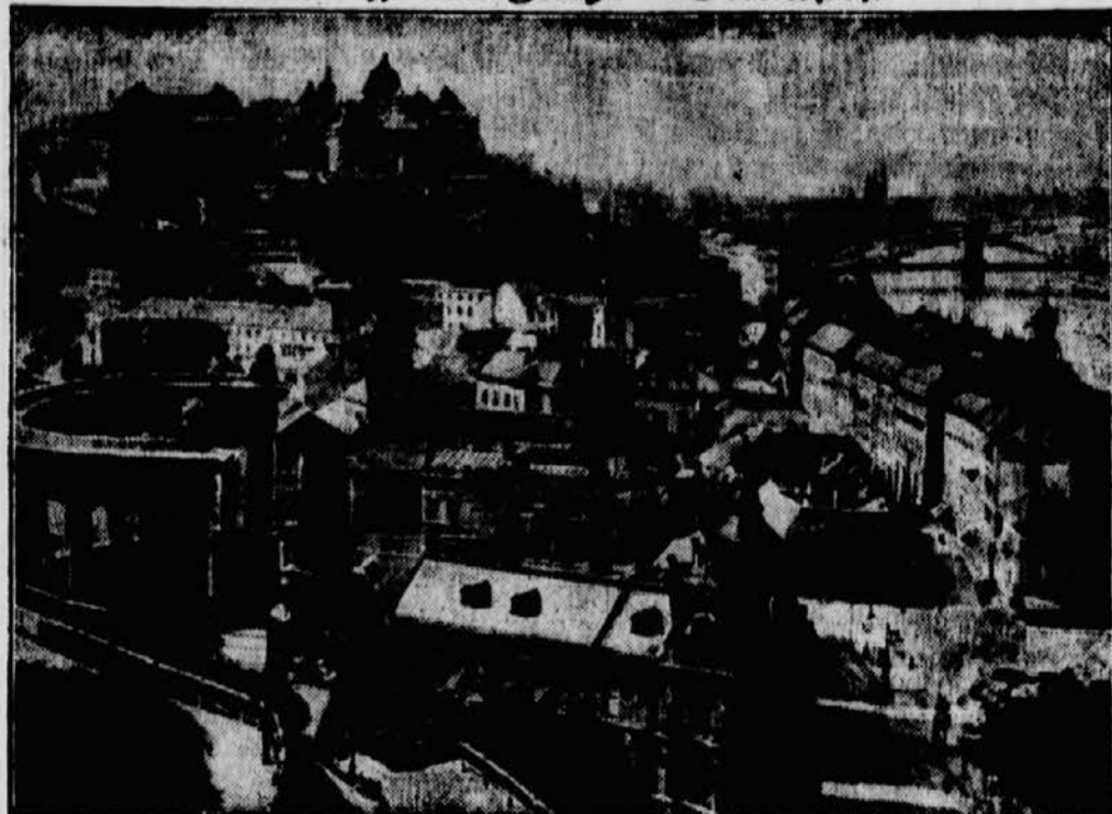
Bunt und mannigfaltig ist die Hauptstadt Ungarns, die reich an schönen Gebäuden ist. Sie wird überragt von der königlichen Burg, die einen wahrhaft königlichen Eindruck macht.