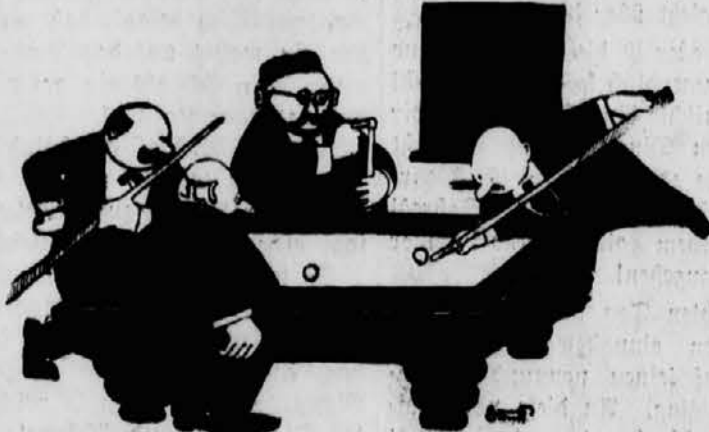
Der Brandhuber ist Faszspieler geworden! in seinem Leben ein Spiel Karten angeführt! — „Der Brandhuber? Unmöglich, der hat ja noch nie Klavier zu spielen!“