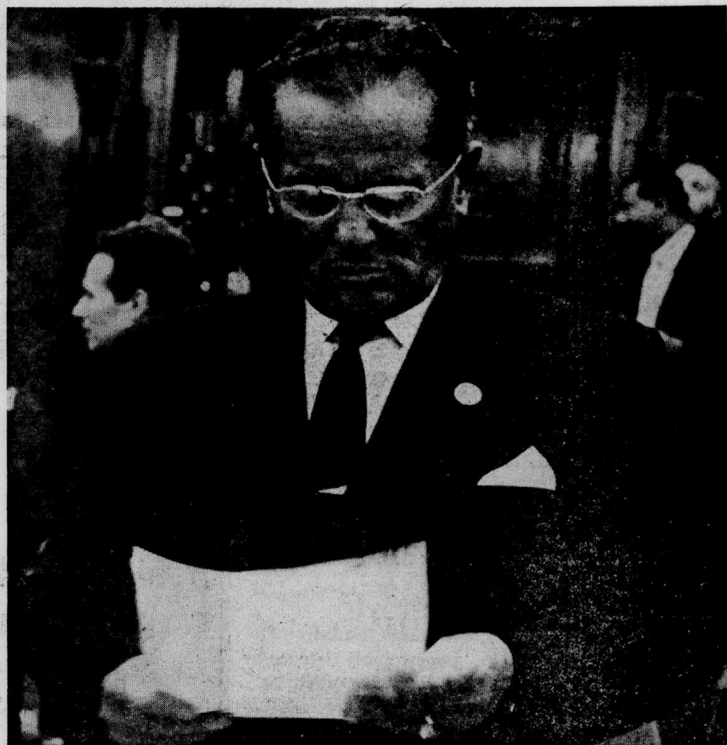
»Ko smo ubrali neodvisno pot, ne da bi se priključili grupacijam držav v dveh nasprotujočih si taborih, in ko smo se uprli politiki razdelitve sveta in zavrnili vse, kar ta politika prinaša s seboj — smo izbrali težko pot. Pa vendar smo imeli moč, da uberemo to pot in na njej vztrajamo, pri čemer smo oznanjali in uveljavljali program miru in koeksistence, ki je dandanes na svetu široko znan in priznan, spričo njega pa smo lahko prispevali in stalno povečevali svoj prispevek k splošni stvari.»

Politika neuvrščenosti je specifična oblika integracije naprednih družbenih gibanj, ki spodbujajo napredne spremembe celote mednarodnih odnosov. Spremembe v razmerju sil v svetu potekajo v korist politike, za katero so se opredelile neuvrščene države, saj sprejema njena načela čedalje več narodov, strank in gibanj. To kaže tudi nenehne porasti števila udeležencev na konferencah neuvrščenih držav, gradnja do Kaira in Lusake, to kažejo tudi dosedanje priprave na konferenco v Alžiru.