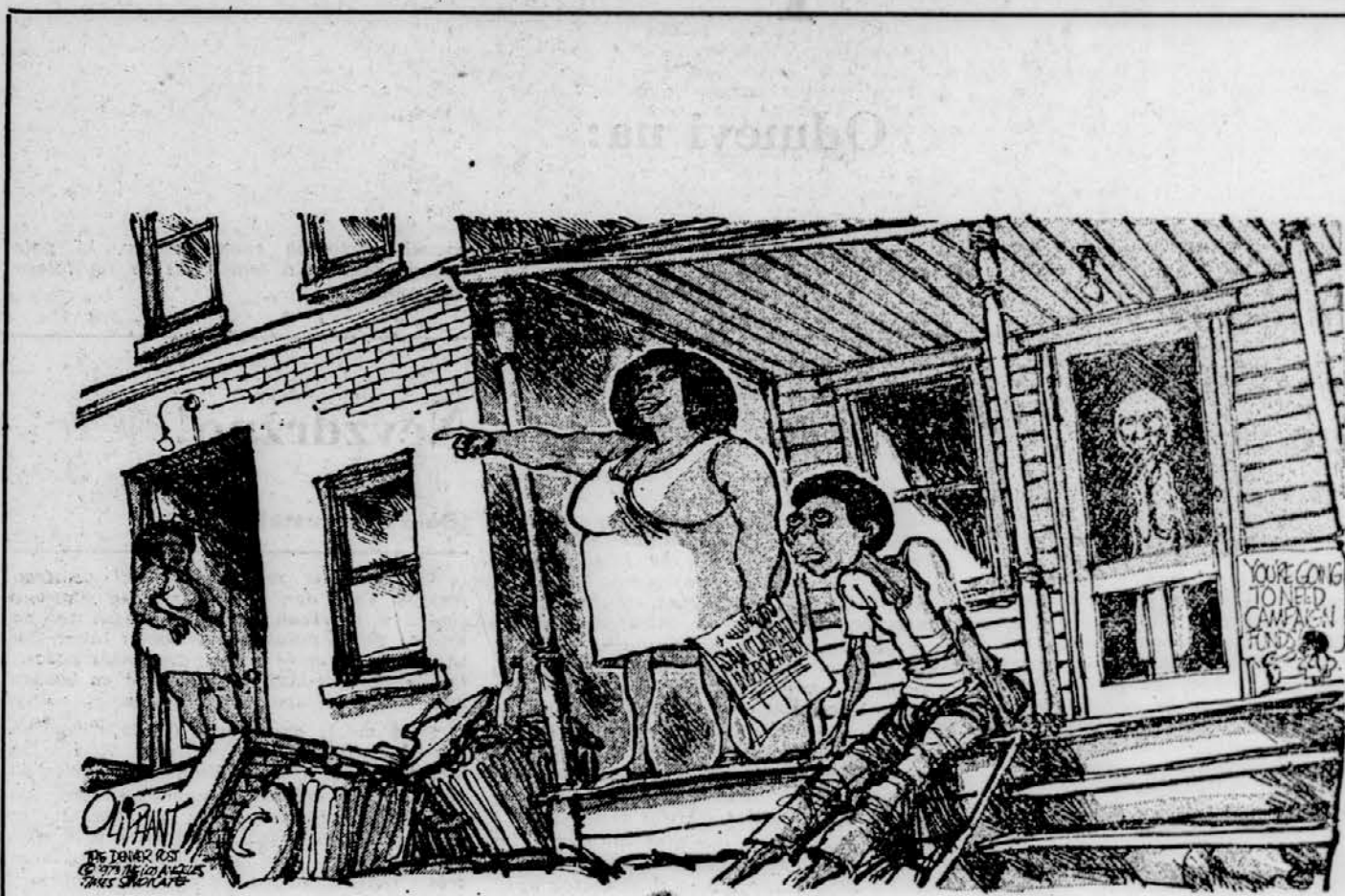
— In sedaj, ko so varnostne naprave v redu in ko so namestili čistilec v plavalnem bazenu ter namakalne naprave, bi rada tamle imela drog za zastavo (OLIPHANT, »The Denver Post«)