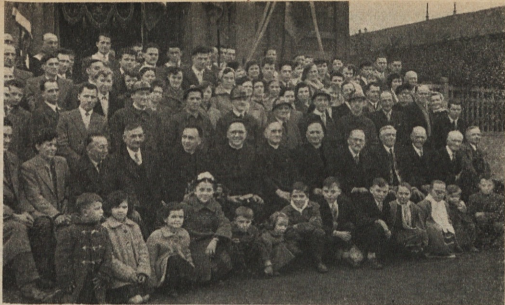
Skupina slovenskih izseljencev, zbranih v Mericourt—Sallaumines — Pas de Calais dne 9. oktobra 1955 ob priliki proslave 30-letnega obstoja ondotnega Društva sv. Barbare.