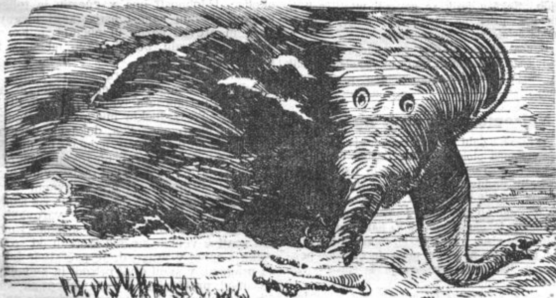
Ogromna morska žival, tako zvana «opica», ki izloča črno tekočino daleč naokrog, tako da se popolnoma skrije v počezeli vodi.

× Imenitna opica Jon Daniel. Londonski zverinjak je te dni dobil slavnega novega gosta — najimenitnejšo opico na svetu, po imenu Jon Daniel. Pripeljali so ga iz Amerike. Jon Daniel ni navadna «afna», kakor pravijo Ljubljančani, marveč polčlovek v opičji podobi. Hodi po dveh nogah, je oblečen v frak in cilindar in ima na razpolago poseben avtomobil, v katerem se poleg svojega streznika vodi na sprehode. V zverinjaku ima na razpolago salonsko kletko z modernim pohištvom, da, niti veliko ogledalo ne manjka. Ko se je Jon Daniel pripeljal v London, ga je na kolodvoru sprejela ogromna množica kakor kakega vojvodo. In še zdaj ga Londončani burno pozdravljajo, kadar se vozi na sprehod, dočim je okrog njegove kletke vselej polno otrok, ki so nori vanj in mu prinašajo razna darila. Jon Daniel najraje je južno sadje in čokolado. Popoldne navadno sprejema obiskovalce, med njimi slavne