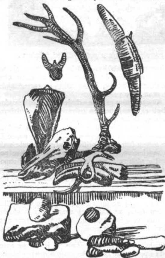
Razno izkopano orodje, ki se nahaja v ljubljanskem muzeju.

Zakaj so se takratni prebivalci naseljevali na vodi, ni težko uganiti. Na kopnem človek tedaj ni bil varen pred sovražnimi napadi in divjimi zvermi, ki so polnile temne gozdove. Zato se je umaknil na jezero in si postavil domove na kole, zabite v blatno dno. Zaradi večje varnosti so zgradili celo vas in pomagali drug drugemu s svojim okornim orodjem. Moški so hodili v boj in na lov, ženske pa so skrbele za dom. Gojile so domačo živino, pripravljale jed in tudi obleko, sešito večinoma iz živalskih kož. Rokodelci so tesali leseno ter drugo orodje in izdelovali čolne.