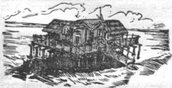
Takšne približno so bile stavbe na kolih na Ljubljanskem barju.