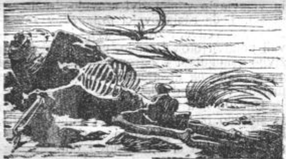
Dkostnjak ponesrečenega potapljača na dnu morja.

To, kar je do danes odkril človek o tajnostih morskih globin, je le drobec proti onemu, kar je še odtegnjeno človeškemu poznanju. Podjetni in drzni raziskovalci ter potapljači so s svojimi pripravami prodrli že globoko v morje, toda kaj je v najglobljih vodnih plasteh morja, nam je še neznan. Često so to strahovne globočine, katerih še ni bilo mogoče niti premeriti.