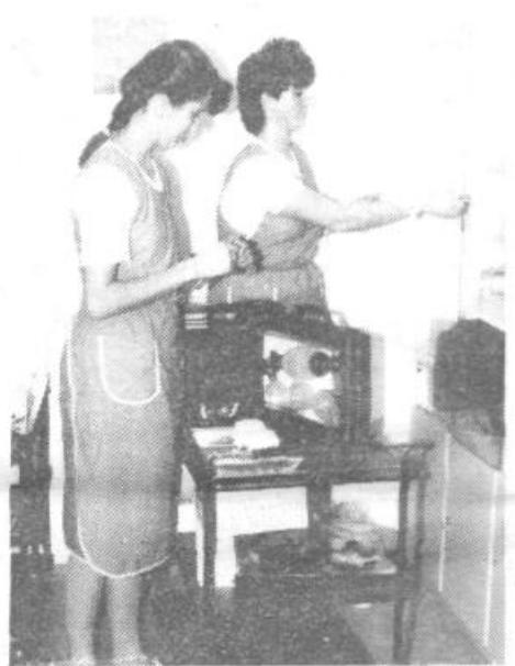
Otrokom v zdravstvenem domu je na voljo tudi ordinacija za nujne intervencije