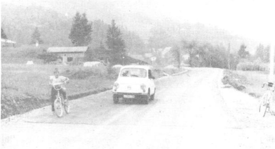
Voznikom, ki se vozijo skozi Briše je zdaj odleglo