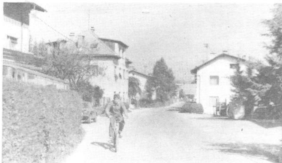
Promet na ozki Brdnikovi ulici postaja vse nevarnejši

Ni ravno malo velikih in raztresenih krajevnih skupnosti, ki bi dale ne vem kaj, ko bi mogle svoje urbane (naseljene) sredine strniti vsaj – nekoliko bolj skupaj, v čimbolj povezano komunalno celoto.