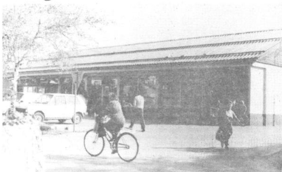
Z osnovno preskrbo krajanov na Brdu ni težav. Za to skrbi Mercatorjeva samopostrežna trgovina na glavnem križišču.