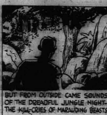
BUT FROM OUTSIDE CAME SOUNDS OF THE DREADFUL JUNGLE NIGHT—THE KILL-CRIES OF MARAUDING BEASTS.