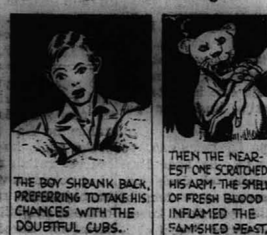
THE BOY SHRANK BACK, PREFERRING TO TAKE HIS CHANCES WITH THE DOUBTFUL CUBS. THEN THE NEAREST ONE SCRATCHED HIS ARM. THE SHRIEK OF FRESH BLOOD INFLAMED THE FAMISHED BEAST.

Mladi levi so bili prijazni, toda nastopajoči glad jih je prisilil, da so postali prav nevarni prijatelji.