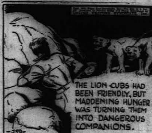
THE LION CUBS HAD BEEN FRIENDLY, BUT MADDENING HUNGER WAS TURNING THEM INTO DANGEROUS COMPANIONS.