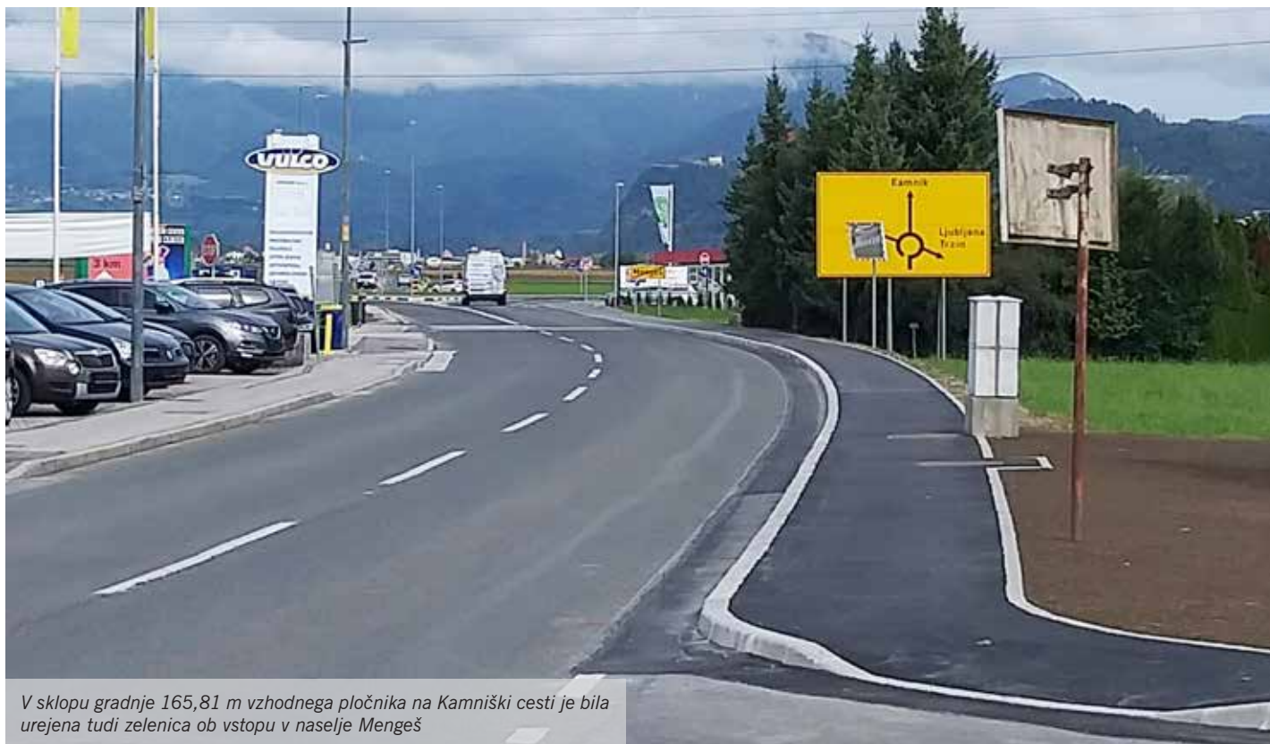
V sklopu gradnje 165,81 m vzhodnega pločnika na Kamniški cesti je bila urejena tudi zelenica ob vstopu v naselje Mengeš

Občina Mengeš je na vzhodni strani Kamniške ceste zgradila pločnik, ki povezuje naselje z novim bencinskim servisom Petrol, kar vsem omogoča varnejši sprehod do izbranih poljskih poti. Urejena je bila tudi zelenica ob vstopu v naselje Mengeš. Pločnik na zahodnem delu ceste, v dolžini 60 m in širini 1,5 m, se bo urejal po sprejemu rebalansa Proračuna občine Mengeš za leto 2019.