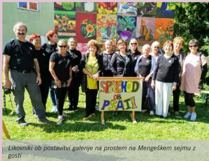
Likovniki ob postavitvi galerije na prostem na Mengeškem sejmu z gosti

S pesmijo v srcu se je v petek, 20. septembra, začelo malo megleno jutro in »Dobro jutro« v Mengšu, oddaja TV Slovenija. Predstavljala so se mengeška kulturna društva. Ob poskočni glasbi Godbe Mengeš, ki praznuje že 135. obletnico delovanja, ter ubranem petju vokalnih skupin se je oddaja Dobro jutro začela s prenosom v živo.