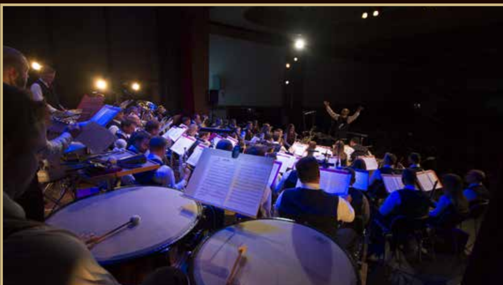
Pogled z odra.