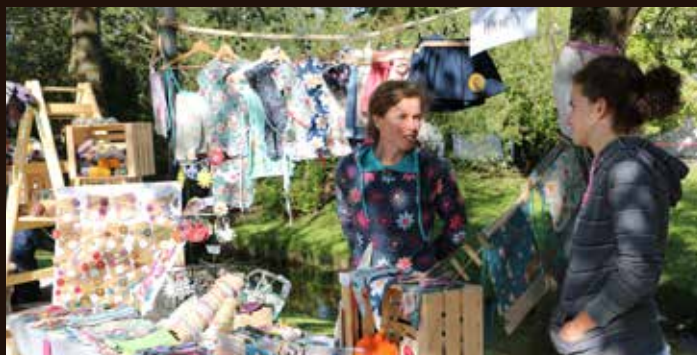
Na sejmu je bilo več kot 30 stojničarjev, ki so v sončnem dnevu vabili kupce