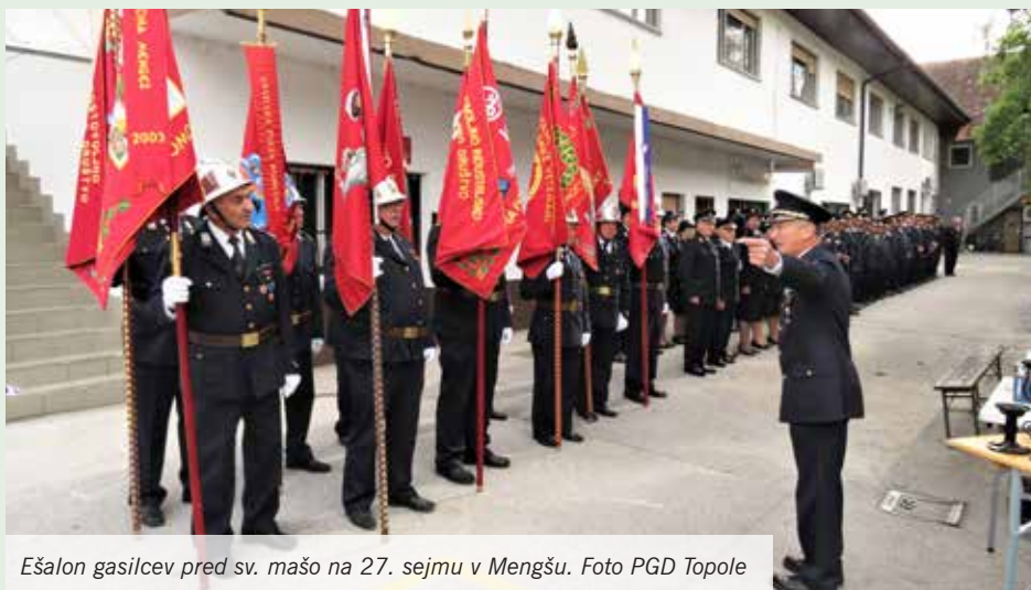
Ešalon gasilcev pred sv. mašo na 27. sejmu v Mengšu.