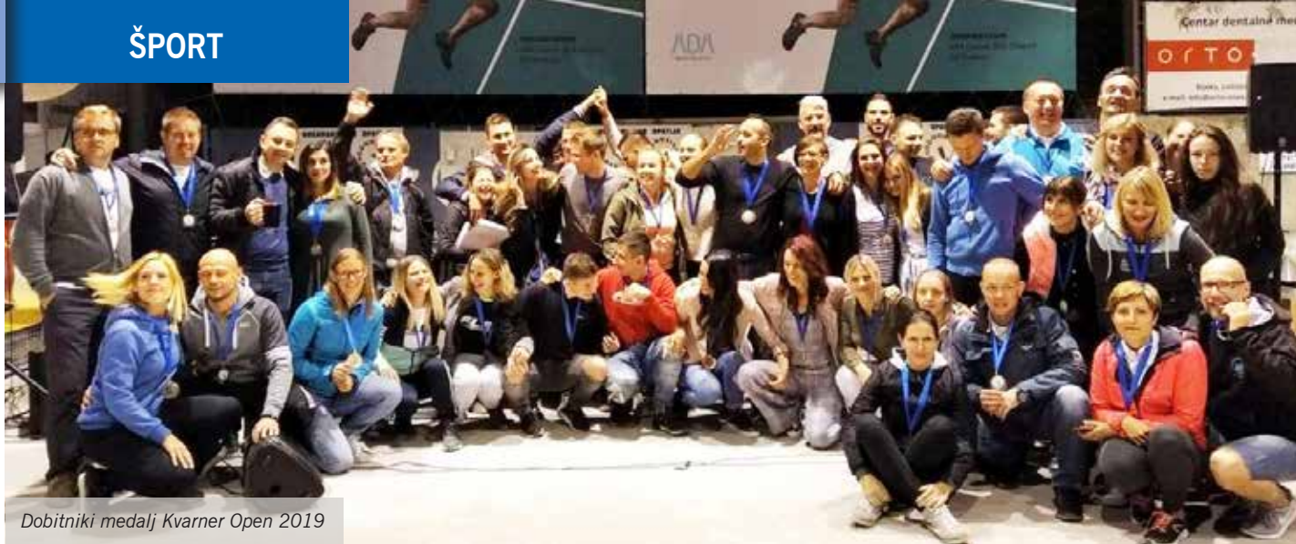
Dobitniki medalj Kvarner Open 2019