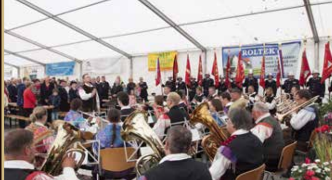
Tradicionalno igranje pri sejemski sv. maši.