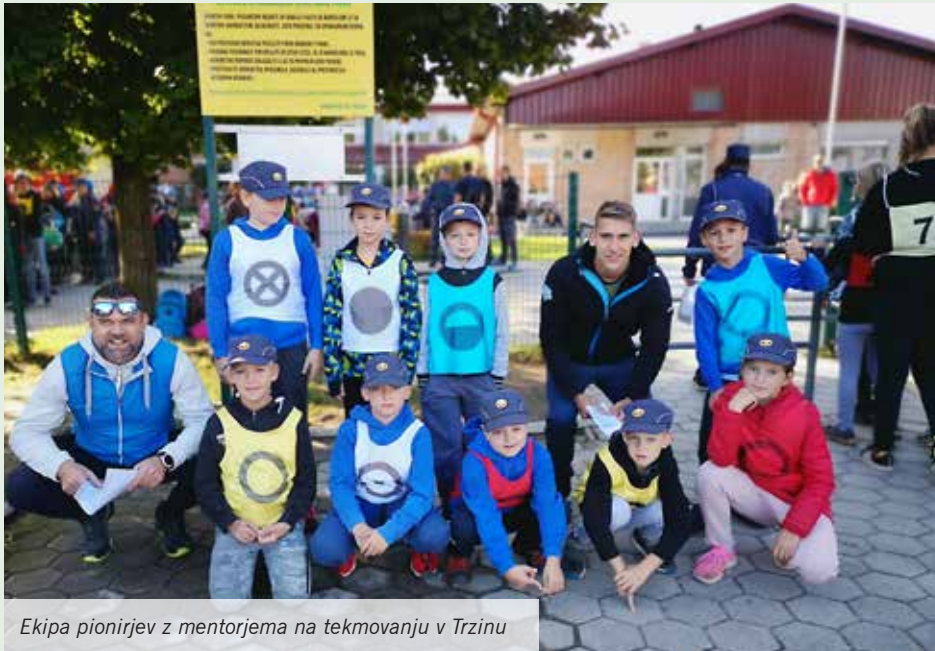
Ekipa pionirjev z mentorjema na tekmovanju v Trzinu

Na Osnovni šoli Roje učence vzgajamo v skrbi za naravo in njene darove. 21. september je dan, ki ga je OZN razglasila za svetovni dan miru. To je tudi dan, ko se mnogo šol in otrok poveže v skupni misli miru in prijateljstva. Na tisoče šol iz 150 držav vsega sveta je te dni svoje misli in dejanja združilo v sajenju dreves. Tudi mi smo se pridružili temu dogodku.