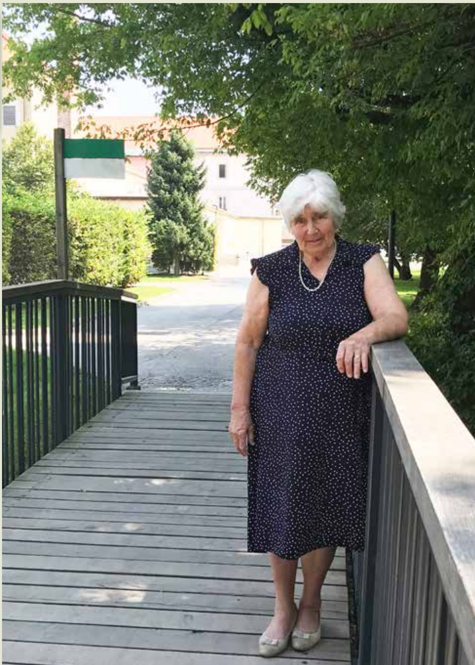
»V slovenskem prostoru je Mengeš edinstven kraj, ki slovi po glasbi in glasbilih.«

Z velikim spoštovanjem sprejemam vso ljudsko dediščino. Ljudska ustvarjalnost je pomagala našemu narodu preživeti trdo, zelo trdo zgodovino. Preživeli smo veliko hudega,