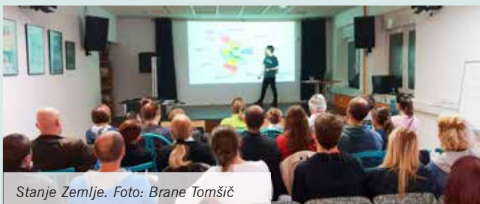
Stanje Zemlje.