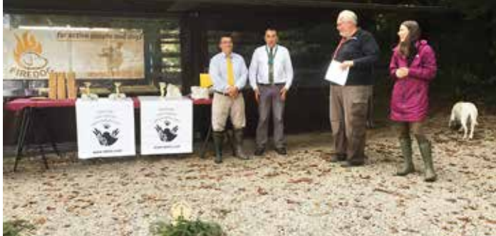
Češki in madžarski sodnik sta sodila na sobotnem delovnem testu, na podelitvi nagrad in priznanj najbolj uspešnim tekmovalnim parom pred lovsko kočjo v Mengšu