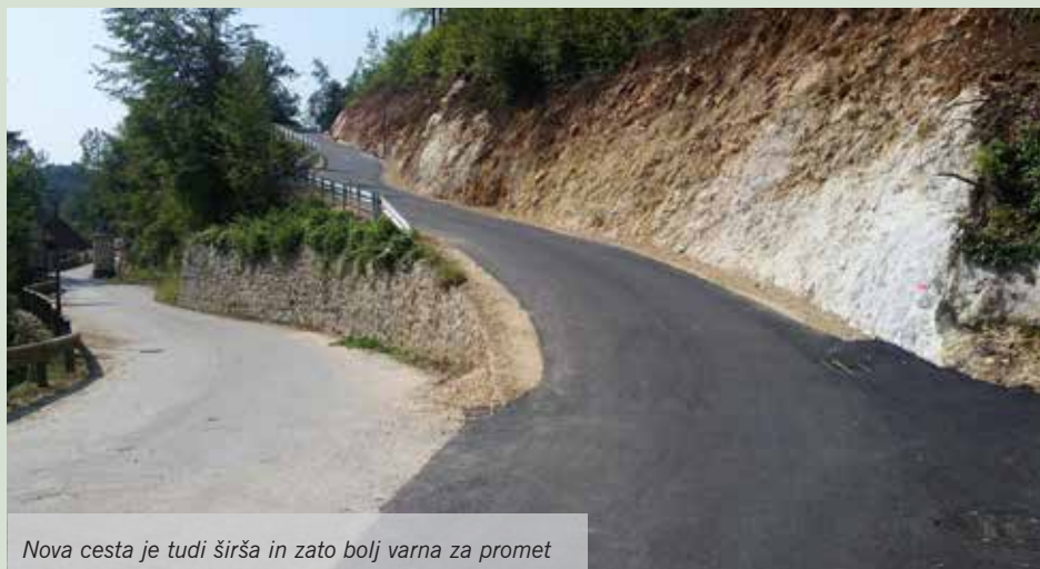
Nova cesta je tudi širša in zato bolj varna za promet