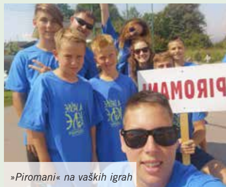
»Piomani« na vaških igrah