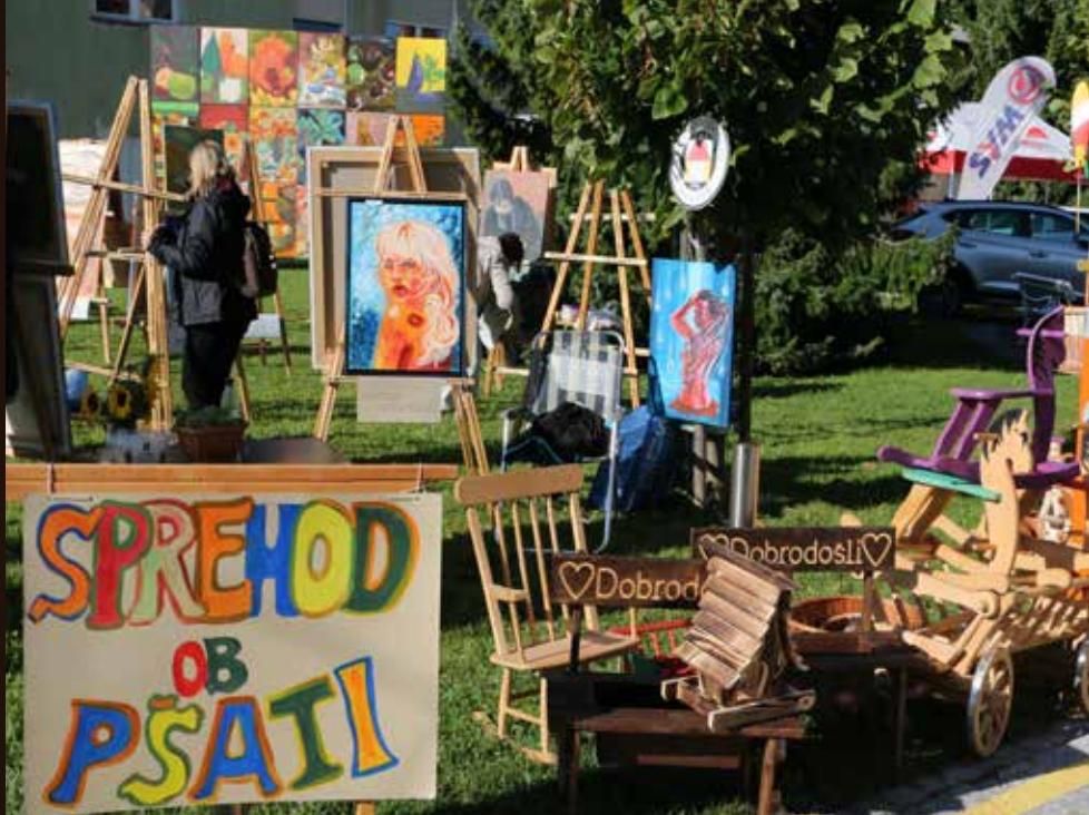
Stalna razstava likovnega društva je dobila novo lokacijo na začetku sejma