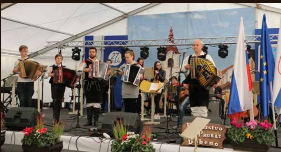
Stoparji so odprli sobotno glasbeno dogajanje