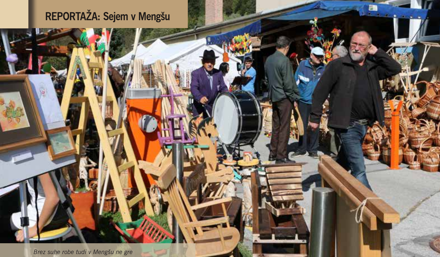
Brez suhe robe tudi v Mengšu ne gre