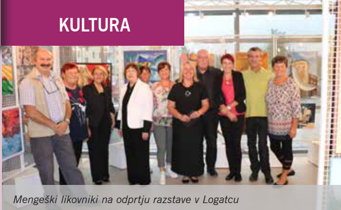
Mengeški likovniki na odprtju razstave v Logatcu