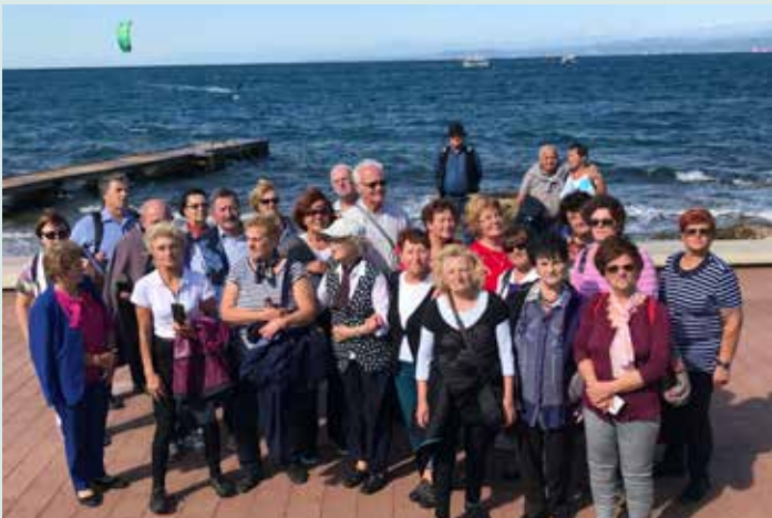
Skupinska slika upokojevcev na izolski obali.