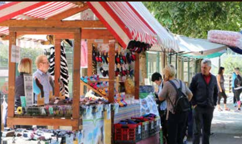
Na stojnicah so se našli tudi izdelki, ki jih je v klasičnih trgovinah težje najti