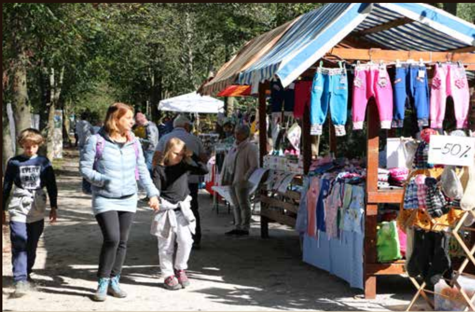
Stojnice so se šibile pod blagom in popusti so dodatno vabili mimoidoče