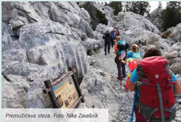
Premužičeva steza.

Na lep septembrski vikend tega leta, 14. in 15. septembra, se je 40 parov gojzarjev odpravilo v Narodni park Severni Velebit, da prehodijo prvi del Premužičeve steze. Gre za zelo dobro markirano in položno pot. Zgradili so jo med leti 1930–1933 z namenom popularizacije pohodništva. Najvišji vzpon je približno 200 m in je zato primerna tudi za začetnike. Celotna steza je dolga 57 km, od Zavižana do Baških Oštarij, mi smo naredili začetnih 16 km na odseku Zavižan–Alan.