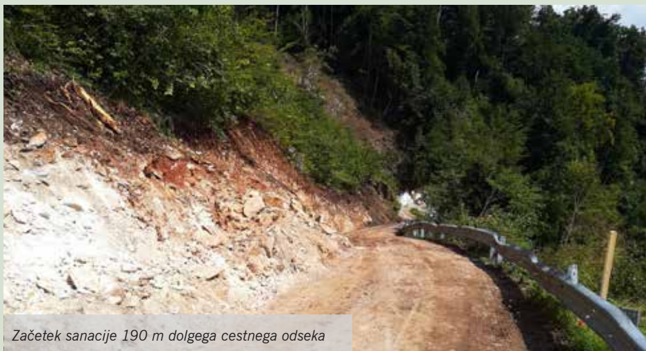
Začetek sanacije 190 m dolgega cestnega odseka

Poletno zatišje, ki v poletnih mesecih zajame dobršen del sveta, je doseglo tudi Dobeno, najbolj zeleno in najvišje ležeče naselje v naši občini. To se je odražalo predvsem na parkiriščih dobenskih gostincev, na cestah v naselju in celo na pohodnih poteh je bilo opaziti manj ljubiteljev narave. Mir in tišina pa sta se izognila Spodnjemu Dobenu, za kar so poskrbeli delavci Gorenjske gradbene družbe.