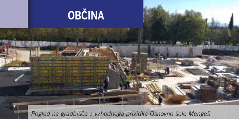
Pogled na gradbišče z vzhodnega prizidka Osnovne šole Mengeš