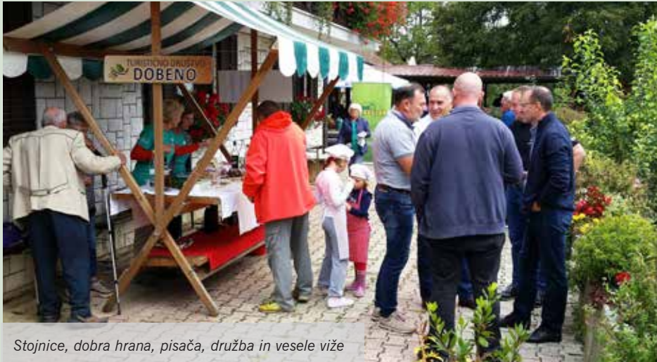
Stojnice, dobra hrana, pisača, družba in vesele viže

Tradicionalni dobenski praznik, ki ga organizira Turistično društvo Dobeno, že nekaj let skupaj s kmečkim turizmom »Blaž«, je bil letos izveden že devetič. Po organizacijski plati najzahtevnejši in po udeležbi najbolj obiskan dogodek v letu na Dobenu, s pestrim programom in dobrim izborom nastopajočih vsako leto privabil lepo število obiskovalcev. Žal nam vreme, ki nam zadnjih nekaj let ni bilo naklonjeno, tudi letos ni šlo na roko. Kljub slabi vremenski napovedi smo se odločili, da prireditvev izpeljemo. Tako smo na prizorišču postavili nekaj šotorov (»arafatov«), da bi v primeru dežja lahko izvedli planirane dogodke.