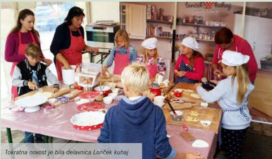
Tokratna novost je bila delavnica Lonček kuhaj

Dobenski praznik je družabni, zabavno-športni in kulturni dogodek, v izvedbi TD Dobeno, ki povezuje mlade in starejše, domačine in obiskovalce. Ker pa kraj nima lastnega prostora za takšno ali podobno prireditvev oz. druženje, smo tudi letos združili moči s KT Blaž.