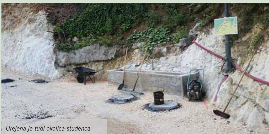
Urejena je tudi okolica studenca

Žled, ki je leta 2014 povzročil veliko škode, predvsem v gozdovih na našem območju, je močno poškodoval tudi cesto na Sp. Dobeno. Podrta in izravana drevesa so močno poškodovala zaščitno ograjo in brežino. Kamenje in skale, ki jih niso več držale korenine in debla podrhtih dreves, so padale na zgornjo in tudi spodnjo dobensko cesto, kar je ogrožalo varnost vseh uporabnikov te prometne povezave. Ker je bila cesta na Sp. Dobeno v zasebni lasti, občina ceste ni mogla sanirati, dokler se lastništvo ni uredilo. Urejanje lastništva med lastnikom in občino pa se je zaradi različnih (neznanih?) vzrokov vleklo kar nerazumna štiri leta, sledil je razpis za izvedbo del in spet je minilo precej časa, da je ponudnik ujel finančni okvir, ki ga je občina namenila za 1. fazo obnove te ceste.