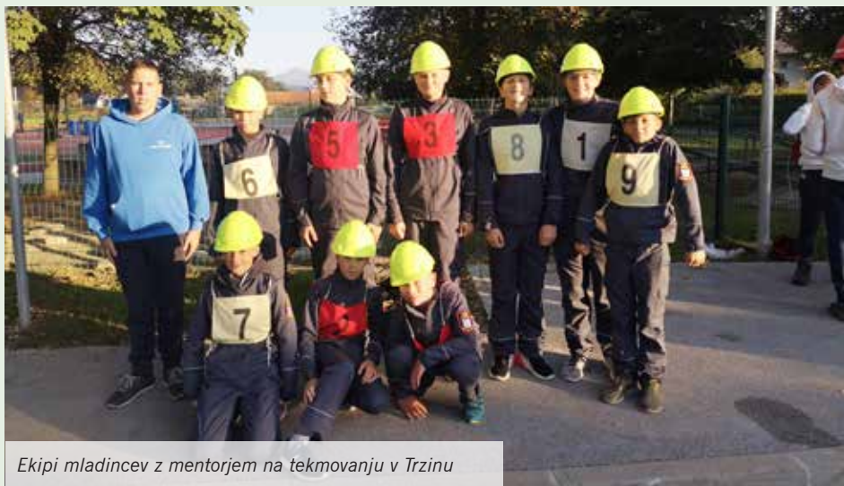
Ekipe mladincev z mentorjem na tekmovanju v Trzinu