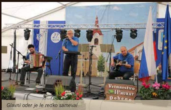
Glavni oder je le redko sameval