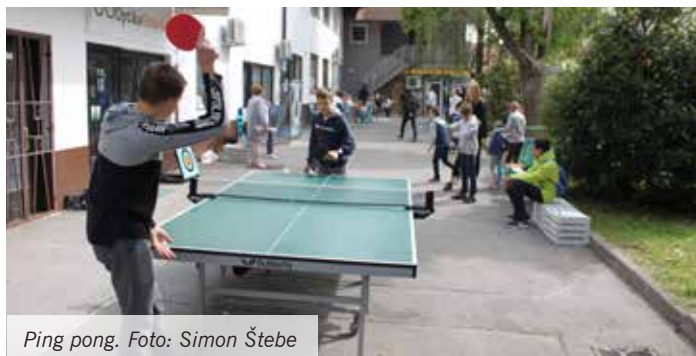
Ping pong.