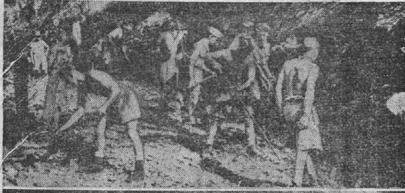
Na prvi sliki zgoraj je videti angleške saperje pri gradnji ceste na Burmi, na spodnji sliki pa je kos dograjene ceste, po kateri že prevažajo motorna vozila.