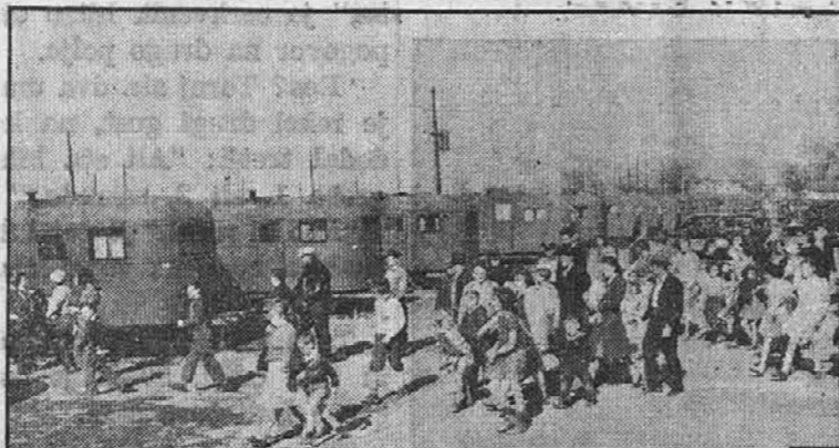
Delavci ladjedelnice v Portsmouthu, Va., pregledujejo svoječasne domove na kolesih, v tako zvanih "trailerjih."