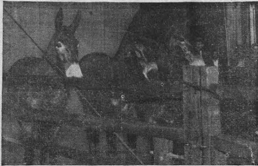
Na sliki vidimo troje mezgov, ki jih je kupilo vojaštvo v St. Louisu. Medzi bodo uporabljeni za prenašanje vojaških tovorov v krajih, kamor ne morejo motorna vozila.

val v najljubeznivejšem tonu: "Za nas je res silno neprijetno, da vas moramo držati v zaporu. Lahko vas zagotovim, da po mojem mnenju vaša krivda ni tako velika, kajti pri mali vaši inteligenci ni dvoma, da ste bili zapeljani. Povejte mi, gospod švejk, kdo vas prav za prav zavaja, da delate take neumnosti?"