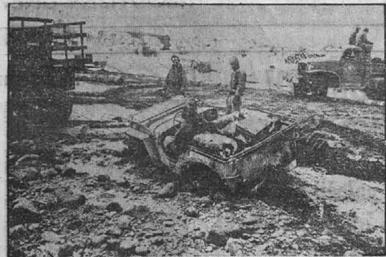
Na sliki vidimo, kako vleče velik vojaški truk iz blata mal vojaški "jeep" na Amčitka otoku.

V glavnem vam polagam na srce, da plačujete svoj assesment ob času. Vsako drugo nedeljo v mesecu sem v naši zbornovalni dvorani že od poldne naprej in vsakega 25. v mesecu, pa pobiram assesment na domu od šestih do pol devetih. Kdor želi plačat assesment pravočasno, ima dovolj priložnosti na razpolago. Nikar ne hodite krog tajnika potem, ko je že prepozno. Kadar je na seji sklenjeno, da se tega ali onega člana črta vsled zaostalega assesmenta in če je dotičnik že v letih, torej prestar za ponovni pristop, tedaj ne pomaga nobena "žauza" več in tudi na tajnika se vam ni treba jeziti, ampak se jezite sami nase in na svojo pozabljenost ali kar hočete.