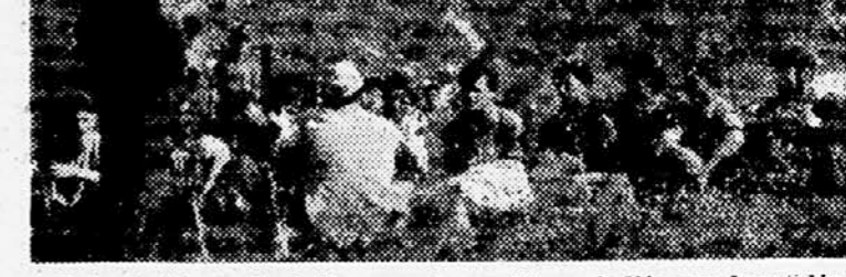
Pripadniki predvojaške vzgoje pazljivo sledijo predavatelju

Prepričani smo, da je sedaj naša delo vsakomur poznano, kakor tudi naše težave.