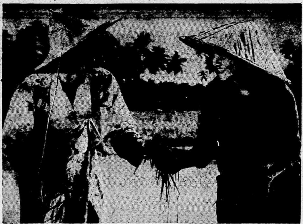
Kmalu bo prišel v naše kinematografe odlični angleški film »Skoki pekel« (A Town Like Alice), ki ga je režiral Jack Lee. In pripravljuje o grozotni poti, katero so morale prehoditi žene — Angličanke — za časa japonske okupacije Malaje. V glavni vlogi se je zelo lepo uveljavila Virginia Mc Kenna. Leva na naši sliki. Film je ocenjen kot najboljši angleški film proizvođalet leta 1954.

Torej, kje je nemški film? Če bi hoteli osvetliti njegovo pot, bi morali poseči še na marsikatero področje. Nikakor bi ne smeli izpuščati besede o nemški koprodukciji »vztrajnosti« (zaradi katere smo si tudi mi že opekli prste). Toda v glavnem je jasno: danes je nemški film v enem samem iskanju. Na Zahodu v iskanju filmskega trasta — po vzorcu nekdanjega UFA in v nezoprni borbi med stariimi »preizkušenimi« filmskimi mojstri ter mladimi močmi, ki vzbujajo upe. Na Vzhodu se po začetnih obetajočih uspehih utaplja v propagandističnem izživljanju, ki doslej še ni vrglo na vrh imena, od katerega bi opravičeno pričakovali vtrajnega hotenja, da bi dalo nemškemu filmu — složno s progresivnimi filmskimi umetniki v zahodnonemškem filmu — tisti ugled, ki ga je užival pred nastopom nacizma.