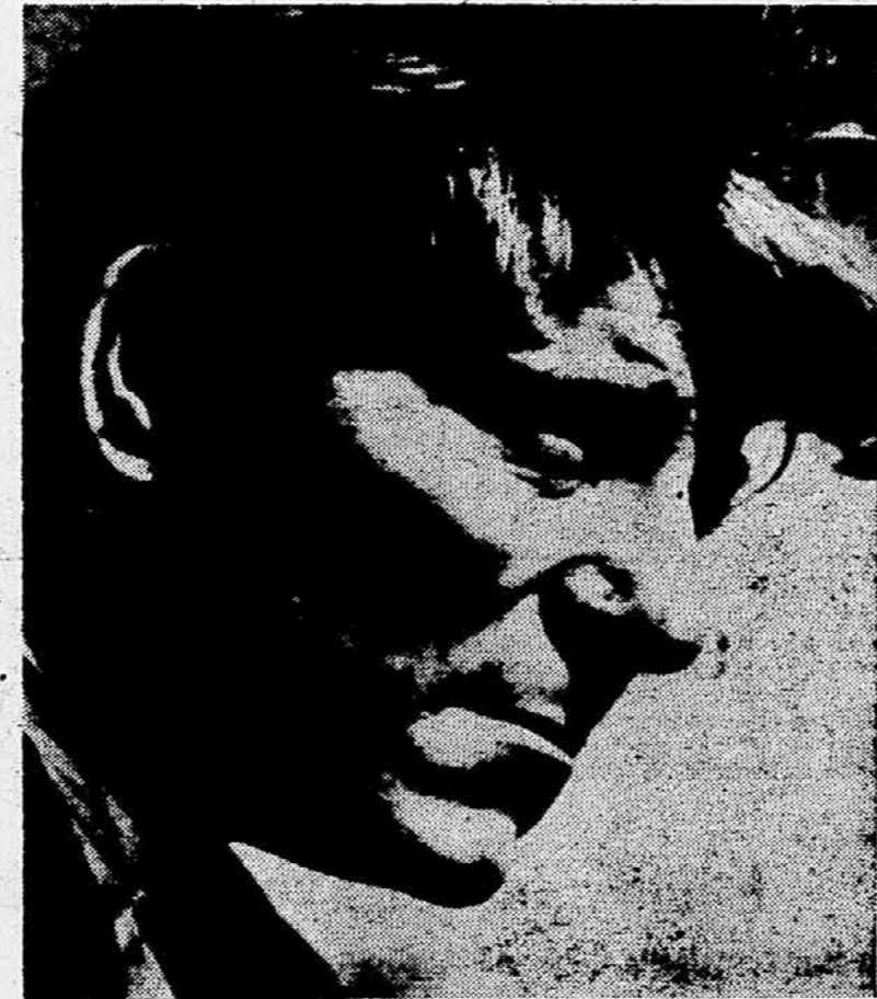
Jean Gabin je eden od najboljših priljubljenih francoskih filmskih igralcev. Dolga je vrsta njegovih odličnih vlog, ki jih je izoblikoval od svojega prvega filma »Obsorje«.

Okupacijski statut je prepovedal obnove velikega filmskega trasta UFA, ki se je za časa nacizma popolnoma predal službi nacistične propagande (med drugimi je v atelijah te družbe režiral tudi Veit Harlan »Zida Süssa« in podobne kriminalne izbruhe nacistične nestrpnosti, kar pa zahodnonemških filmskih krogov ne moti, da bi istemu Veitu Harlanu ne dal zopet priložnosti za delo). Zato je v povojni Nemčiji zrasko na Zahodu brez števila večjih in manjših filmskih produkcij, na Vzhodu pa so s sovjetskimi dovoljenjem ustanovili državno produkcijo