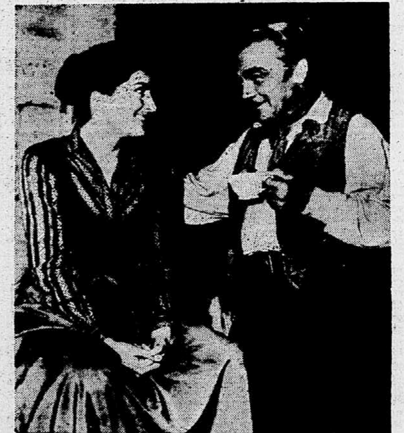
V kinemaskopskem filmu »Tribute to a Bad Man« sta nastopila v ZDA zelo priljubljeni James Cagney in odlična grška igralka Irene Papan, ki ju vidimo na naši sliki.

DICK POWELL, ki v Ameriki ni manj samo kot producent, temveč tudi kot režiser, je prišel v Evropo, da tu našle igralce za svoj novi film »Get Away«. Znano je, da je Anna Magnani že sprejela režiserjevo ponudbo.