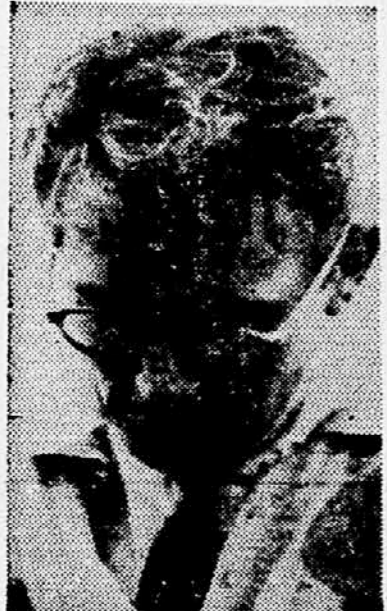
Dva obraza Gregoryja Pecka: enega, najbrž samo na zunanji vseloga in praznega pokaže svojim študentskim oboževalcem, pred katerimi se mora v javnosti pogosto-krat zavarovati policija, na drugi sliki pa je Gregory pesnet čisto »privatno«, v urah, ko se predaja svojemu »konjčku« — Golfu.

Benetški festival leta 1952 je je Kenji Mizoguchija uvrstil med najpomembnejše filmske režiserje na svetu. Za film »Življenje O'Haru« je namreč dobil srebrnega leva. S tem letom se tudi začela »pojavi« takorekto na vseh filmskih festivalih. Leto pozneje je v Benetkah znova dobil srebrnega leva in naslednje leto tretjič s filmom »Intendant Sansho«. V Cannesu je lani nastopil z zanimivim filmom »Križana ljubezna«, mečem ko je za Benetke pripravil filma »Cesarica Yang Kwei Fei«. In letos so Benetke počastile spomin tega nezdrnega filmskega ustvarjalca, ko je preko platna drela njegova zadnja freska iz sodobnega japonskega življenja z naslovom »Uti-ca svatstva«.