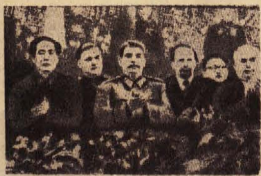
Proslave sedemdesetletnice Stalina, 21. decembra lani v moskovskem Velikem gledališču, so se poleg Mao-Ce-Tunga (ki je bil prav tedaj na čelu delegacije LR Kitajske v Moskvi) udeležili vodilni predstavniki vseh držav vzhodnega bloka in informbirojevskih partij. Zanimivo je, da so mesto ob Stalinovi levici (na njegovi desni je bil Mao-Ce-Tung) dodelili Walterju Ulbrichtu, medtem ko so se predstavniki ostalih informbirojevskih partij morali zadovoljiti s veliko skromnejšimi mesti.

Dopolnil pa ga je Molotov, ko je na predvolilnem zborovanju 1. marca t. l. v Moskvi v besedah — »kolikor hitreje bo nemški narod spoznal resničen zgodovinski pomen ustanovitve Demokratske republike Nemčije, toliko hitreje bo dosegel svojo nacionalno enotnost« — še podčrtal.