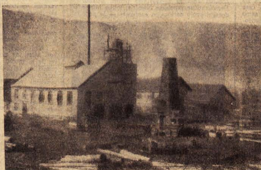
Pogled na del novozgrajene žage v Kočevju

Idrijski rudarji pa so se tudi ob- vezali, da bodo petletni plan izpolnili do 27. aprila — v počastitev desetlet- nice OF. Njihova dosedanja borbenost in uspehi kažejo, da bodo držali be- sedo.