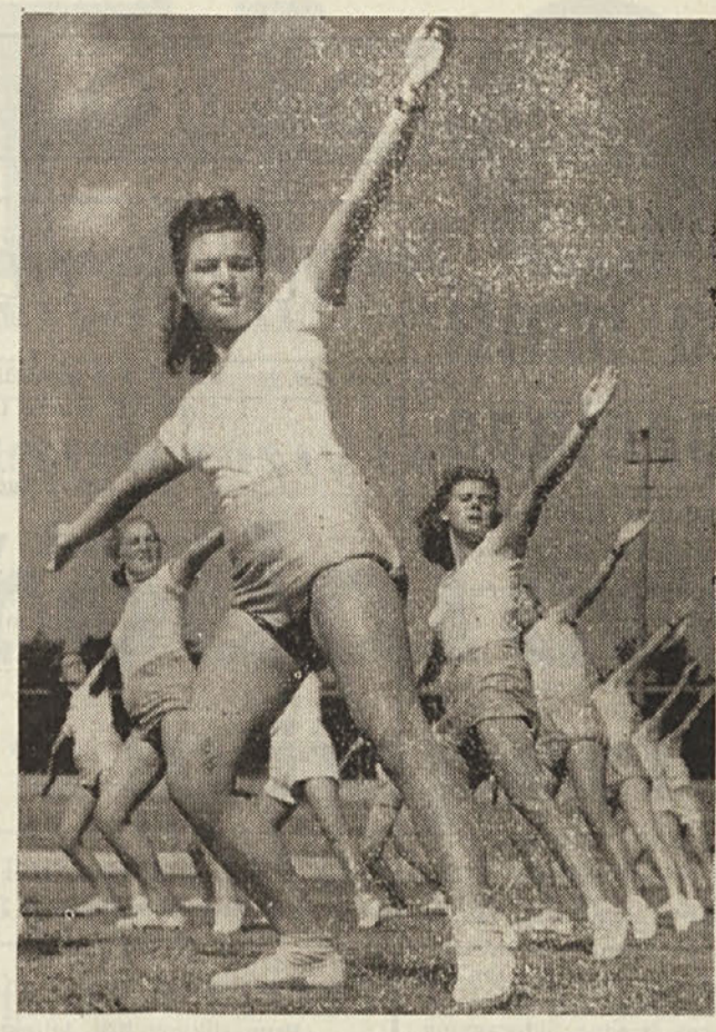
Pr pripravljamo se za prvomajski telovadni nastop!