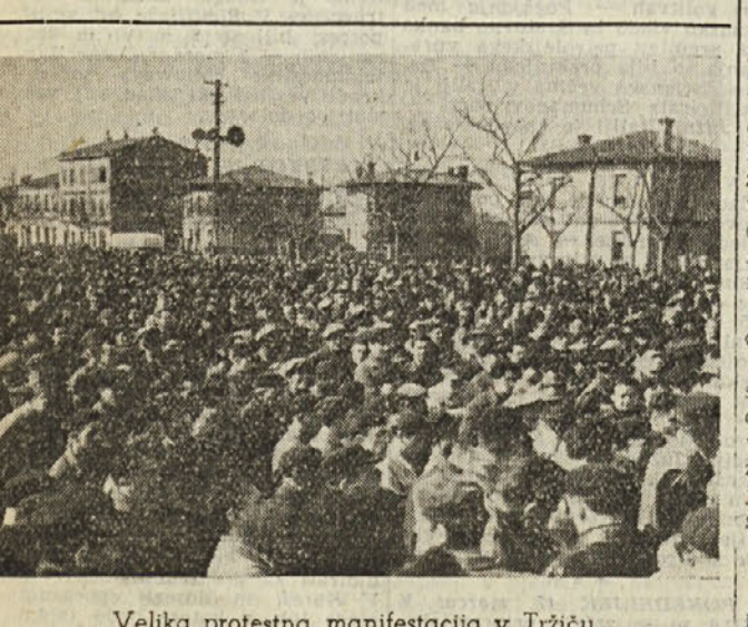
Velika protestna manifestacija v Tržiču.

V bližnji preteklosti je bilo na tisoče delavcev zaposlenih pri izsuševanju delih Skadrskega jezera na jugoslovanskoalbanski meji.