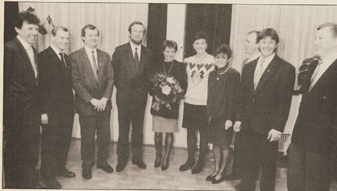
Sestre in bratje Olip iz Sel so pozdravili predsednika slovenske vlade s pesmijo.