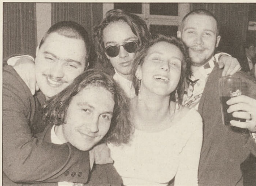
Tudi bivši maturantje vsako leto radi pridejo na gimnazijski ples.

Ker letos Slovenskega plesa ni bilo, se je pretekli petek v Celovcu odvijal Gimnazijski ples kot edini veliki osrednji slovenski ples v Celovcu. Maturantke in maturanti Slovenske gimnazije so povabili Big-Band RTV Ljubljana s pevcem Otom Pestnerjem ter ansambel Gorenjci. Obe zasedbi sta odlično zabavali publiko; temu primeren pa je bil tudi honorar, ki je znašal menda kar 80.000 šilingov.