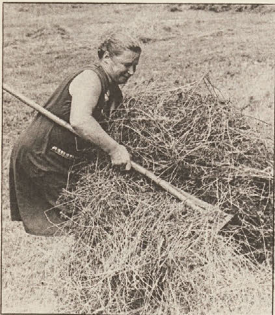
Tudi kmeticam pripada pokojnina. SJK je vložila tozadevni predlog, ki ga bo zdaj obravnavala Zbornica.