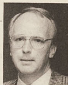
Piše Tomaž Ogris

Slovenci smo vedno malo drugačni. Za hitre odločitve v svoji neučakanosti znamo postaviti na glavo tudi demokracijo. V imenu ljudstva, pravijo nekateri. Če le še seže z dneva v dan šibkejši ljudski glas do visokih narodnih vrhov? Potrpežljivosti in poslušnosti za zatišano misel naj bi spet našli, pa ne bo treba posiljevati ljudi, da bi razkazovali enotnost, ki je ni.