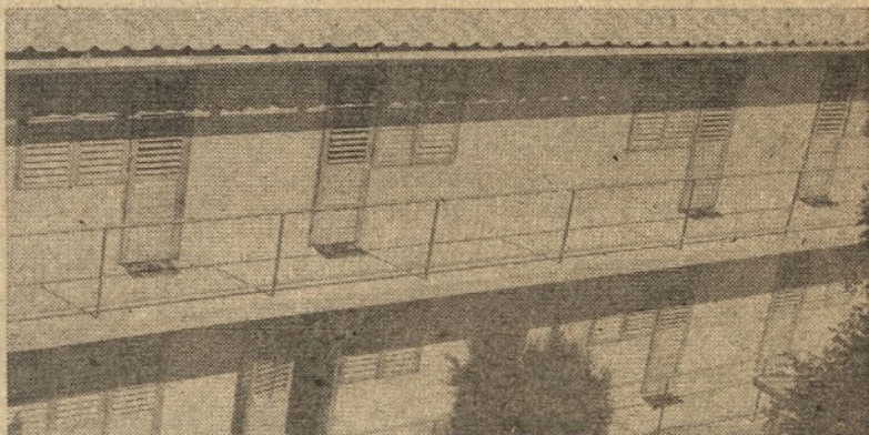
Pogled na del objekta počitniškega doma v Portorožu