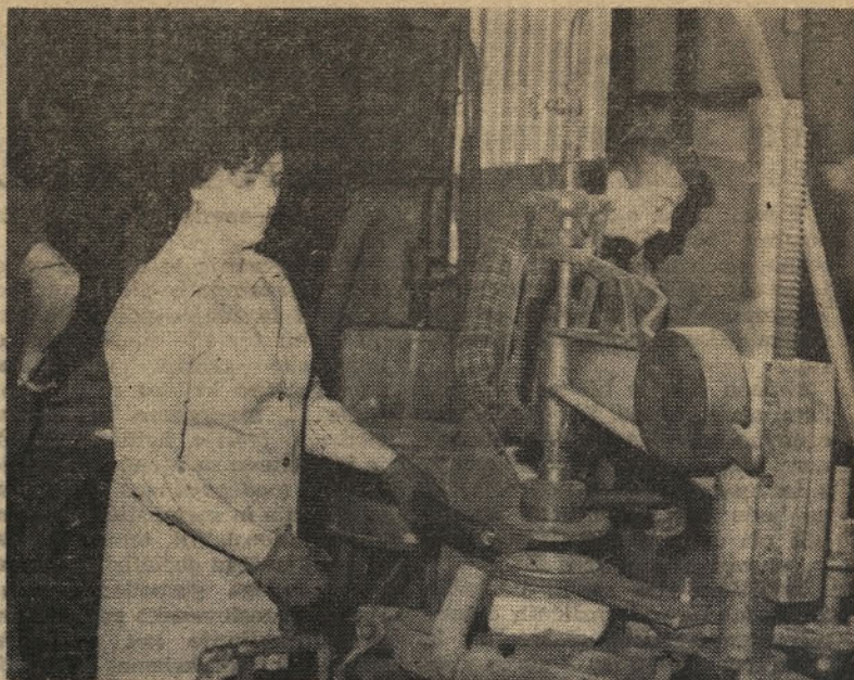
IOK OOS DO je razpravljal tudi o nočnem delu žena v letu 1981. Delavke opravljajo nočno delo še na delih in nalogah: izpihalke, natikalke stekla, menjalke klešč, rezalke na Dania stroju, čistilke v obratu, kontrolorja stekla in čistilke sanitarnih prostorov.

Za obisk se priporoča Delovna organizacija KRC »14. oktober« Hrastnik.