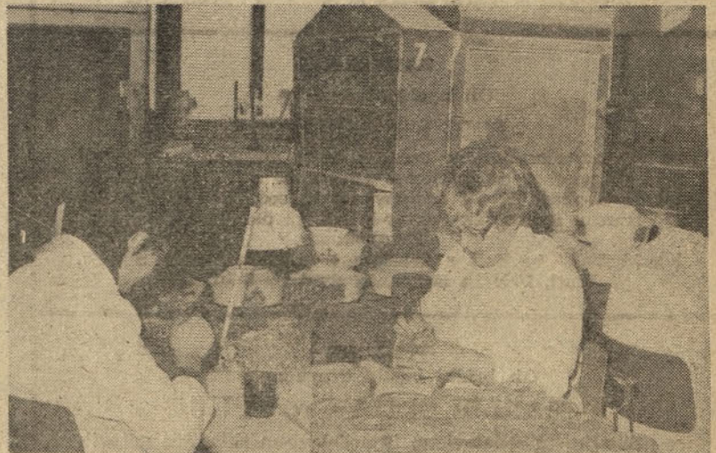
Prva faza aktivnosti priprave na usmerjeno izobraževanje v naši DO je obsegala izdelavo osnovnih izobraževalnih programov, za posamezne profile steklarskih poklicev, med drugim tudi stekloslikarja.