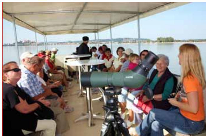
Vožnja z ladjico po reki Dravi je prijetno doživetje.

26. septembra je v Hotelu Mitra potekal 2. turistični forum mesta Ptuj, katerega cilj je med drugim vsakoletno redno srečanje s posvetom turističnih in s turizmom povezanih ponudnikov, obeležitev svetovnega dneva turizma, opozoriti na pomen turizma za