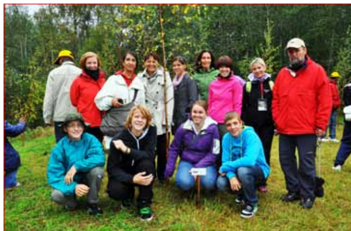
Naši predstavniki na konferenci projekta ENO (Environment Online) na Finskem

že veliko dosegli. Predsednik je izpostavil, da so maturirali v zelo zahtevnem trenutku, ko je v svetu čedalje več konkurence in neposrednih komunikacij, ki omogočajo primerjave, zato je tudi težnja po odličnosti vedno bolj neposredna in hkrati zahtevnejša. Na srce jim je položil, da