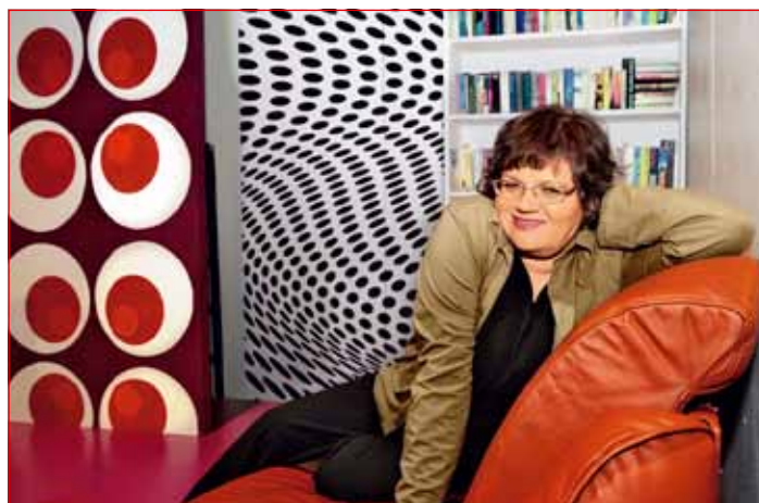
V okviru projekta bo šola obiskala tudi Desa Muck.

na področju branja, predvsem z razumevanjem pisnega besedila, kar se pogosto rezultira v nižjih učnih rezultatih pri pisnih nalogah, težavah pri učenju iz različnih pisnih gradiv, učenci nimajo dovolj razvite sposobnosti za fleksibilno uporabo različnih tehnik branja glede na vrsto besedila in cilj branja. Srečujemo se tudi s pojavom splošne nemotiviranosti za branje . Njihove bralne navade spremljajo dekoncentri-