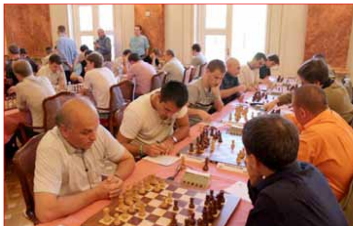
Ptujski šahisti (levo) v Rogaški Slatini

izredno naporno in je zato uspeh še toliko večji.