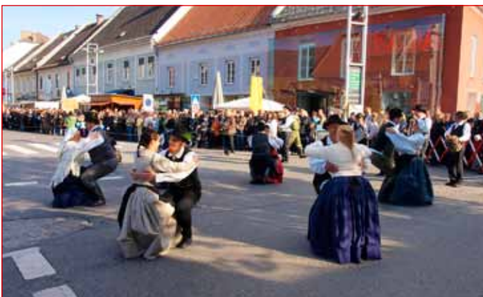
Člani Kulturnega društva Rogoznica med nastopom

ki je letos maja praznovala peto obletnico delovanja. Prireditve, ki je postregla tudi s številnimi kulinaričnimi dobrotami, se je udeležilo več tisoč obiskovalcev, med njimi okrog dvajset članov Turističnega društva Ptuj. Festival predstavlja vrhunec jesenskih festivalov južne Štajerske.