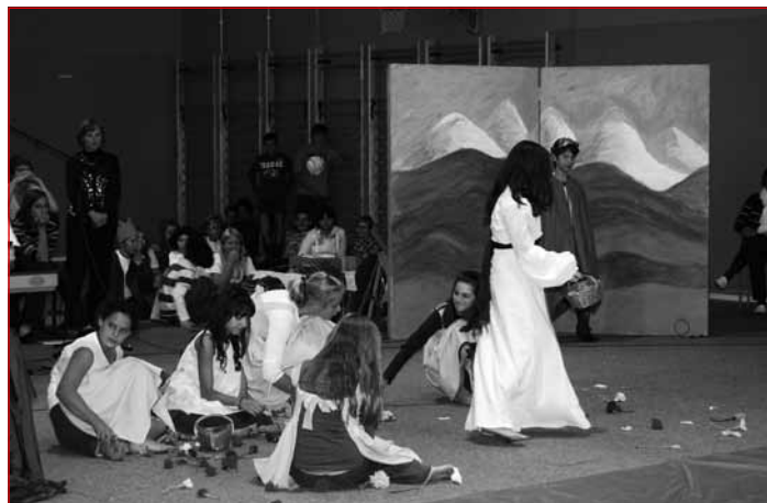
Ptujski osnovnošolci so madžarskim vrstnikom zaigrali predstavo Kako je Evropa dobila ime .