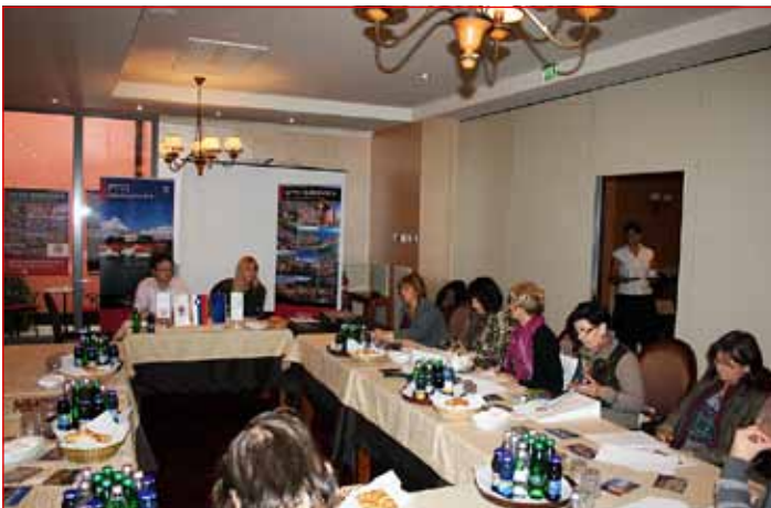
Novinarska konferenca Združenja zgodovinskih mest Slovenije

Združenje zgodovinskih mest Slovenije se je prijavilo na javni razpis s ciljem, da pomaga pri spodbujanju razvoja turizma v starih zgodovinskih mestih, ohranjanju in povezovanju naravnih in kulturnih potencialov mest za razvoj turizma ter dvigo konkurenčnosti turističnega gospodarstva.