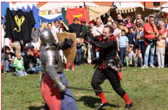
Tudi Ptujске grajske igre pritegnejo vsako leto več turistov.

Ta dan je na Ptuju potekala tudi tradicionalna mestna trgatev, najprej na grajskem dvorišču trgatev modre kavčine – žametne črnine, potomke najstarejše trte na svetu, in ranfola, nato pa še trgatev renskega rizlinga v mestnem vinogradu in vinogradu Nadžupnije sv. Jurija.