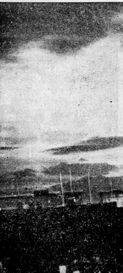
V noči od 5. do 6. februarja t. l. so v preizkusni pokloni sprožili atomsko bombo. 125 km od mesta eksplozije nad Salt Lake Cityem je bila svetloba tako močna, da so fotografi lahko slikali kot podnevi