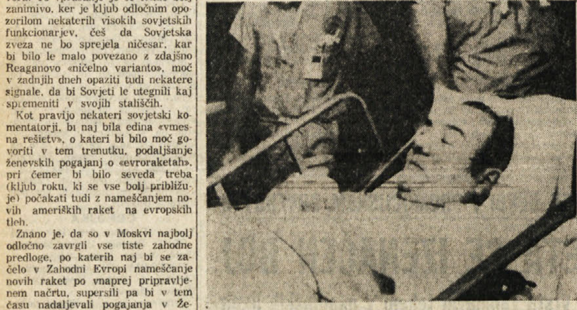
Barney Clark pred operacijo 1. decembra lanskega leta

Polemike o pionirskem posegu na področju kirurgije srca - Kje je meja med življenjem in smrtjo?