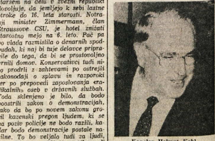
Kanceler Helmut Kohl

(Dopisnik Dela za Primorski dnevnik) BONN — Pogajanja med predstavniki vladne koalicije CDU, CSU in FDP v Bonnu so zdaj končana, toda dokaj zgodnji vprašanji ni bilo do konca rešenih. Kanceler Kohl in njegov zunanji minister, liberalni voditelj Genscher lahko veljata kot zmagovalca v boju proti voditelju bavarške CSU Straussu. Četudi je CSU sestrška stranka CDU, je vendarle usakumar jasno, da je kanceler Kohl uporabljal Genschereve liberalne loke in hrušni izjavam, ki jih je dajal Franz Josef Strauss o zunanje-političnih vprašanjih med pogajanjimi o tem, da bo treba zaostri odnos do Vzhoda, voditi bolj prijazno politiko do Južnoafriške unije, spreminiti politiko do Bližnjega vzhoda, podpirati predvsem Zahodu naklonjene države v tretjem svetu, sta Kohl in Genscher uveljavila tako imenovano «kontinuiteto» v zunanji politiki. To besedo je zunanji minister in vicekan-