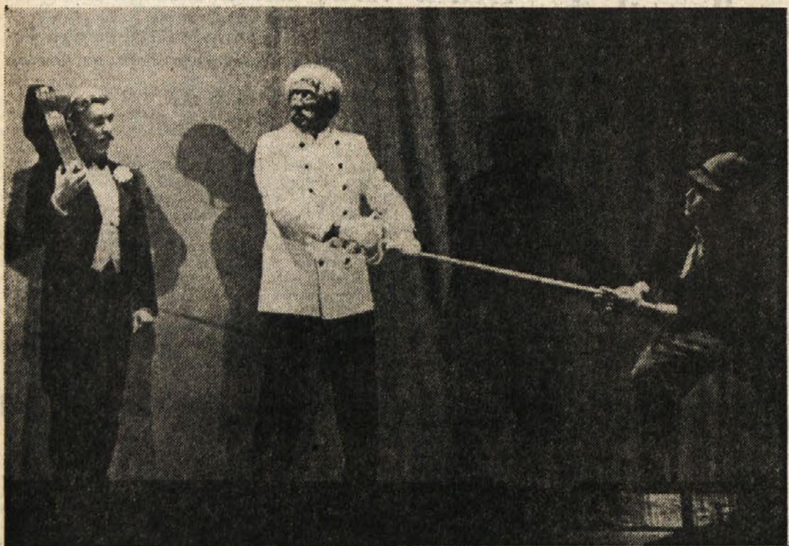
Danes in jutri ob 20.30 ter v nedeljo ob 16. uri bo ljubljanska Drama prikazala tržaškemu občinstvu zelo znano Goldonijev komedijo «Sluga dveh gospodov», ki je doživela najprej v Ljubljani, pa tudi v Gorici izredno lep sprejem pri občinstvu in pri kritiki. Sicer pa je to eno zelo posebnih del slovitnega beneškega avtorja, vrhu tega je tudi sedanja odrska postavitev odlična.