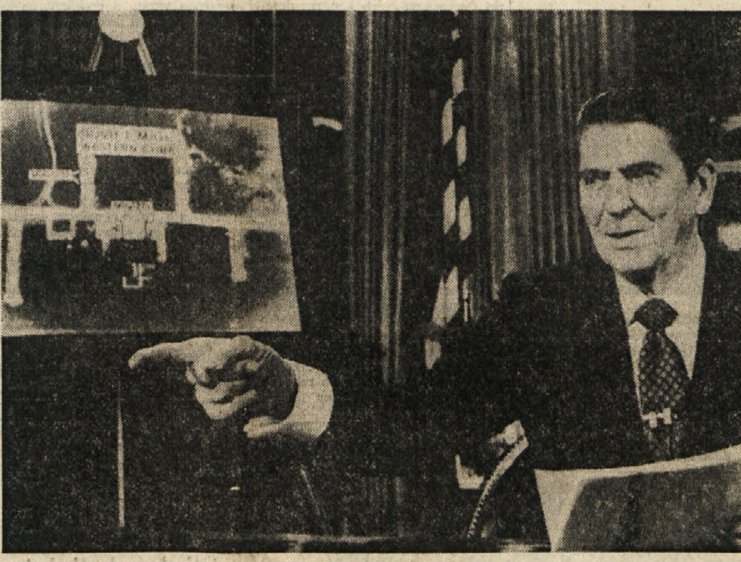
Predsednik ZDA Ronald Reagan je s posnetki skušal dokazati sovjetsko prisotnost v Srednji Ameriki

Medtem krožijo v Moskvi nepreverjene vesti, da je generalni partijski sekretar Andropov zbolel za vnetjem ledvic, kar bi ga lahko prisililo k daljšemu zdravljenju in počitku.