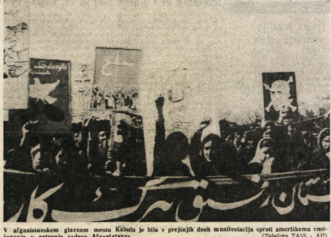
V afganistanskem glavnem mestu Kabulu je bila v prejšnjih dneh manifestacija «proti ameriški vojski»