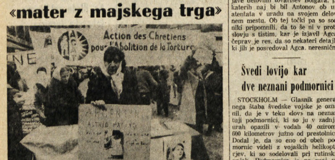
Pred argentinskim veleposlanstvom v Parizu je bila večer manifestacija «mater z majskega trga» proti zločinom argentinske vojaške hunte