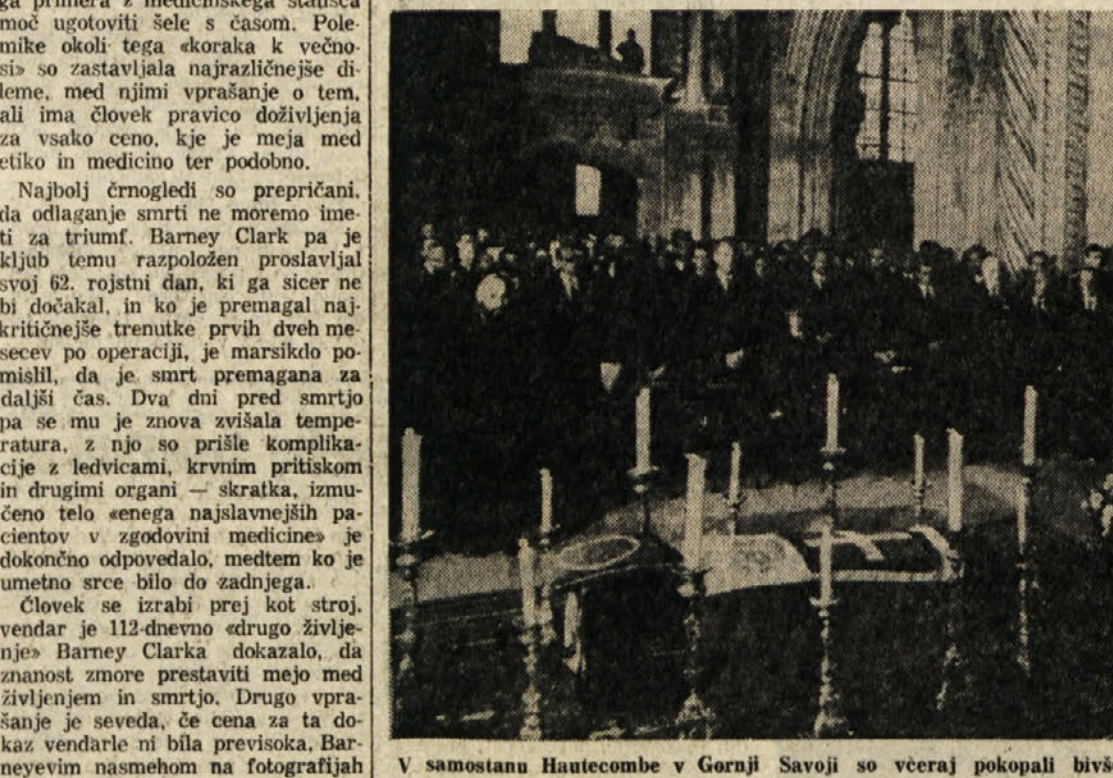
V samostanu Hautecombe v Gornji Savoji so večer pokopali bivšega italijanskega kralja Umberta II.