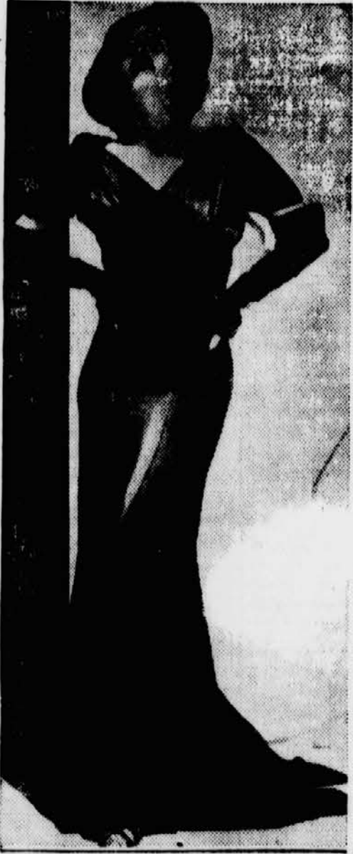
Joan Crawford, der große amerikanische Star, in einem Kostüm letzter Mode.