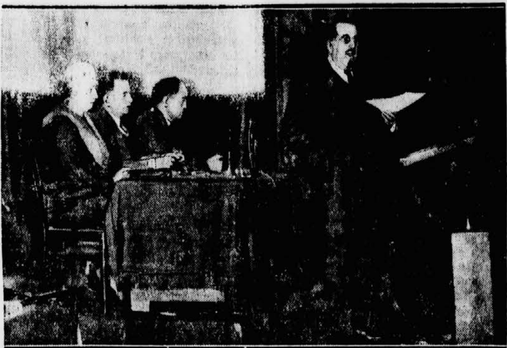
Der Präsident M. Leon J o u h a u x bei seiner großen Rede.