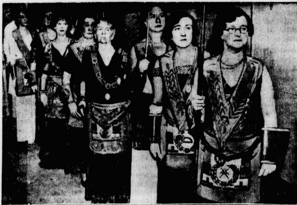
Großmeister und Offiziere bei den Einweihungszeremonien