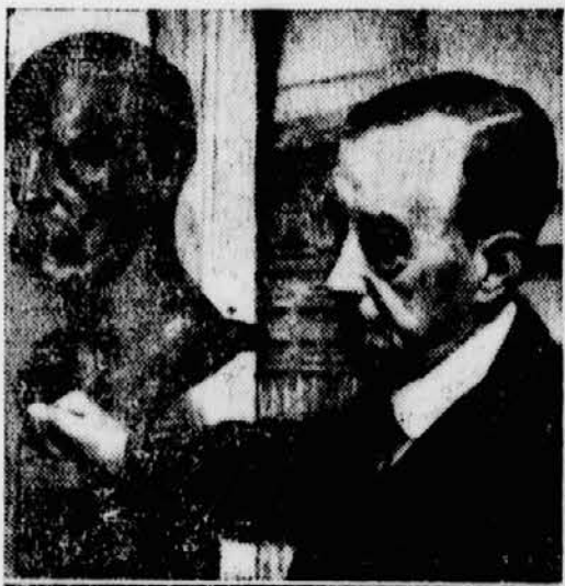
Die verfeinerte Art des Selbstverteidigungsportes Jiu-Jitsu.