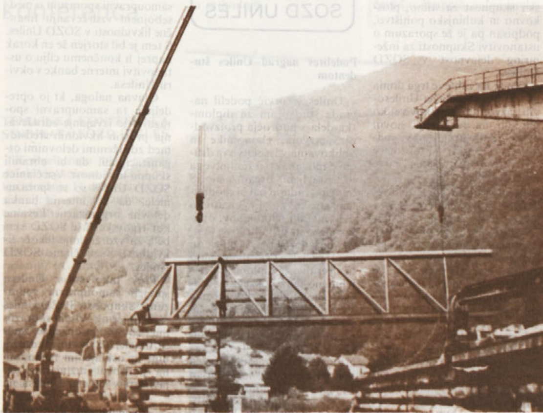
Postavitev „južnega“ dela novega žerjava na odre

Že velikokrat smo v poročilu navedli, da v naši DO zane-