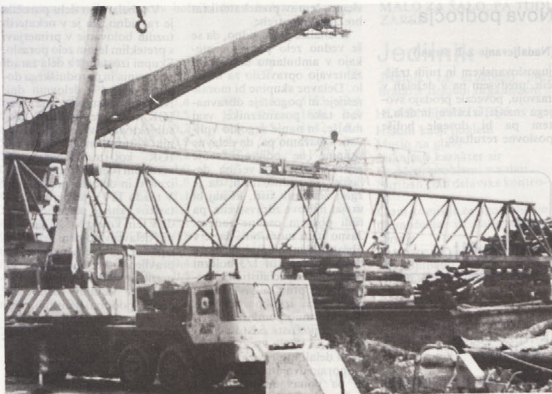
Razsežnost težko pričakanega žerjava je že vidna

Opazna je težnja po vse večjem deležu finalne proizvodnje, namenjene izvozu, v strukturi celotnega izvoza. Pri analiziranju je bilo ugotovljeno, da enaintrideset temeljnih organizacij združenega dela finalne proizvodnje v okviru