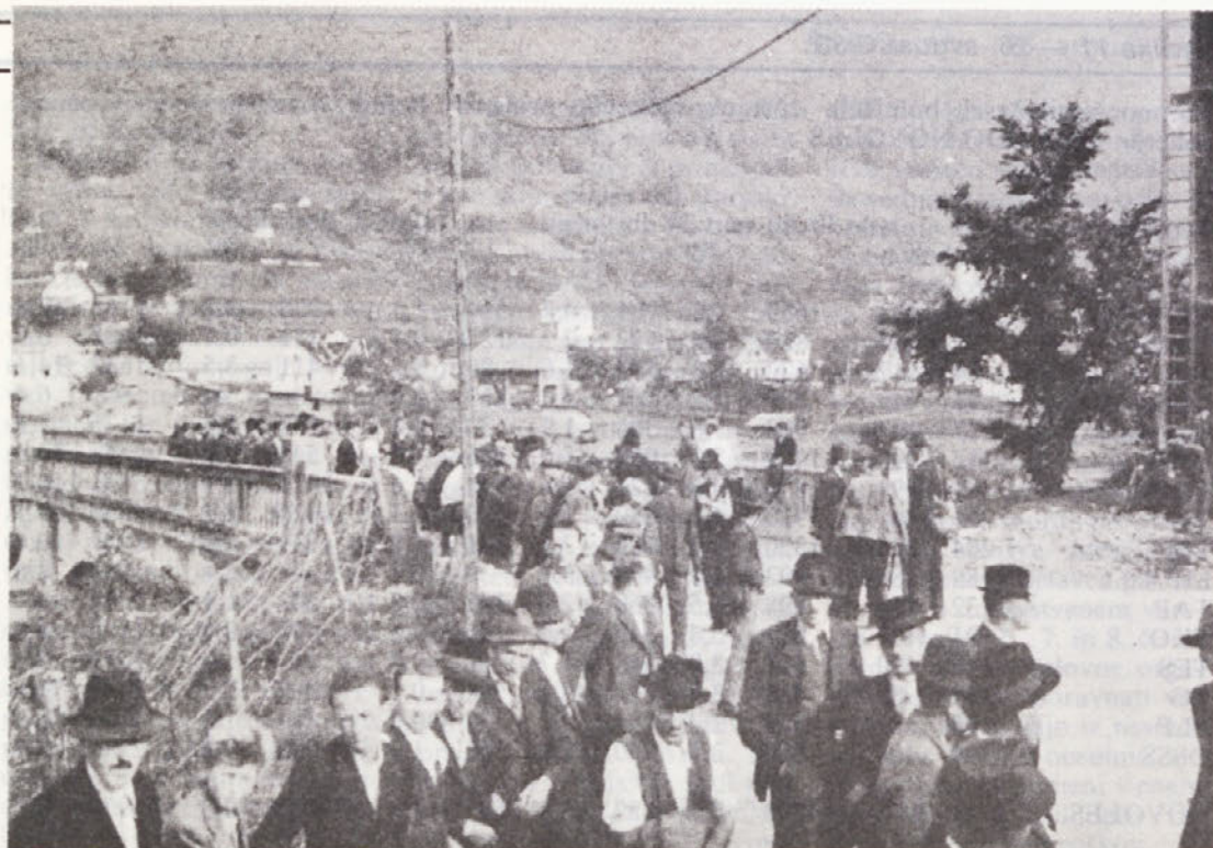
Mobilizacija po kapitulaciji Italije — skupina mobilizirancev iz Vavte vasi in Straže v septembru 1943