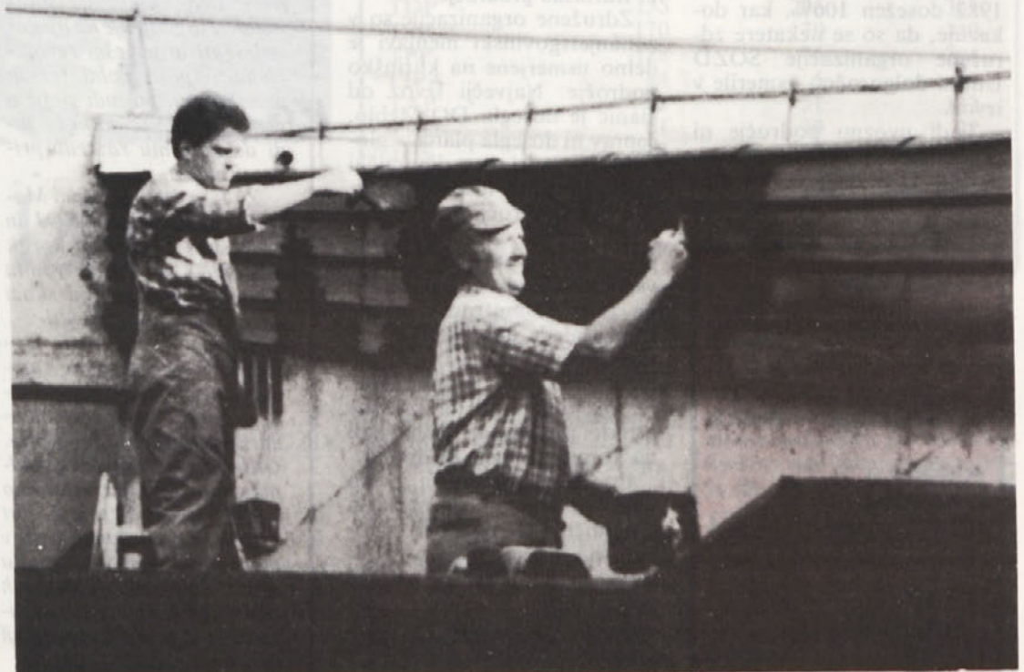
Delavca tozda TES obnavljata zaščito lesa na obratu družbene prehrane v Straži

— delu sorazmerno majhne, vendar visoko strokovne delovne skupnosti skupnih služb, ki je tudi poceni (v letu