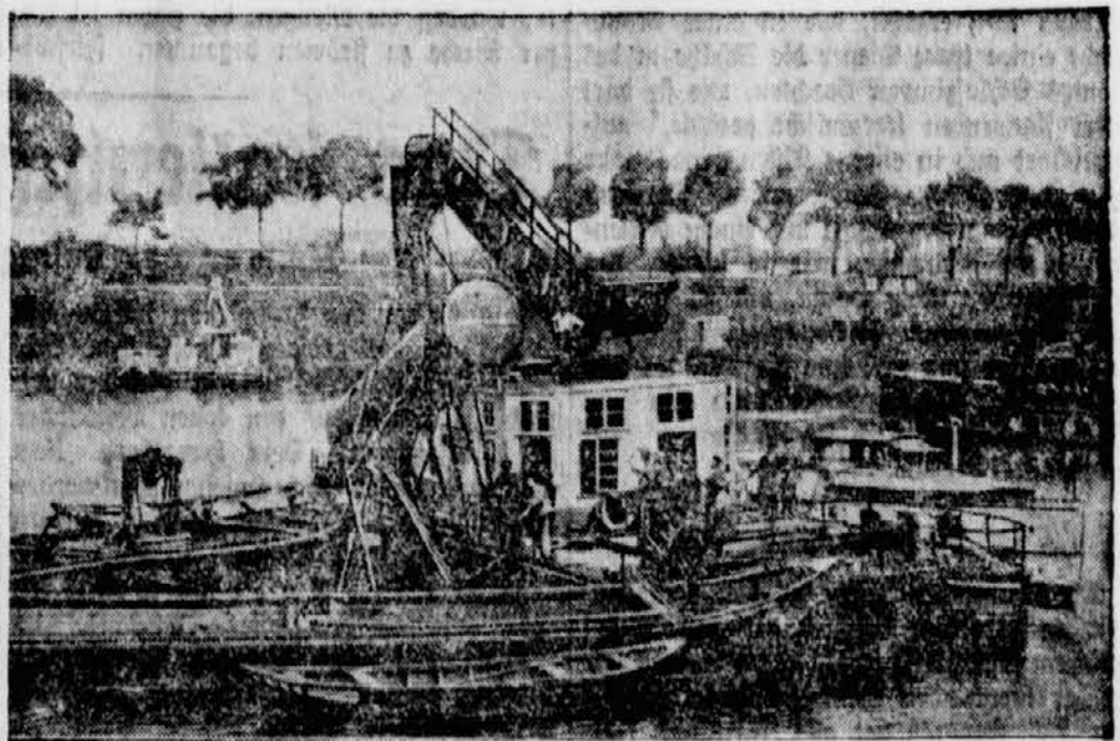
Mit Hilfe von Kränen werden die Pontons, die die Todesbrücke getragen haben, gehoben.