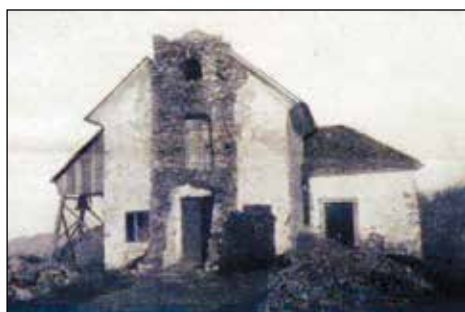
Zvonik po vetru, ko so ga zaradi varnosti celo podri do strehe.

Tako je neznani risar narisal vas Prtovč s cerkvico. Na osnovi te podobe je bila izrisana konstrukcija novega zvonika. Kar precejšnja je razlika med risbo in zvonikom ob izgradnji.