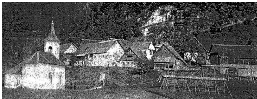
Prvotni izgled zvonika cerkve do prihoda rušilnega vetra.