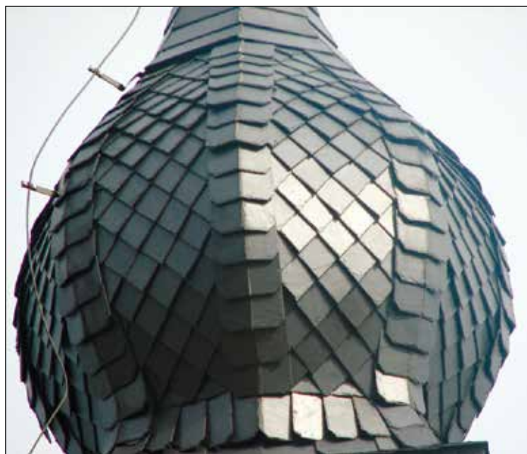
Natančno izklesane skrilne plošče na "bunki".

Ko so domačini na konstrukcijo začeli nabijati lesene deske, sem si oddahnil. Vedel sem, da bom lahko vsaj glavnino skrila položil med kolektivnim dopustom. In kako kakovostno so domačini les nabili na ogrodje! Upoštevali so moja navodila, da naj bodo deske debele štiri centimetre, da se pri pribijanju skrilnih plošč prepričajo vibracije. Ker ni bilo nikjer nobenih špranj, nobenih nivojskih razlik, sem jim ob pohvali rekel, da bi se po tej površini lahko "podričal" po nagi riti. Končno sem pričel s polaganjem skrila. Vsak dan mi je eden od domačinov