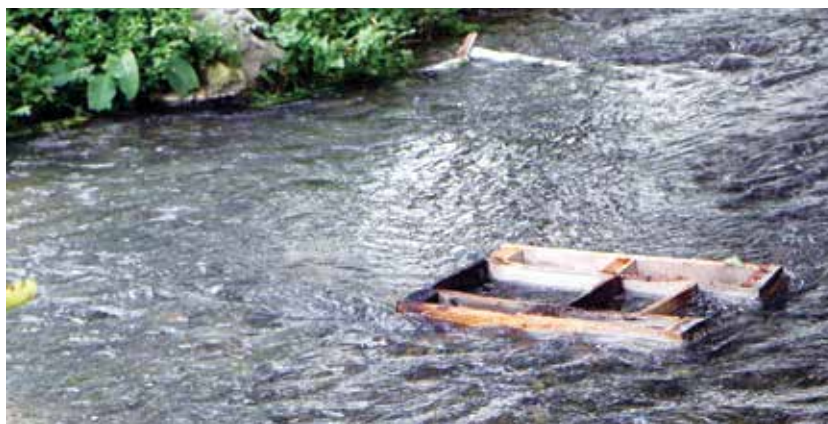
Nazadnje so v perišču požgali del opreme.

športnem parku, kjer se, milo rečeno, 'družijo' in uničujejo trud krajanov in članov društva.«