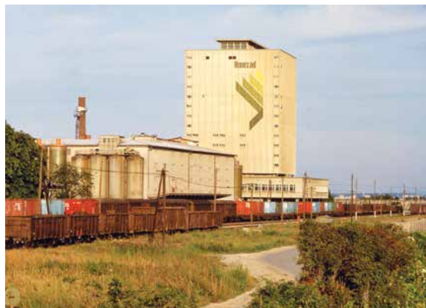
Stolpnica Hmezad je impozanten in najvišji objekt v Žalcu ter dolini (54 m) nasploh že vse od izgradnje leta 1964.

neka letih pokojnino, če so zemljo dali v dolgoročen najem. Nekateri so pristajali na zamenjave, ki niso bile vedno ugodne. Nekateri so se trdovratno upirali in se srečevali z raznimi pritiski. Arondacija je tako še dodatno vplivala na zmanjševanje števila hmeljarjev. Ekonomika je v naslednjih letih vplivala na opuščanje manjših in manj primernih hmeljišč.