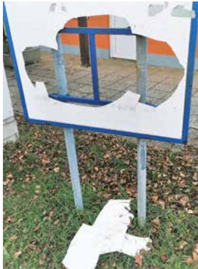
Razbita tabla v Športnem parku v Latkovi vasi

Spomnimo se porezanih novo zasajenih sadik na krožišču na Polzeli izpred nekaj let, pa uničevanja lesenih skulptur in zastupljanja labodov ob Ribniku Vrbje ... Zadnji primeri vandalizma so se zgodili letos poleti in jeseni v občini Prebold in Žalec in gotovo niso edini. V preboldskem gaju pri bazenu, kjer imajo svoje društvene in športne prostore upokojenci, motoristični klub Blisful in Jamarski klub Črni galeb, so se vandali znova znesli nad fasado objekta jamarskega kluba. Člani kluba so le nekaj dni pred tem naredili ograjo ob objektu, kjer je prihajalo do stalnega onesnaževanja in čekanja po fasadi, ki so jo že večkrat obnovili. Tokrat so vandali enostavno vdrl v ta zagrajen prostor in ga z rdečim sprejem vsega popisali z neprimernimi besedami, celo groznjami.