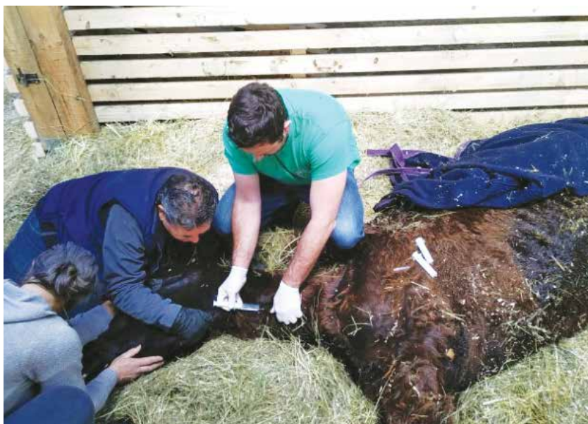
Kljub prizadevanjem prostovoljcev poginil.

Povedal je, da je konj last njegovega pokojnega očeta in da ne ve, kaj bi z njim. V društvu, v katerem načeloma ne sprejemajo lastniških živali, ker morajo lastniki sami ustrezno poskrbeti zanje, občasno naredijo izjemo in tudi tokrat so jo ter so konja sprejeli. Na žalost se je izkazalo, da je bilo njegovo stanje tako kritično, da so bila vsa njihova prizadevanja zaman. »Njegovo srce očitno