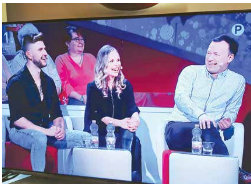
Polzelska zmagovalna ekipa

V zabavni oddaji z naslovom V petek zvečer na prvem programu nacionalne televizije sta 19. novembra za naziv »Najboljši kraj« tekmovali Občina Laško in Občina Polzela, katere trojica zastopnikov se je odlično odrezala.