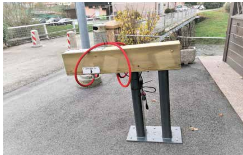
Polnilnica s stojalom za dve kolesi je še ena pridobitev DC Marof.

Direkcija RS za infrastrukturo je zaključila s težko pričakovano obnovo mostu in izgradnjo krožišča v Letušu. Prebivalci Letuša so s tem pridobili novo krožišče s temeljito obnovo in razširitvijo mostu. S projektom se je bistveno povečala prometna varnost proti POŠ Letuš. V sklopu projekta je Občina Braslovče izvedla preplastitev ceste proti POŠ Letuš.