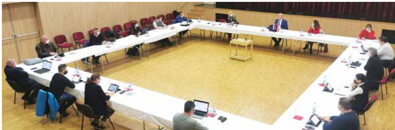
Braslovški svetniki so se zaradi ukrepov epidemije tudi tokrat dobili v dvorani kulturnega doma.

Gradnja se izvaja v sklopu projekta Oskrba s pitno vodo v Savinjski regiji – 1. sklop, ki ga na podlagi sporazuma o sodelovanju skupaj vodijo vse občine Spodnje Savinjske doline in predstavlja del podsklopa 2 Primarni vodovod Zaplanina–Ločica–Vransko.