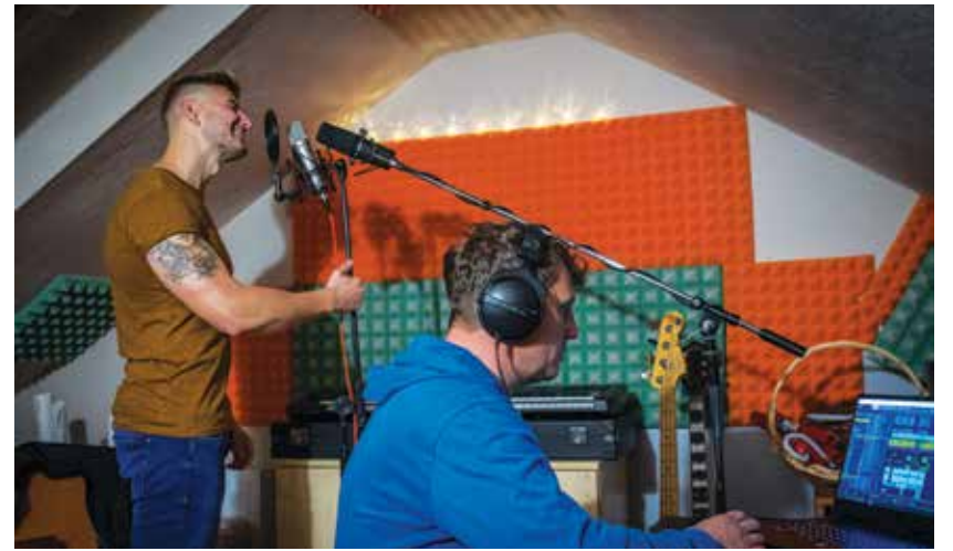
Kreativno vzdušje med snemanjem v studiu