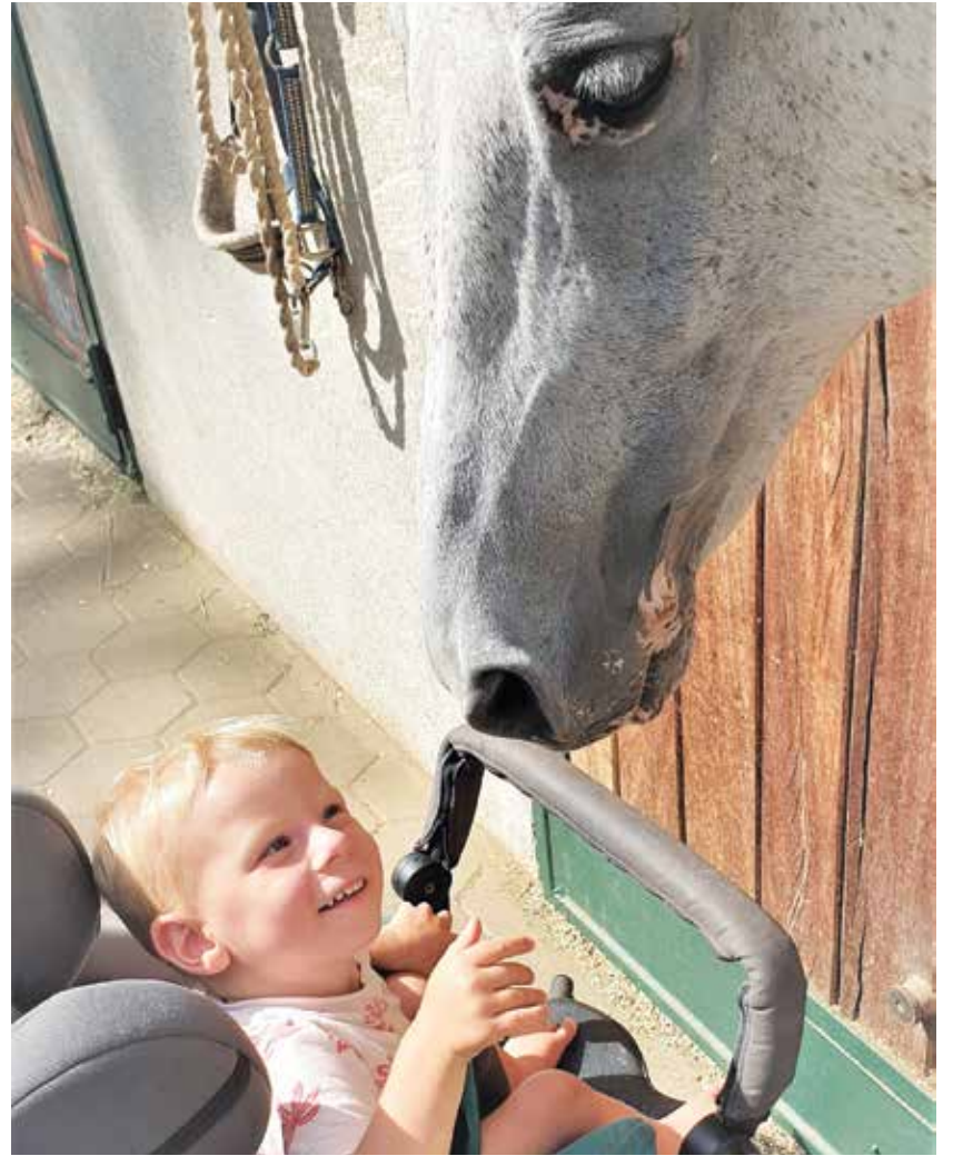
Da bo lahko hodil, potrebuje veliko terapij, posebna je tudi terapija s konji.

Poleg te genetske bolezni ima Bono še kup drugih zdravstvenih težav. Ima napako na srčku, ki ga k