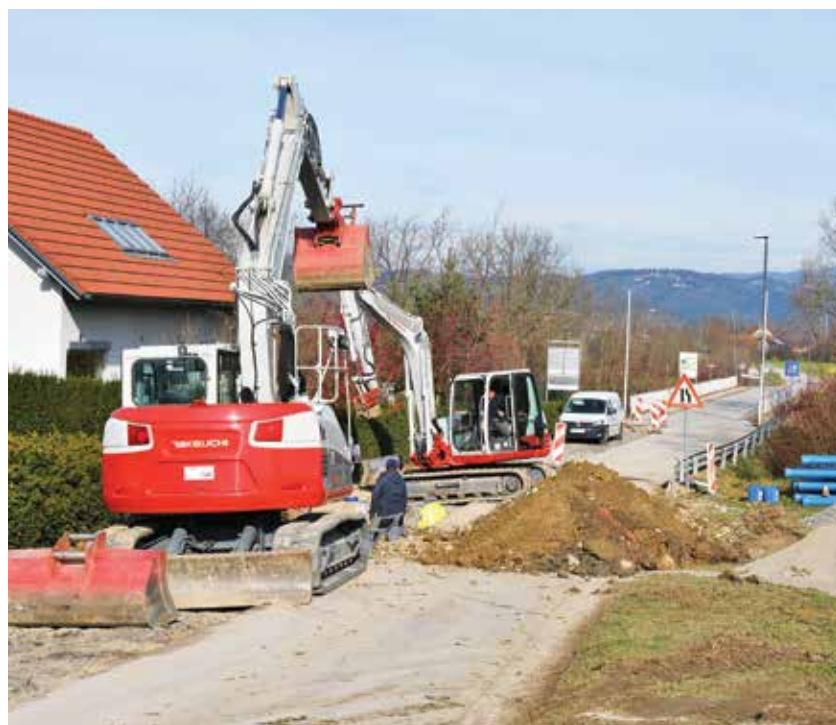
Dela na cesti pri mostu v Šeščah v teh dneh

V Občini Prebold je bilo v jesenskem času in deloma že prej izpeljanih več najrazličnejših del na infrastrukturnem področju, nekaj pa jih je še v teku.