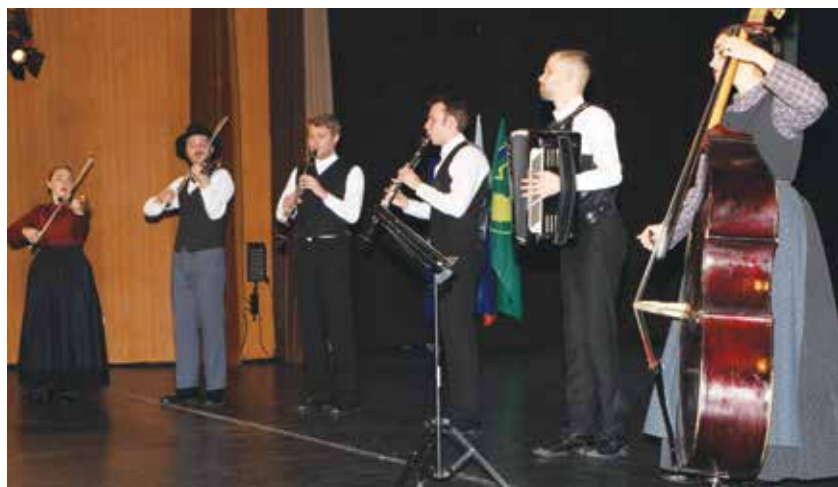
Maroltovski godci AFS France Marovt na žalskem odru med nastopom