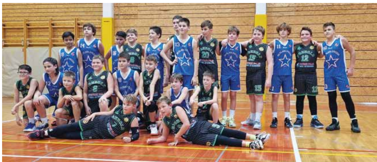
Po tekmi U13 med domačim KK Prebold 2014 in KK Plava zvezda

Košarkarski klub Prebold 2014 je v vikendu od 12. do 14. novembra organiziral VIII. mednarodni košarkarski turnir mladih. Po lanski odpovedi turnirja je letos veselje zlasti najmlajših selekcij, da lahko igrajo tekme, odtehtalo vse skrbi.