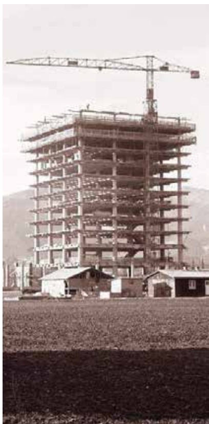
V šestdesetih letih, ko so gradili Hmezadovo stolpnico, je Žalec izgledal popolnoma drugače.

dejavnosti. Ko smo razmišljali, kaj je posebnost teh naših krajev, smo se med drugimi proizvodi odločili za proizvodnjo zgornjesavinjskega želodca in spodnjesavinjske salame, ki še sedaj veljata za zelo prepoznavna produkta tega podjetja. Naš vpliv pa je bil tudi na SIP Šempeter, kjer so začeli izdelovati tudi stroje za strojno obiranje hmelja in druge kmetijske stroje v povezavi z nami in Bavarci. Imeli pa smo tudi velik zelenjadarski obrat v Medlogu itd.,« se je v pogovoru za Utrip spominjal prvi predsednik Hmezada Zidar.