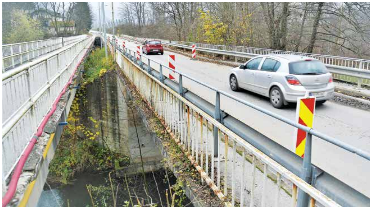
Na dotrajanem griškem mostu je že nekaj časa omejen promet.

Kot so ugotovili strokovnjaki, stoji sedanji glavni steber mostu nad prelomnico, zato bo treba most prestaviti za približno dva metra gorvodno. Gradnja bo potekala v dveh fazah. Najprej bo porušen star glavni most in zgrajen nov, v drugi fazi pa bo porušen še ožji, kolesarski most. Tako bo med gradnjo novega