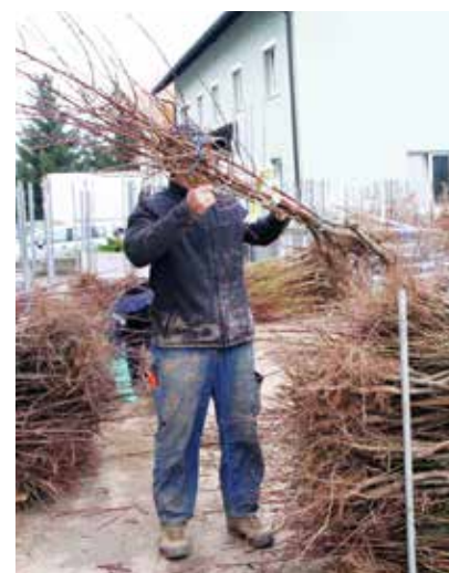
Priprava sadik za izvoz in domači trg

Druga največja dejavnost v Sadjarstvu Mirošan je pridelava sadnih sadik. »Že pred časom smo pričeli s prodajo vlončenih sadik, trenutno pa vršimo izkop sadik z golo korenino. Te se do sajenja skladiščijo v posebnih hladilnih celicah, kjer odlično zadržijo svežino in počakajo na ugodne razmere za sajenje. Letno pridelamo okoli 220 tisoč sadik, od katerih jih že več kot pol prodamo sadjarskim ljubiteljem, ostale pa profesionalnim pridelov-