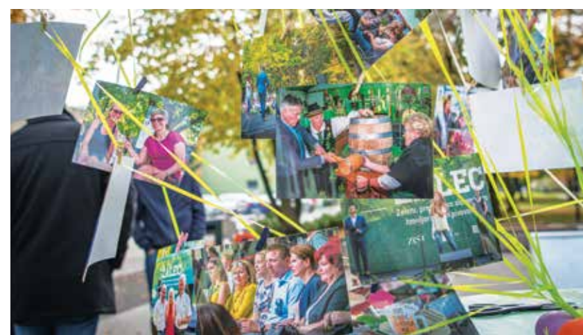
Fotografije z dogodkov minule sezone

Kar se tiče najditeljev kuponov iz balonov – srečneže še vedno pričakujejo, da se javijo. Če boste takšen kupon našli, ga lahko unovčite v trgovini Zeleno zlato na žalski tržnici.