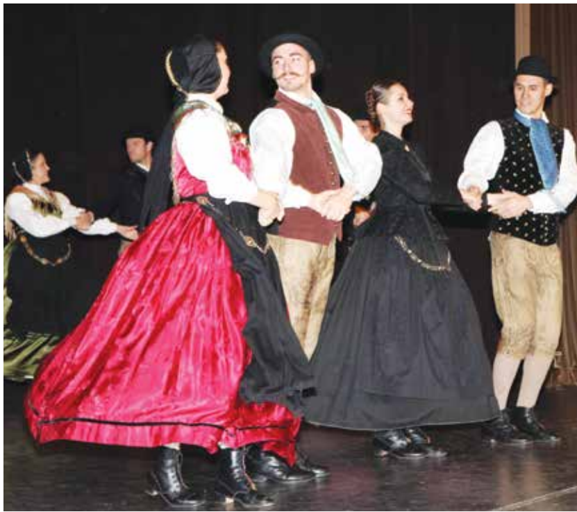
Nastop Folklorne skupine KD Sveta Ana iz Slovenskih Goric

Na razpisu izbrane folklorne skupine in glasbene programe je spremljala in ocenjevala strokovna žirija ter ob koncu prireditve razglasila najboljše skupine in nagrade žirije. Prireditev je bila prepletena tudi s poezijo. Razglašena je bila zmagovalna pesem natečaja Plešem pesem – pesmi na temo folklorne dejavnosti, podeljene pa so bile tudi