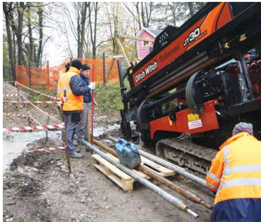
Pri podvrtanju reke Savinje

Občinski svetniki so v nadaljevanju razpravljali tudi o dodatnem znižanju plačila vrtca zaradi odsotnosti. Starši otrok, za katere je Občina Braslovče po veljavni zakonodaji dolžna kriti del cene programa predšolske vzgoje, lahko uveljavijo pravico do dodatnega znižanja plačila programa v času šolskih počitnic. Dodatno znižanje se prizna za odsotnost otroka najmanj deset dni in največ dva meseca v času od 20. junija do 31. avgusta. Plačilo se staršem zniža glede na število dni odsotnosti: za neprekinjeno odsotnost 10 delovnih dni (vključno do 14 delovnih dni) se plačilo zniža za 15 %, za neprekinjeno odsotnost 15 delovnih dni (vključno do 19 delovnih dni) se plačilo zniža za 30 %, za neprekinjeno celomesečno odsotnost se plačilo zniža za 50 %, za neprekinjeno dvomesečno odsotnost se plačilo zniža za 70 %. Po razpravi je Občinski svet Občine Braslovče sprejel Sklep o določitvi cen programov predšolske vzgoje v Osnovni šoli Braslovče – OE Vrtec Braslovče in o dodatnem znižanju plačila zaradi odsotnosti.