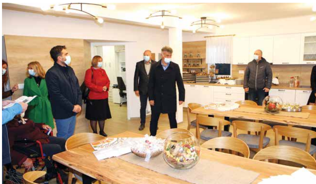
Med ogledom novih prostorov centra

in visoko kvaliteto življenja po svoji meri. Okrogle obletnice – 40 let delovanja – lani žal niso mogli praznovati, so pa vse, kar se je zgodilo v teh letih, strnili v bilten.