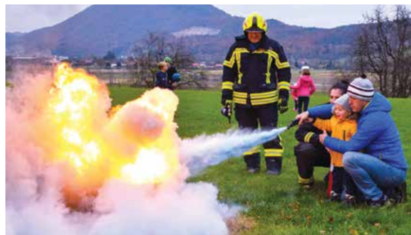
Pri gašenju požara so se preizkusile tudi mlade braslovške družine.

Za otroke so pripravili zanimive ustvarjalne delavnice, na katerih so lahko sami izdelali gasilca ali gasilsko čelado, poskusili rešiti naloge iz gasilstva in drugo. Poleg tega so obiskovalce popeljali skozi gasilski dom, jim predstavili delo društva ter pokazali opremo in vozila.