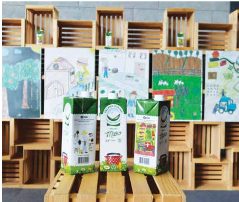
Novo podobo mleka Zelene Doline krasita zmagovalni risbici likovnega natečaja Zveze podeželske mladine Slovenije.

V letošnjem letu so v Mlekarni Celeia začeli prenavljati podobo izdelkov Zelene Doline in to jesen predstavljajo linijo mleka v osveženi podobi z zelenim travnikom. Prenovili so podobo vseh petih polnitev mleka, in sicer: sveže nehomogeni-