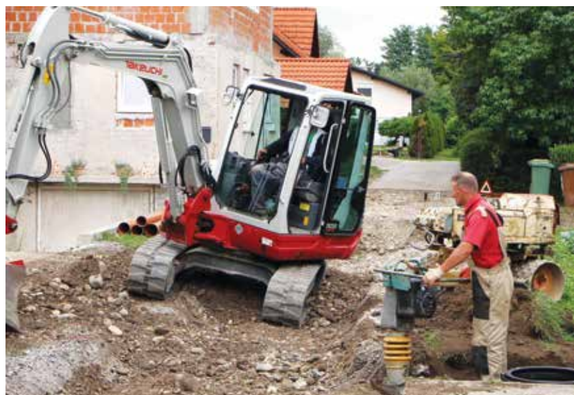
Pri gradnji kanalizacije v Parižljah

V Občini Braslovče se je ali pa se bo do konca leta zaključilo kar nekaj projektov v skupni vrednosti skoraj milijon evrov.