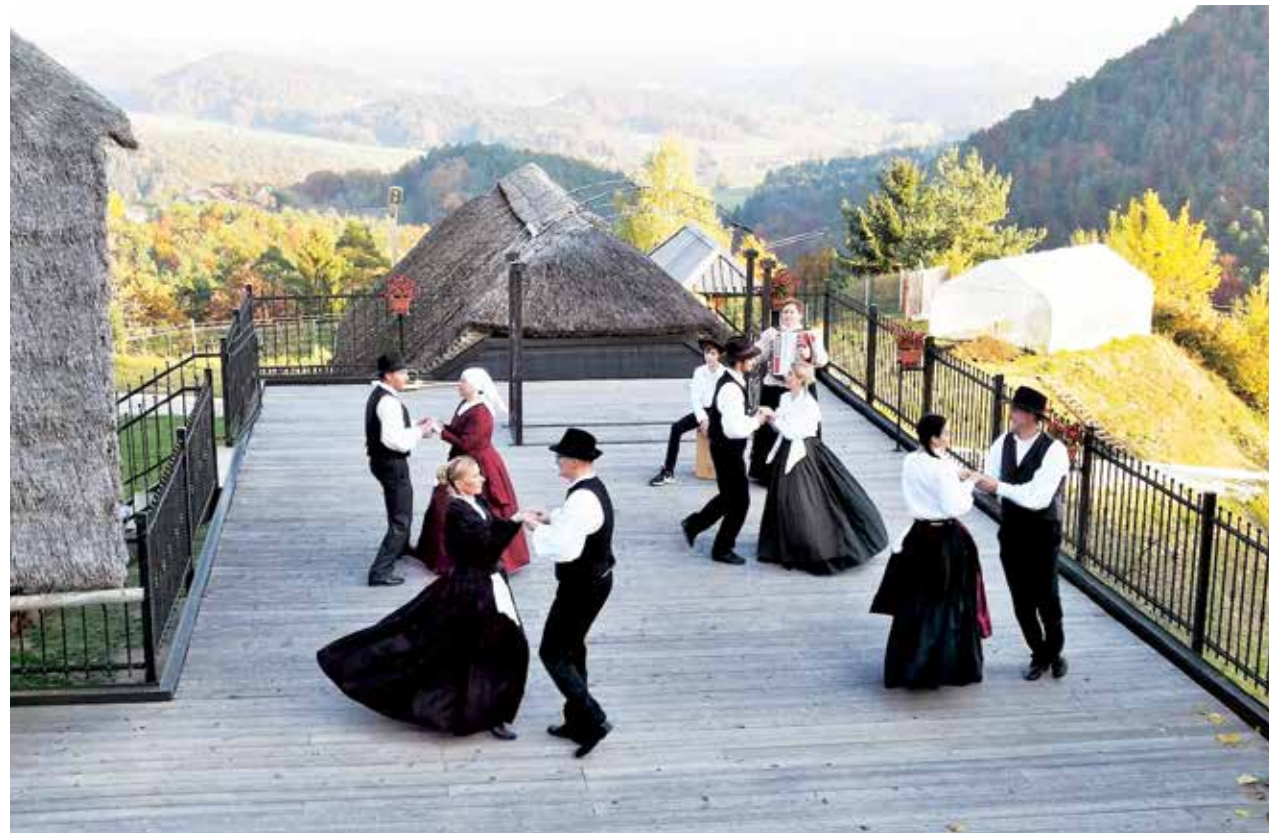
Člani FS Galicija med plesom na terasi s čudovitim pogledom v dolino

Vino je pijača, ki je del slovenske kulture, dediščina, ki nas spremlja skozi stoletja, in tisto, čemur smo namenili tri praznike, najpomembnejši pa je martinovo. In če ga letos v živo ni, na spletu se dobi, so sklenili v Folklorni skupini Galicija.