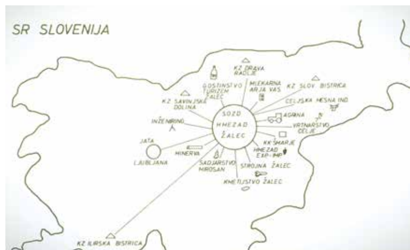
Skica SOZD-Hmezad z vpisanimi zadrugami in podjetji, ki so tvorila ta veliki poslovni sistem.

izmu. Ob tem pa je treba reči, da je imela tudi pri nastanku kombinata pomembno vlogo politika,« poudaril predsednik Hmezadovih upokojencev in doda: »Z zadovoljstvom pa upokojenci Hmezada spremljamo razvoj in uspešno poslovanje podjetij, ki so izšla iz Hmezada, ki napredujejo kljub