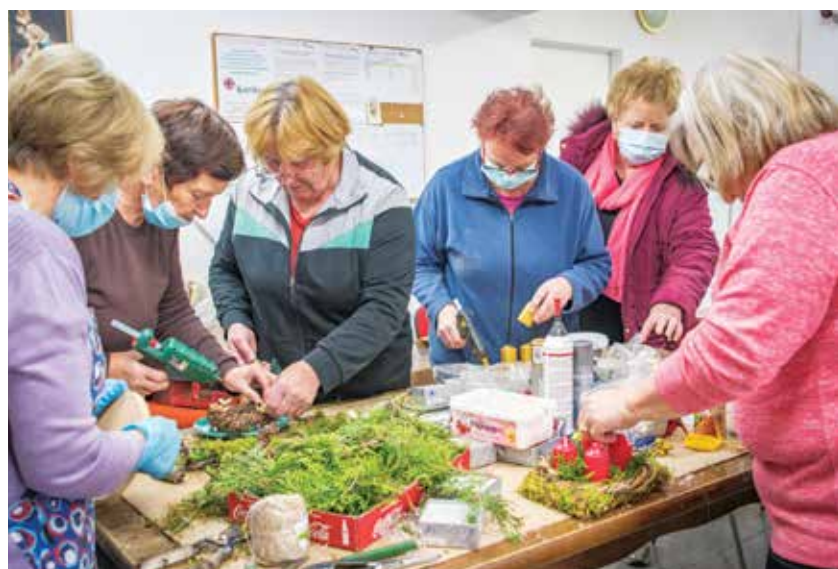
Delavnica izdelovanja adventnih venčkov