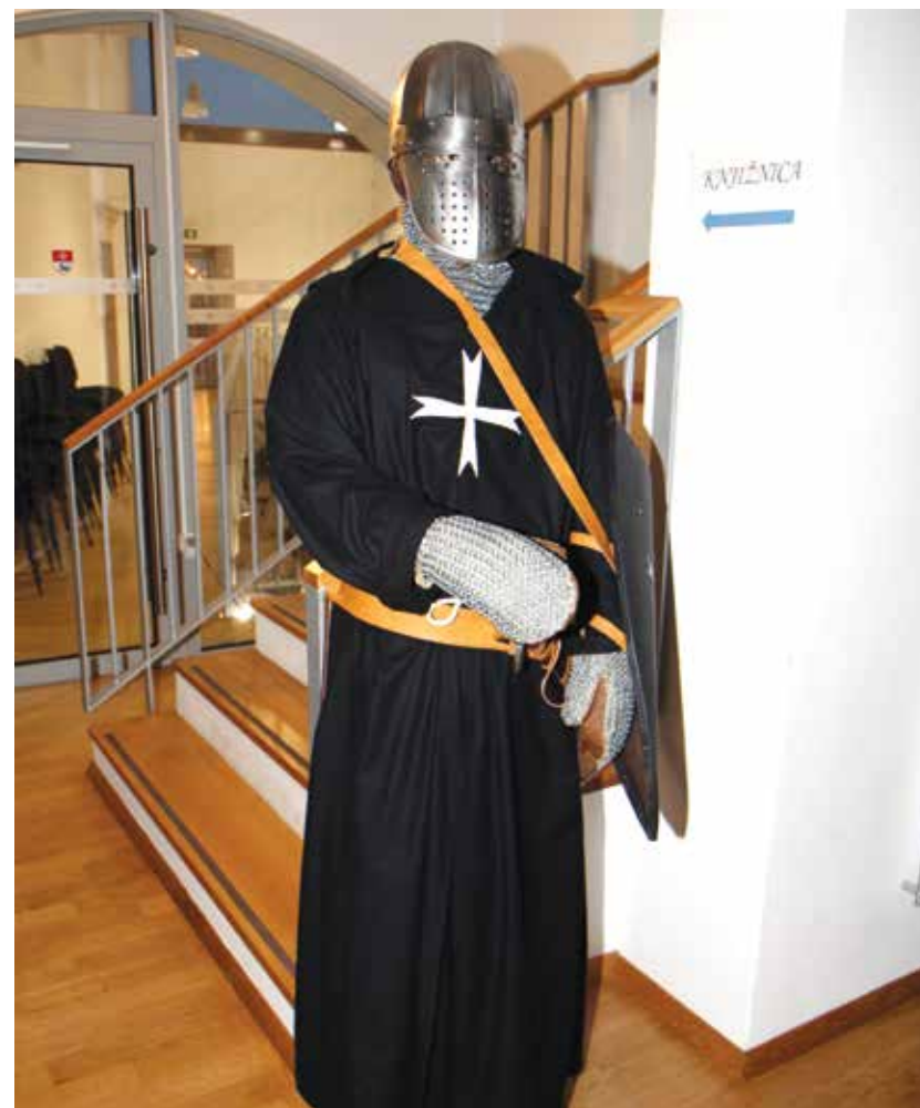
Vitez hospitaler je na ogled je v avli Gradu Komenda.