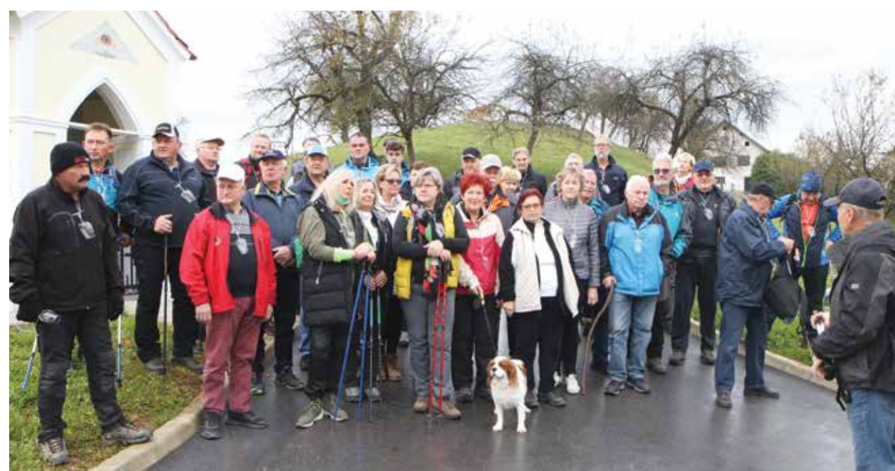
Utrinek s pohoda

Društvo savinjskih vinogradnikov je želelo izvesti tudi martinovanje na podeželski tržnici v Žalcu v petek, 12. novembra, vendar ga je zaradi omejitev organiziranja javnih prireditev prestavilo na čas po ukinitvi ukrepov.