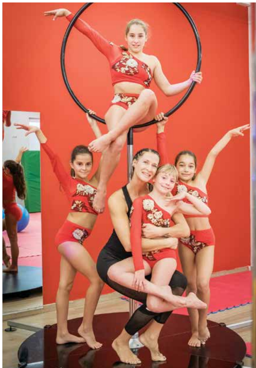
Dekleta s trenerko ob plesnem drogu, ki je bil del televizijskega nastopa.

Mlade plesalke smo povprašali, kako dolgo že plešejo, kdaj so začele plesati, ali se jim treningi kdaj zdijo