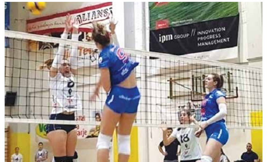
S srečanja SIP Šempeter : ATK Grosuplje

Odbojkarice SIP Šempeter so na tekmi osmine finala pokala Slovenije v ŠD OŠ Šempeter gladko s 3 : 0 premagale ekipo ŽOK Triglav Kranj in se uvrstile v četrtfinale. V prvi tekmi četrtfinala bodo Šempetranke gostovale v Grosupljem, in sicer v torek, 30. novembra, povratna tekma v Šempetru pa bo v sredo, 8. decembra.