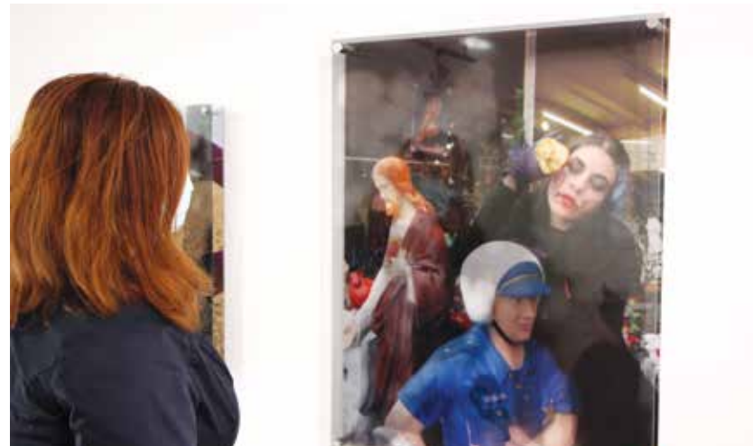
Razstava bo na ogled vse do konca tega leta.

Razstava je na ogled do 31. decembra 2021 v Savinovem likovnem salonu Žalec.