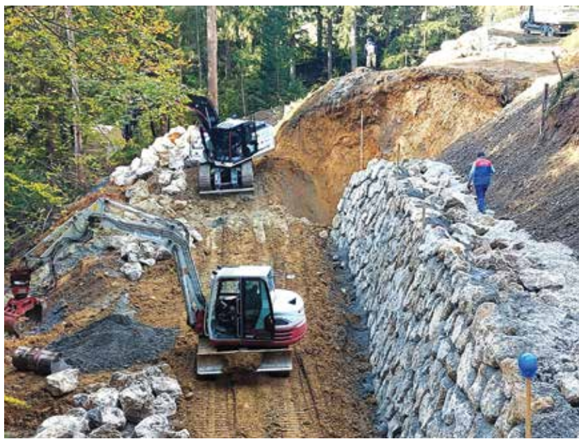
Sanacija plazu pri cerkvi sv. Urbana na Dobrovljah

Izvajalec del AGM Nemeč mora še asfaltirati določene odseke, urediti bankine in poskrbeti za zatravitev. S projektom bo priključitev na javno fekalno omrežje v Orli vasi in Parižljah omogočena okrog 55 gospodinjstvom. Vrednost projekta z obnovitvenimi deli v sklopu projekta, ki so zajemala tudi obnovitev vodovoda, izvedbo javne razsvetljave, ureditve odvodnjavanja in razširitve vozišč, se ocenjuje na dobrih 400.000 evrov.