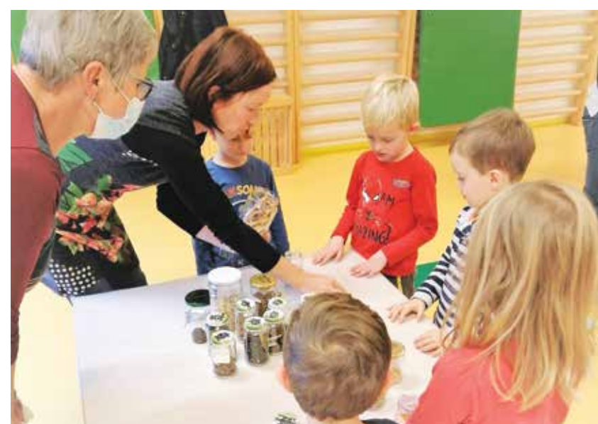
Otroci v vrtcu med spoznavanjem semen buče in fižola