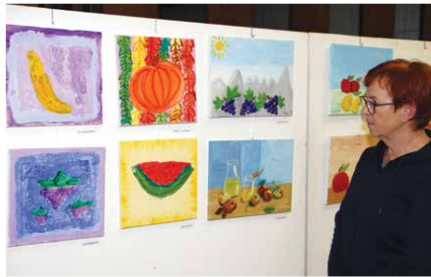
Z razstave Mini paleta 2021

ustvarjanje nadaljujejo, saj ponuja neomejene možnosti.