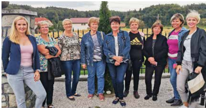
S prvega srečanja na Ponikvi

Osnovna dejavnost v skupini, ki šteje do deset članov, je usmerjen pogovor. Namen delovanja takšnih skupin je zadovoljevanje nematerialnih potreb po temeljnem medčloveškem odnosu. Deluje po principu prijateljske skupine, v