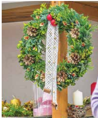
Izkupiček od adventnih venčkov gre v dobrodelne namene.

Letos je delavnic ustvarjanja adventnih venčkov občutno manj, ukrepi so zredčili tudi te aktivnosti