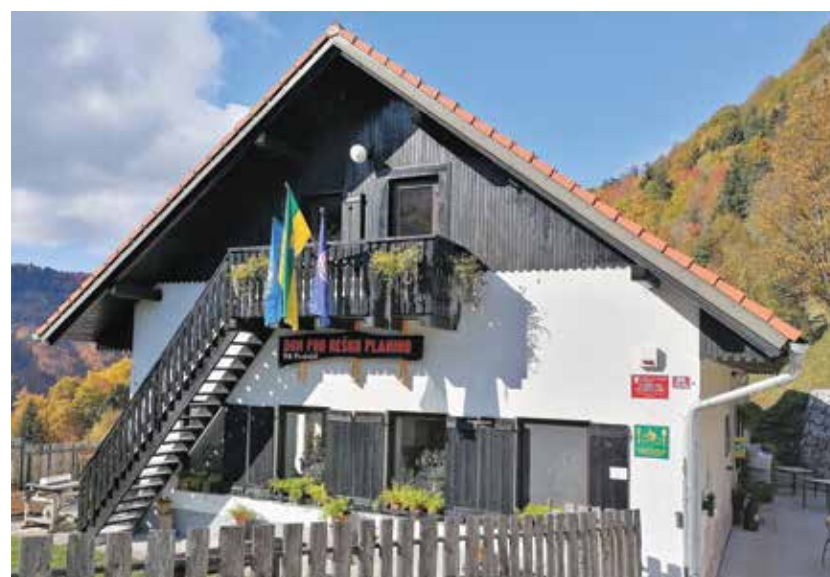
Planinski dom po obnovitvi zgornjih prostorov z narejenimi požarnimi stopnicami

poleg planinskega doma oskrbujejo župnišče in druge sosednje kmetije. V vseh prostorih obnove so bile na novo izdelane tudi elektroinstalacije.