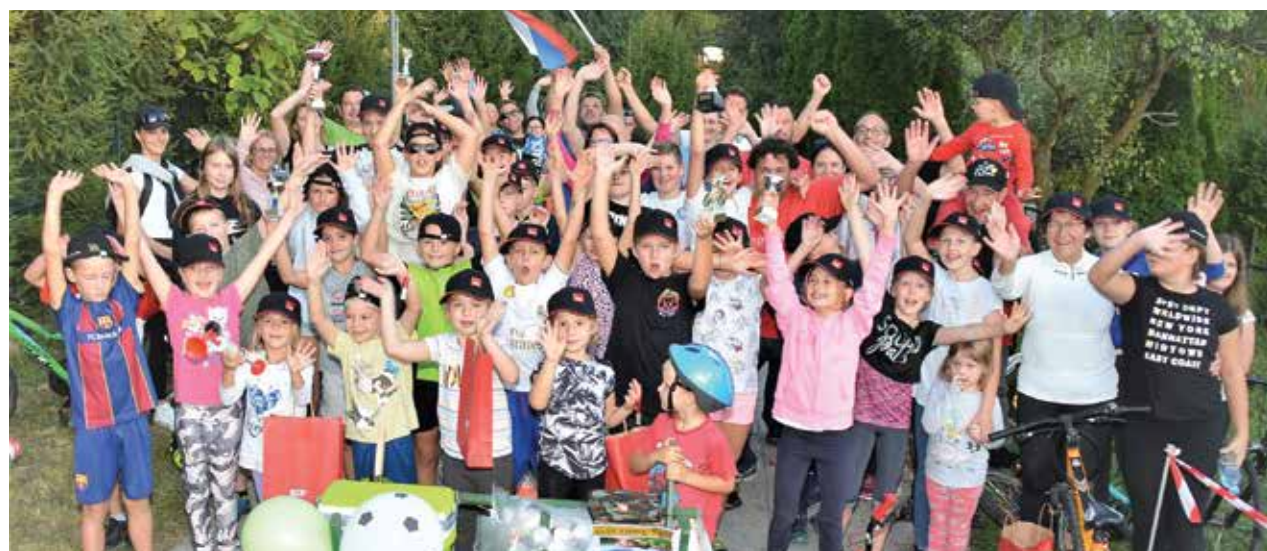
Za spomin na tretjo šeško dirko še skupna slika vseh tekmovalcev in organizatorjev