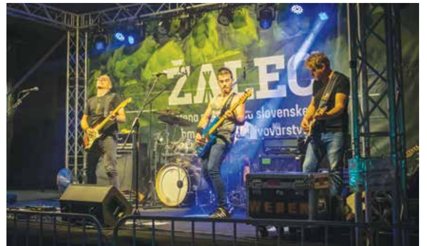
Delček glasbe z glasbene kompilacije so na letošnjih poletnih dogodkih predstavili tudi na odru v Žalcu.

vrsti: »Razmeram navkljub glasbeniki generiramo nove in nove ideje. Svoja občutja in dožemanje realnosti, sveta, razmer zapišemo v obliki glasbe in besedil. V zadnjih dveh letih smo občutili kronično pomanjkanje koncertov. Letošnje leto so nam država in organizatorji dogodkov počasi že pričeli odpirati vrata