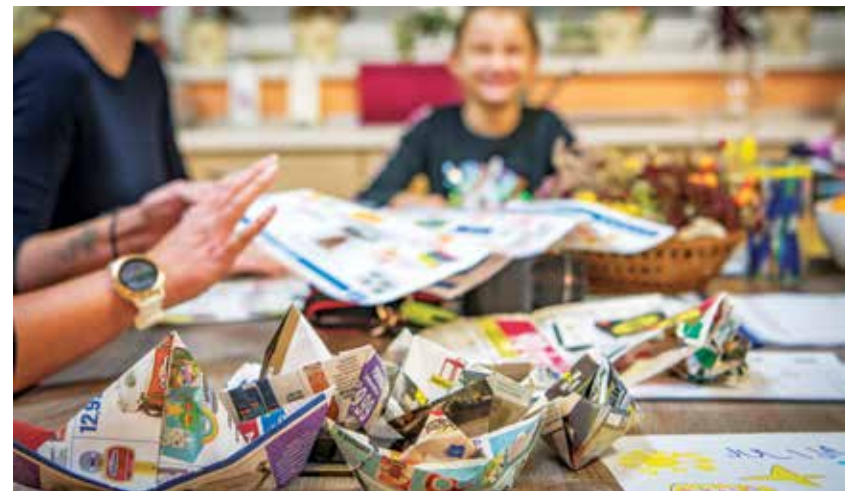
Dobra volja vseh generacij ob izdelovanju ladjic

Na območju Občine Žalec je od leta 1995 nastalo šest skupin za samopomoč, aktivni so v Grižah, Galiciji, Žalcu in Ponikvi pri Žalcu. Delovanje društva Most Žalec podpira