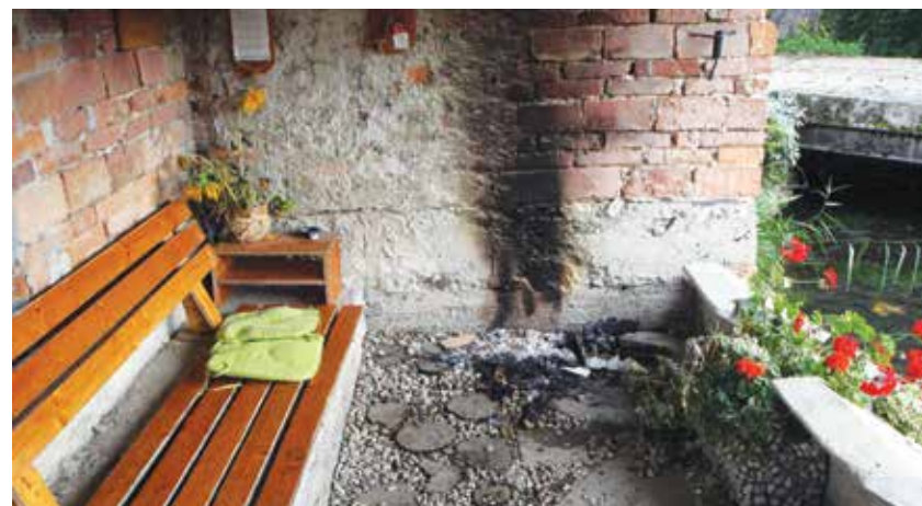
Motile so jih celo klopce in dekorativne police na perišču v Dobriši vasi, ki so jih skupaj z manjšimi eksponati in dekoracijo zmetali v potok.

Kot pravijo strokovnjaki, vandalizem poleg neposrednih posledic v okolju zapuša tudi motnje v družbenih odnosih ter lahko vodi v brezbriznost, strah in razkroj. Vse oblike vandalizma so nesprijemljive in jih moramo kot takšne obsoditi, saj lahko v nasprotnem primeru prerastejo v ravnanja, ki neposredno vplivajo na občutek varnosti v posameznem okolju. Vandalizem je včasih posledica prikritih napetosti v družbi oziroma odsev splošnega družbenega stanja in težav. Na njegove pojavne oblike vpliva tudi zloraba alkohola ali drugih prepovedanih substanc. Mnogi se sami ali združeni v skupine agresivno vedejo do okolice in poskušajo tako prikazati svoj pomen za družbo, ravnanja pa lahko izhajajo iz napačnih vedenjskih vzorcev. Vandalizem v okviru športnih prireditev je večinoma povezan z organiziranimi navijaškimi skupinami, ki preko takšnih ravnanj poskušajo prikazati svojo agresijo – seveda so vsa takšna ravnanja napačna! Na pojavne oblike vandalizma lahko vpliva družba s svojimi aktivnostmi, in sicer tako, da obsodi vsa ravnanja, ki so nesprijemljiva. Vsa neprimerna ravnanja v družbi je treba obsoditi in si ob tem prizadevati, da se spremenijo vzorci ravnanj posameznikov in skupin, ki so mnenja, da so takšna ravnanja sprejemljiva.