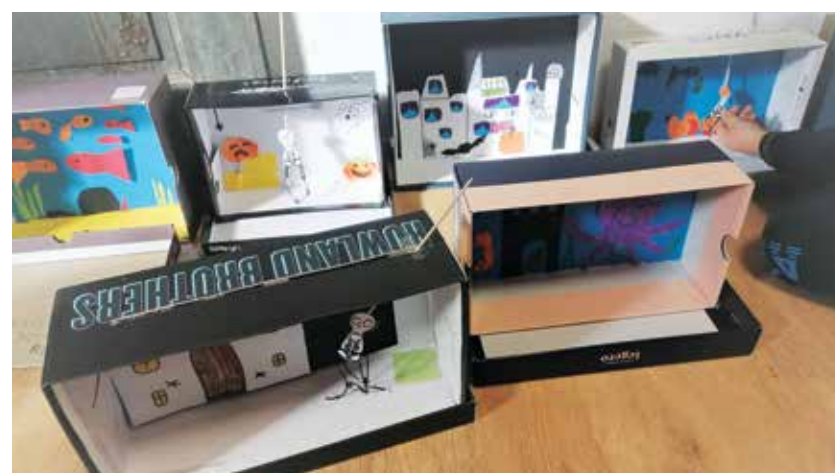
Nekaj izdelkov lutkovnih gledališč iz kartonskih škatel

jemo, imamo večinoma doma, in ni treba v trgovino. Z malo domišljije lahko ustvarimo gledališče v otroški sobi na pisalni mizi ali si ustvarimo nepozaben kostum za razne priložnosti. V času pred nočjo čarovnic smo se tako posvetili izdelovanju kostumov, ki se poleg čarovniških oblačil pojavljajo ob tem času po vsem svetu,« je povedala Jelen. Prihaja veseli december, ko s svojo dobroto razveseljujejo otroke trije dobri možje. Kako bo s tem letos, je znova veliko vprašanje. V MGC Prebold bi želeli izdelovati adventne venčke in praznične voščilnice, organizirati vesele praznične urice in še marsikaj. Upajo, da se bo zdravstvena situacija umirila in jim vsaj minimalno omogočila skupaj ustvarjati in doživljati ta praznični čas.