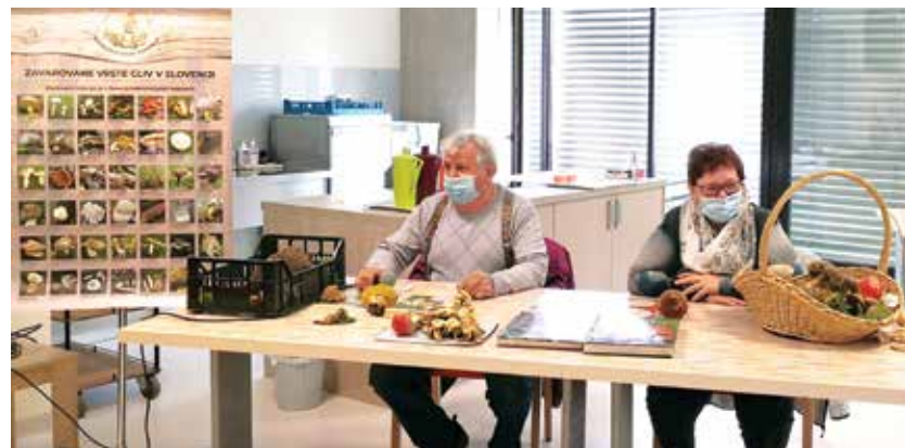
Zakonca Uratnik med predavanjem

Člani Gobarsko-mikološkega društva Polzela so dobri znanci stanovalcev Doma upokojencev (DU) na Polzeli. Vsako leto pripravijo zanimivo predavanje o gobah, ki ga podkrepijo tudi z gobami, ki jih prinesejo s sabo. Stanovalci lahko tako gobe vonjajo in tipajo, predvsem pa si jih dobro ogledajo.