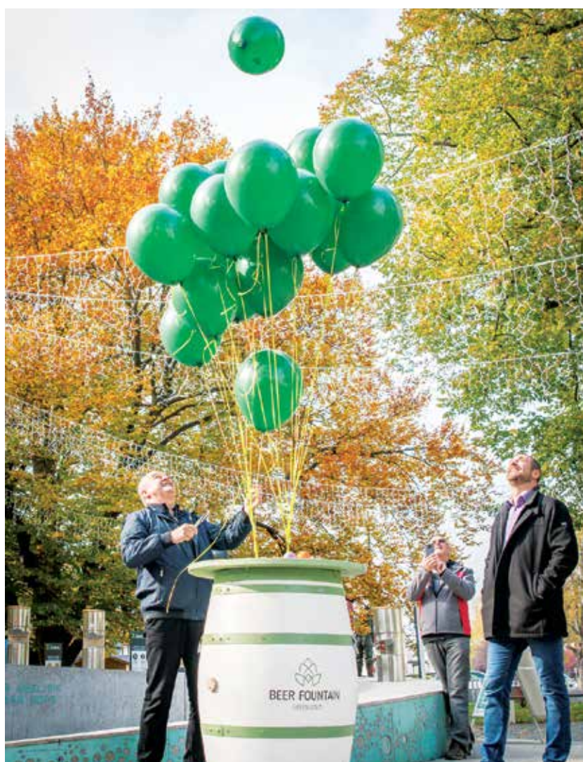
Zaključek šeste sezone na Fontani piv Zeleno zlato: v zelenih balonih se skrivajo kuponi za brezplačne vrčke. Baloni s kuponi na poti do srečnih najditeljev