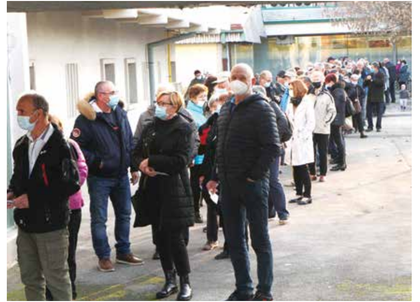
Vrsta pred kulturnim domom, kjer je potekalo cepljenje.