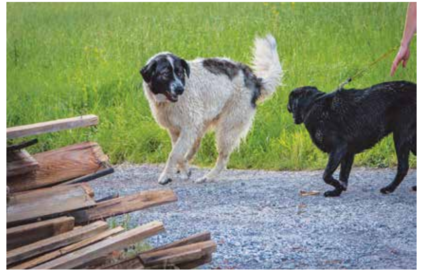
Občina krije med drugim tudi stroške sterilizacije in kastracije zapuščenih živali.

Gradnja novega mostu oziroma prva faza bi lahko bila končana do konca junija leta 2023. Pred začetkom del pa je treba obnoviti most čez Savinjo v Kasazah, preko katerega bo preusmerjen del prometa iz Griž, del pa bo potekal čez most v Šešcah.