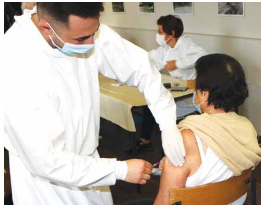
Največ se jih je cepilo s tretjim odmerkom.