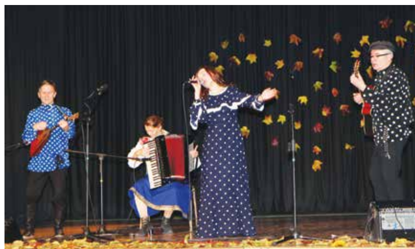
Nastop ansambla Kalinka