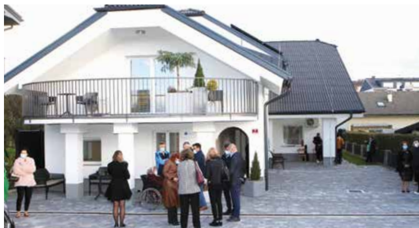
Hiša DVC Žalec stoji naproti razvijajoče se soseske Žalec zahod.

Center v Žalcu bo nudil vse oblike osnovne in socialne oskrbe ter zdravstvene nege za 15 uporabnikov.