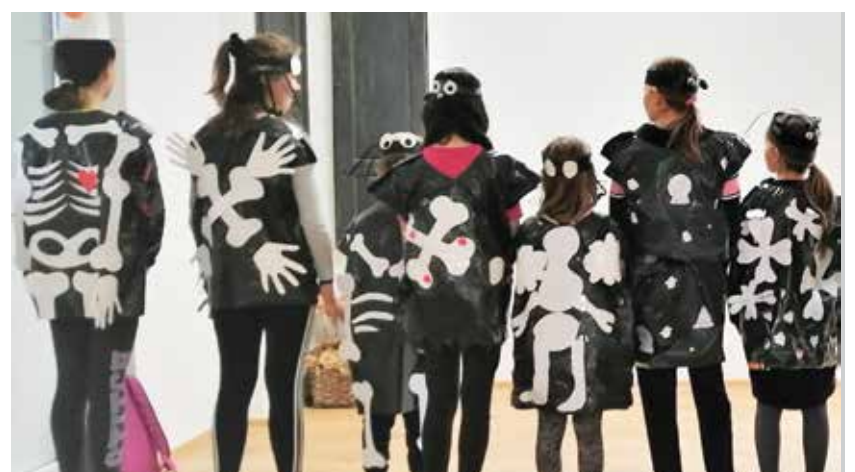
Iz recikliranih materialov so ustvarili kostume za noč čarovnic.