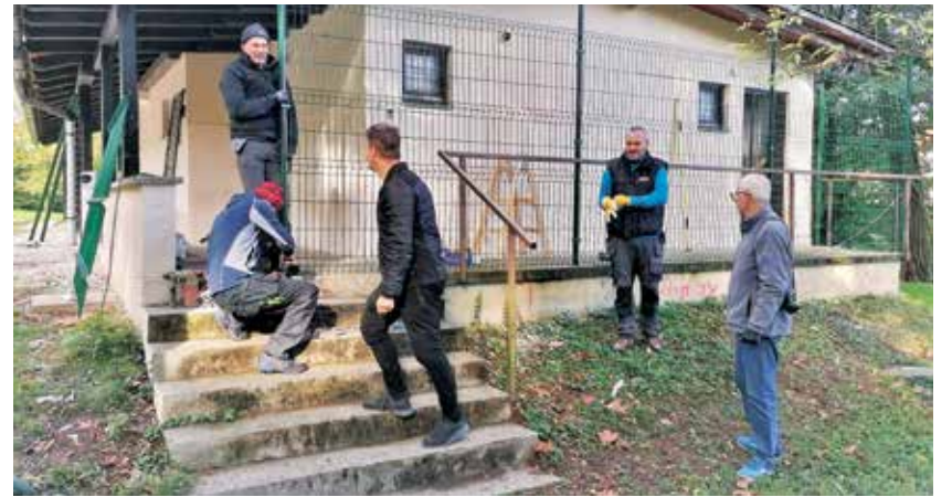
Le nekaj dni pred vandalskim početjem so jamarji postavili ograjo za zaščito fasade objekta.