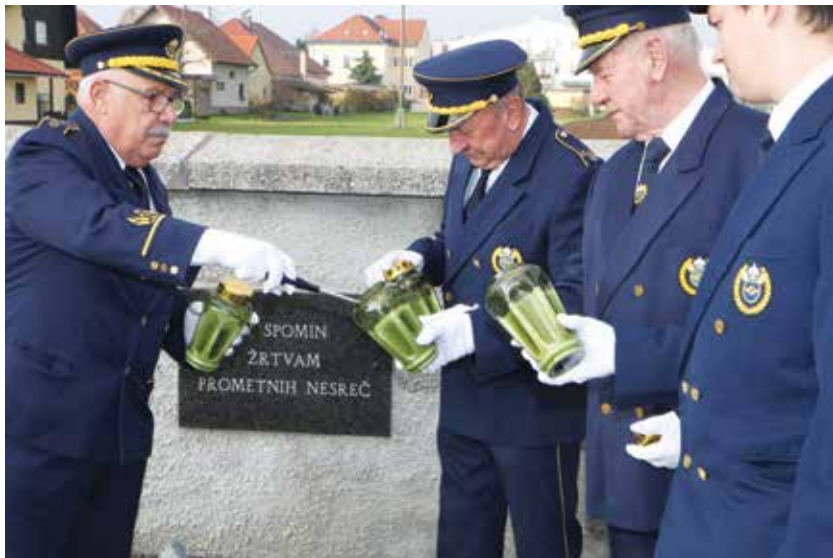
Med prižigom sveč na Polzeli

Po podatkih Evropske komisije je na cestah v EU leta 2020 umrlo 18.844 ljudi (v povprečju 42 mrtvih na milijon prebivalcev), to je 37