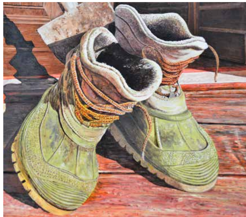
V dvoje je lepše (avtor slike F. Kadivnik)

Na razstavi svoje izvirne slikovne stvaritve s tematiko čevljev predstavljajo člani likovne sekcije Kulturno-umetniškega društva Žalec.