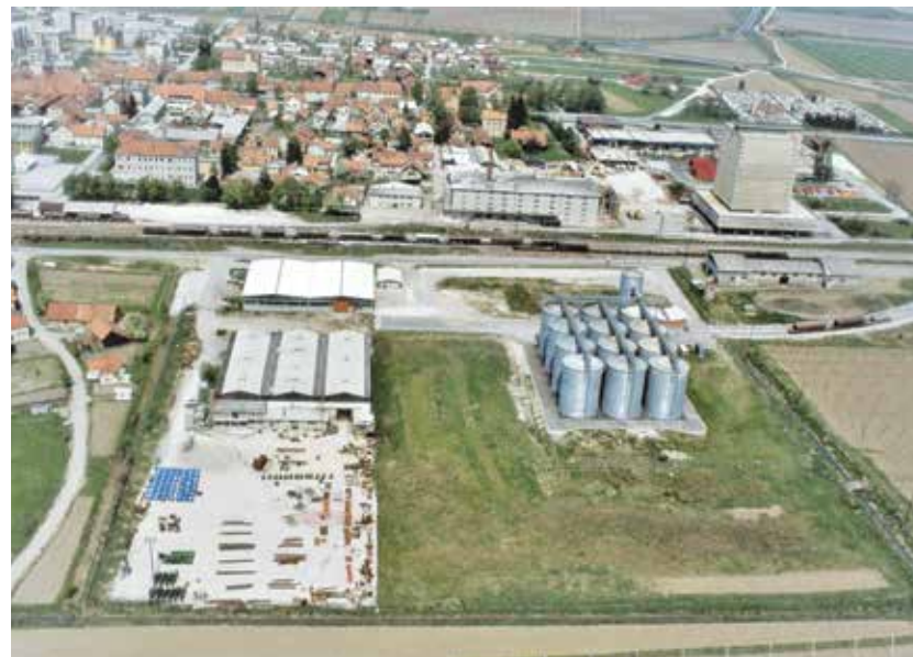
Hmezadova stolpnica, mešalnica krmil, silosi in velik del Žalca s ptičje perspektive v osemdestih letih.

»Zemljišča so se odkupovala, jemala v dolgoročni zakup ali pa se zamenje-