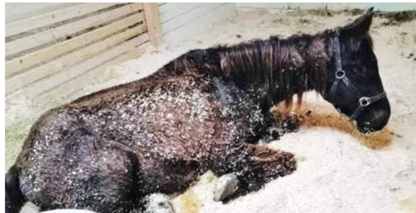
Stanje konja je bilo že ob prihodu v zavetišče kritično.