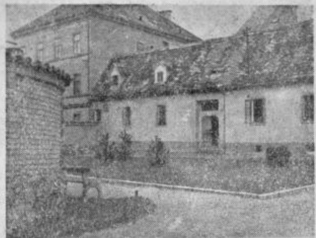
Park in druge manjše nasade v Celju so ponekod lepo očistili in uredili. — Naša slika kaže prijeten kotiček v zavetju hiš — mali nasad na Kocenovem trgu.

V celjski mlekarni in predelovalnici mleka smo sicer našli snago in red, vendar so nam zaupali, da že dobro leto naši dojenčki pijejo isto mleko kot odrasli. Naprave za pasterizacijo so dosluženje in pokvarjene in če bomo z nabavo nove čakali, da bo zgrajena nova mlekarna, bodo naši dojenčki še dolgo uživali nepasterizirano mleko.