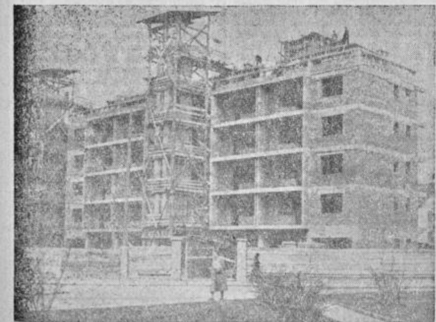
Kljub znižanim investicijam v gradbeništvu, kot predvideva letošnji osnutek okrajnega družbenega plana, v Celju počasi le rastejo nove zgradbe. Na sliki vidimo stanovanjski blok trgovskega konzorcija v gradnji na Standrovem trgu