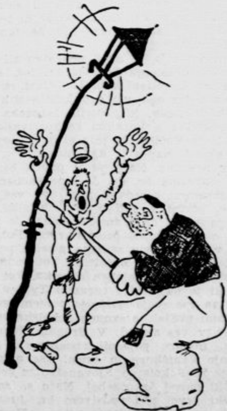
Napad »Pomagajte, pomagajte, zaklati me hoče!« »Nikar tako ne vpijte, saj nisem gluha!«