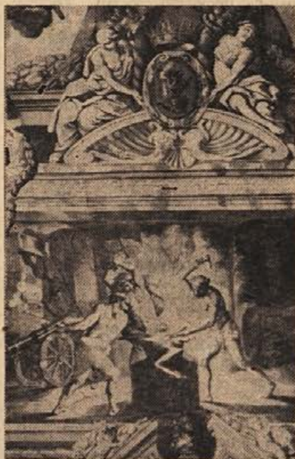
Detajl iz slavnostne dvorane v brežiškem gradu.