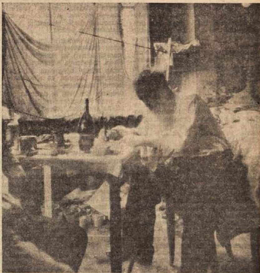
Mojster Rihard Jakopič v svojem ateljeju