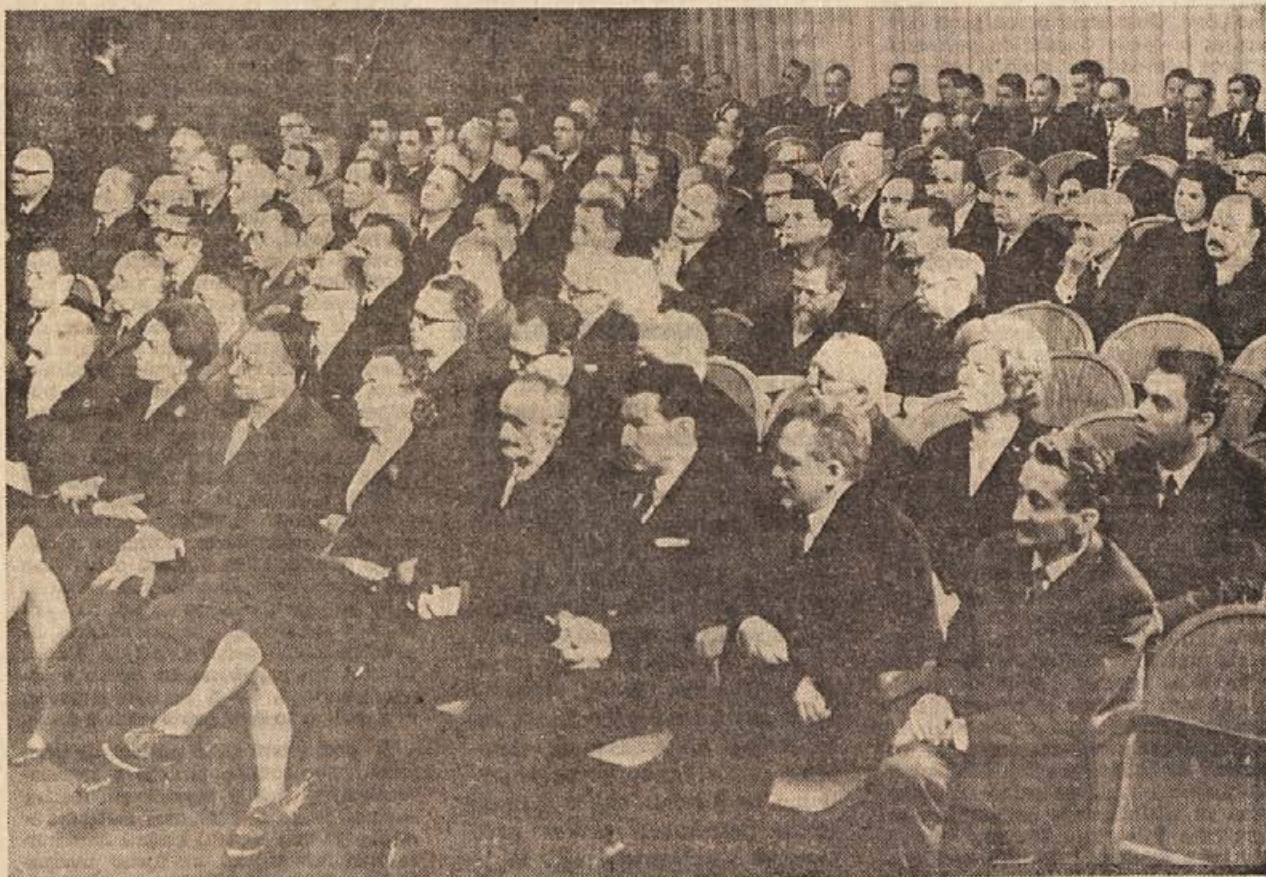
S slavnostne proslave SNOS v Črnomlju (19. februarja 1969)