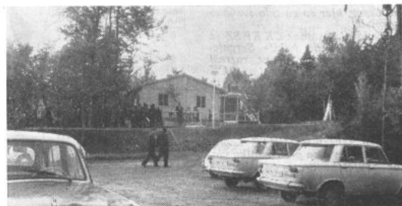
Ob otvoritvi turističnega centra »Črni les«.