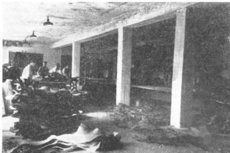
Detajl iz obrata Tovarne usnja »Konus« Slov. Konjice, v Lenartu

Lansko leto so bili v prvem polletju osebni dohodki v povprečju 23.593 din. V istem obdobju letos pa so povprečno 33.962 din. V ta znesek ni vračunano nedavno povečanje osebnih dohodkov v zvezi z določili ZIS. Omenjeno povečanje so začeli izplačevati s 15. julijem po naslednjem ključu: Osebni prejemki do 40.000 din so povečani za