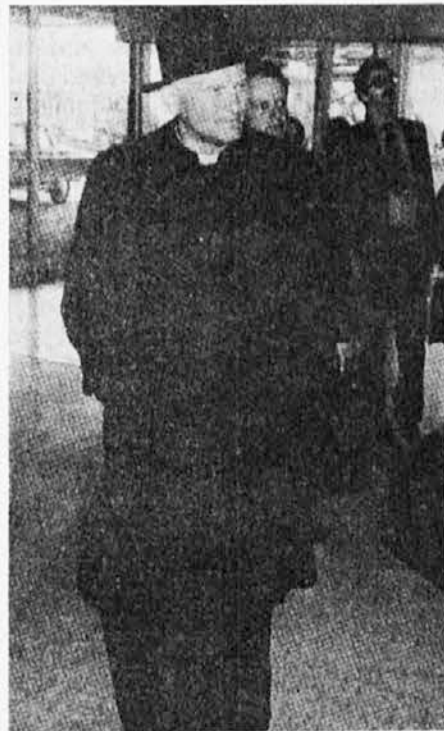
Kardinal Karol Wojtyła ob prihodu v Rim, da bi prisostvoval pogrebu papeža Janeza Pavla I. Prišel je z namenom, da se vrne v svojo škofijo. Sv. Duh je po kardinalih odločil drugače: ostal bo kot papež v Rimu z imenom Janez Pavel II.