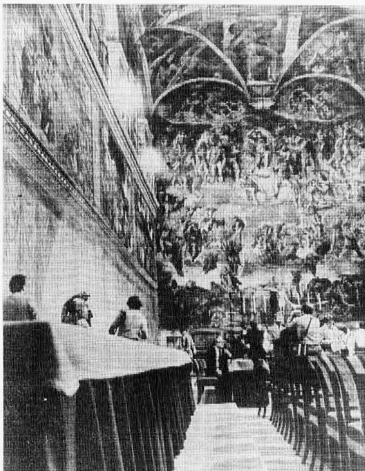
Sikstinska kapela na predvečer zadnjega konklava. V ponedeljek 16. oktobra proti večeru je bil tu izvoljen za novega papeža krakovski nadškof Karol Wojtyła