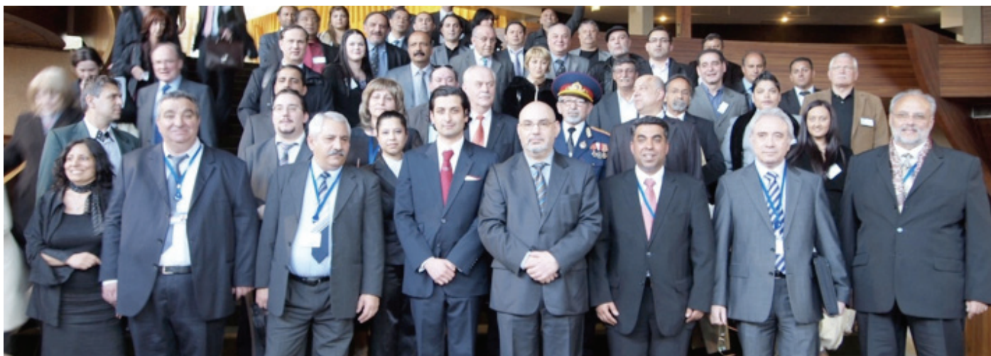
Delegati ERTF v Strasbourg