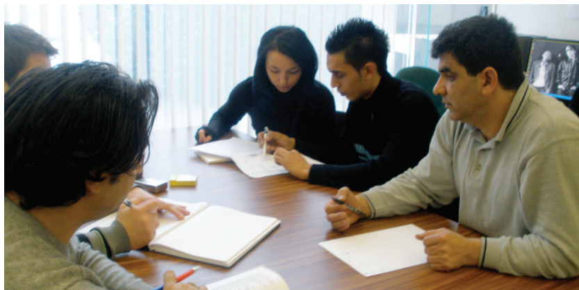
udeleženci delavnice v RIC-u

V prostorih RIC (romski informacijski center Ljubljana) smo v mesecih januarju in februarju letos izvedli štiri delavnice učenja in poznavanja romskega jezika.