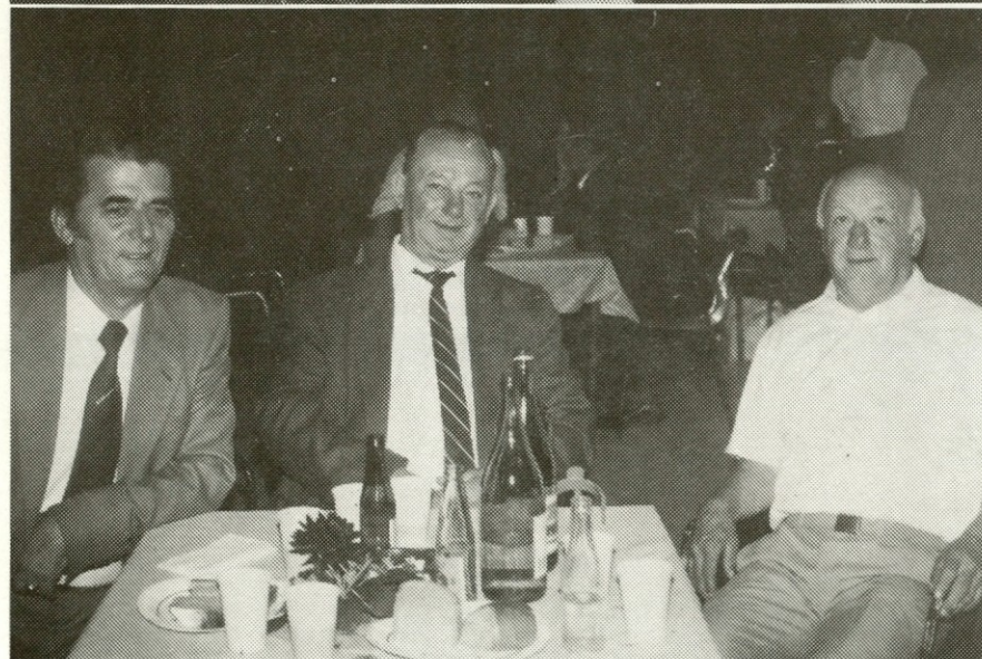
Lepo je videti nasmejane obraze; verjemite, da se niso nasmejali le v fotoaparatu.

Pri upokojencih, ki se srečanja niso udeležili