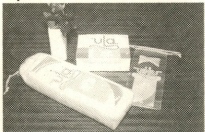
Izvozni program vate in higienskega vložka.

Prodaja lastnih izdelkov in uslug v 9 mesecih zaostaja za načrtovanim izvozom za 9 %. Ko iščemo vzroke neizpolnjevanja naših obvez, ugotovljamo, da je močno upadel izvoz kompres predvsem zato, ker nismo imeli urejenih proizvodnih prostorov v smislu zahtev dobre proizvodjalne prakse, imenovane tudi GMP - norme (Good Manufacturing Practice). Tako predstavlja ta izpad v izvozu cca 12 mio kosov kompres ali vrednostno USD 237.450,- K temu moramo prišteti tudi manjša naročila cik cak vate iz Skandinavije in praktično popoln izpad naročil za izvoz cigaretnih filtrov. Ostali izvozni asortiman nam je uspelo prodati v načrtovanih količinah.