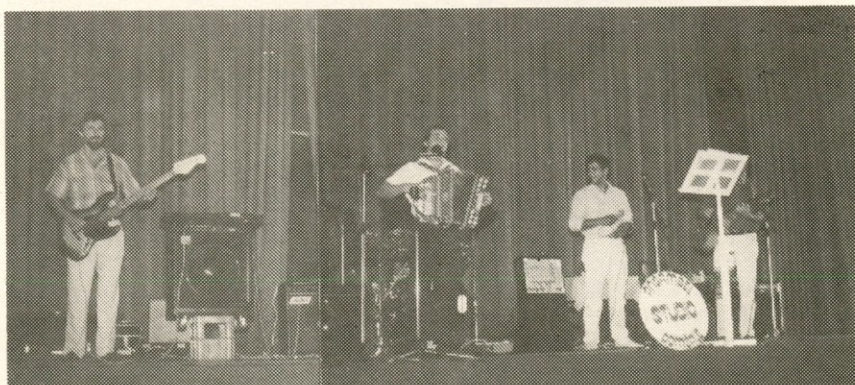
Fantje iz ansambla STUDIO spravijo človeka na noge!