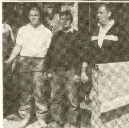
nogometaši in balinarji.

Za trud in dosežene lepe rezultate si naši predstavniki zaslužijo pohvalo in čestitke vseh Tosamovcev.