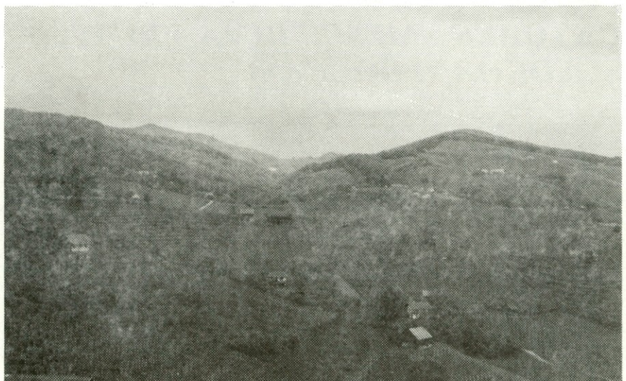
Tja, kjer je lepo, kjer srečaš dobre ljudi, tja se vedno rad vrneš.

Vedeli smo, da bo to nekaj novega. Izjemno zanimanje za to obliko izleta med vsemi starostnimi strukturami krajanov Krašnje je narekovalo, da je potrebno čimprej stvar pripeljati do trdnih dogovorov s tistimi, ki so nas pripravljene sprejeti. Imeli smo srečo.