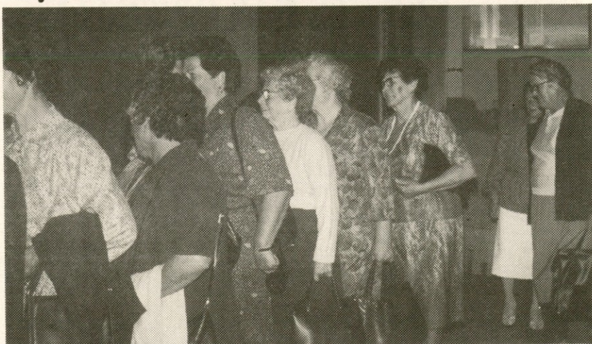
Topel stisk roke ob prihodu.