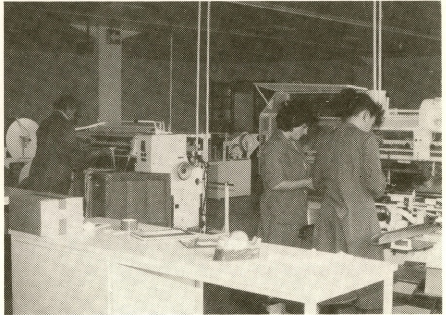
Proizvodnja pomožnih zdravilnih sredstev - kompres iz gaze.

Poleg dokumentacije je pomembna tudi urejenost skladiščnih prostorov