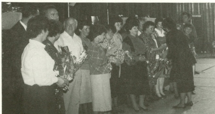
Slavljenci: letošnji »novi« upokojenci,