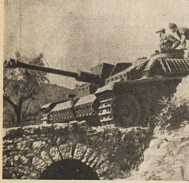
7. oktobra 1943 so sprožili nacisti s pomočjo ostankov fašistov...