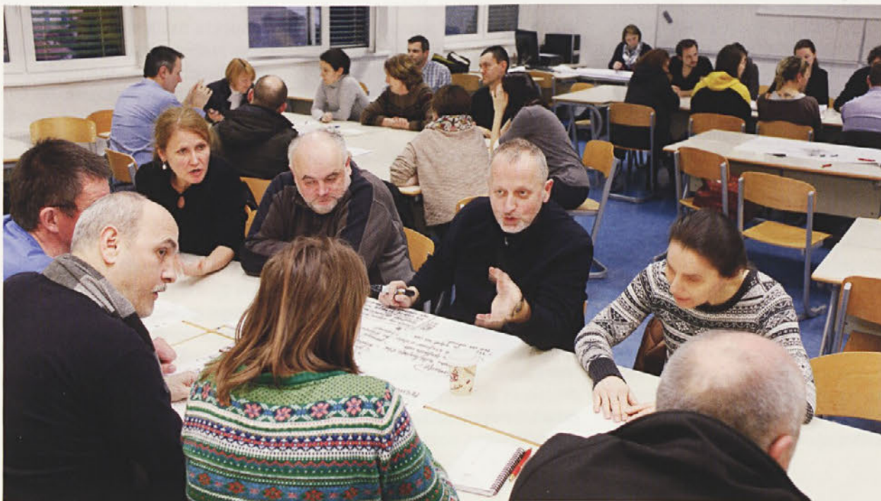
Udeleženci so tri ure v skupinah potovali med omizji, pri vsakem so razpravljali na eno izmed sedmih tem, povezanih z mestnim jedrom.

A bolj kot nova prometna ureditev je udeležence skrbelo vprašanje urejanja mirujočega prometa, torej ali bo na voljo dovolj parkirnih mest, ne le v mestnem jedru, temveč tudi na njegovem obrobju. Prelagali so, naj dnevni migranti parkirajo zunaj mestnega jedra, kjer naj jim bodo na voljo posebna parkirna mesta z bolj ugodnim plačilnim režimom (npr. z dovolilnicami), podobno kot za prebivalce mestnega jedra.