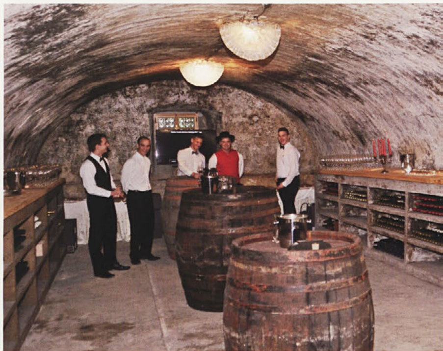
Vinska klet na gradu Grm na dan odprtja.