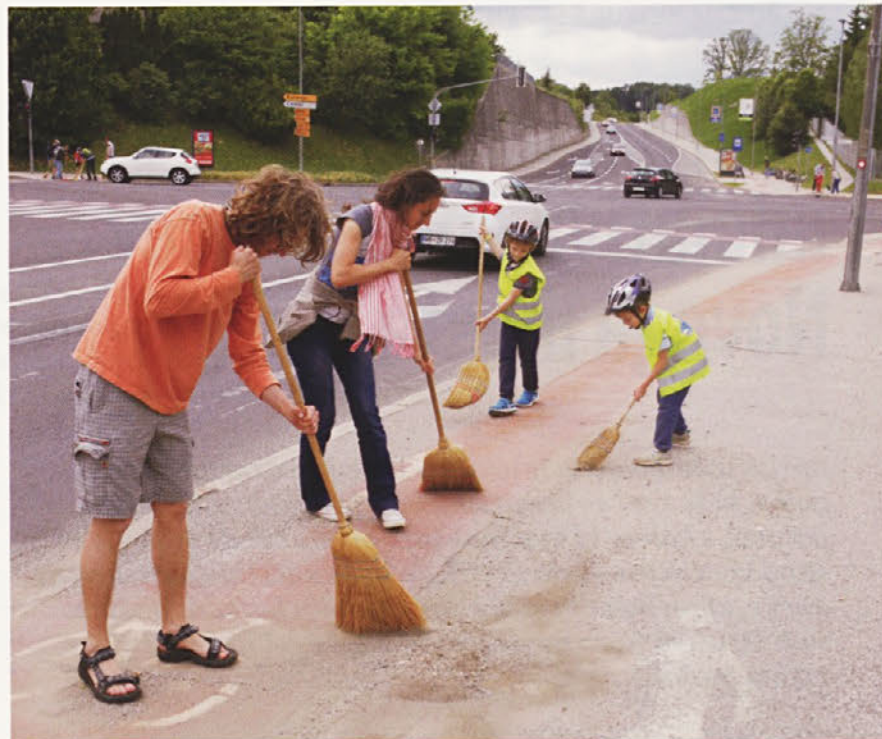
Prva akcija NKM: pometanje kolesarskih stez. Lahko se pridružite našim prizadevanjem.

svetovnem dnevu preprečevanja samomorov smo se pridružili akciji Mednarodne zveze za preprečevanje samomora.