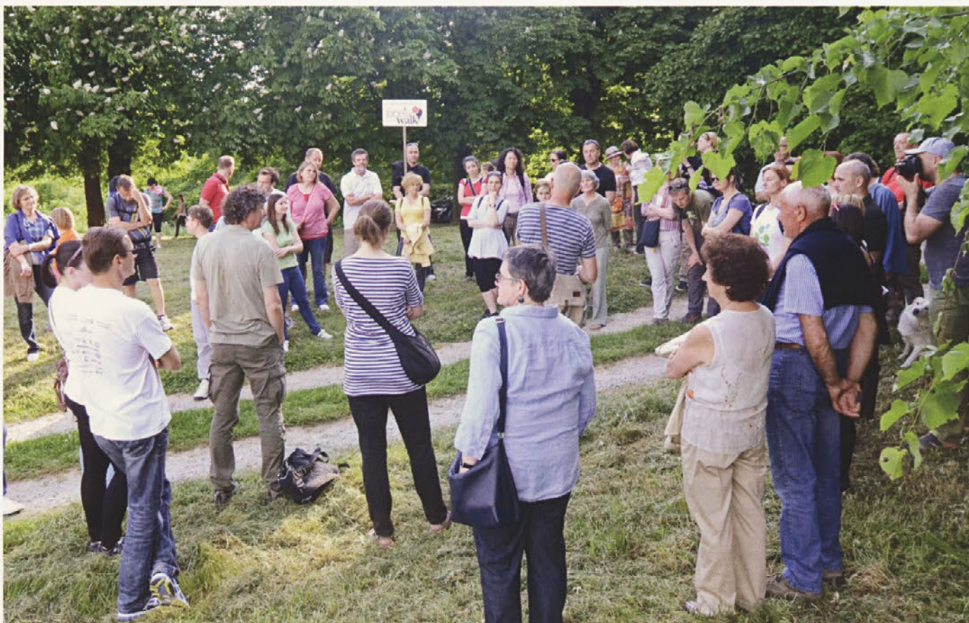
Urbanih sprehodov Jane's Walk se vedno udeleži tudi veliko članov DNM, ki pri tem tudi dejavno sodelujejo.