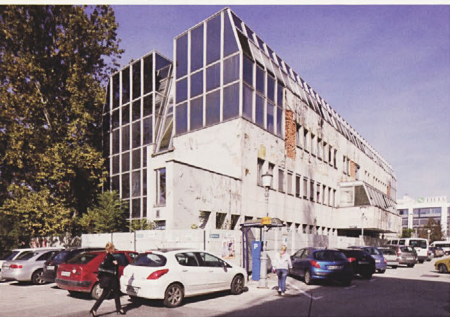
Objekt Novi trg 6 je zgradila nekdanja jugoslovanska vojska za svoje potrebe, pozneje pa so v njem našli prostore Upravna enota Novo mesto, Mestna občina Novo mesto in Zavod LokalPatriot.

Leta 2006 je Mestna občina Novo mesto objekt prodala podjetju Elektroservisi, d. o. o., in leta 2007 v sodelovanju z novim lastnikom pripravila razpisno dokumentacijo za izvedbo javnega arhitekturnega natečaja Novi trg, ki pa ni uspel. Društvo Novo mesto je namreč pozorno spremljalo namere investitorja, ki je na tem mestu predvidel izgradnjo nebotičnika, višjega od kapitljskega griča. Na ministrstvo za okolje je vložilo pritožbo in namero uspelo preprečiti, zato