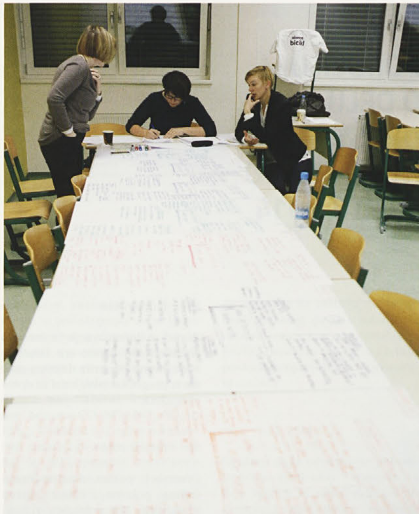
Moderatorji omizij med pripravo zaključkov.

Krajevne skupnosti so po njihovem mnenju zelo neodzivne, nekatere že pet let nimajo ažuriranih spletnih strani, občane pa vključujejo le ob praznikih, ne pa takrat, ko gre za odločanje o pomembnih lokalnih zadevah.