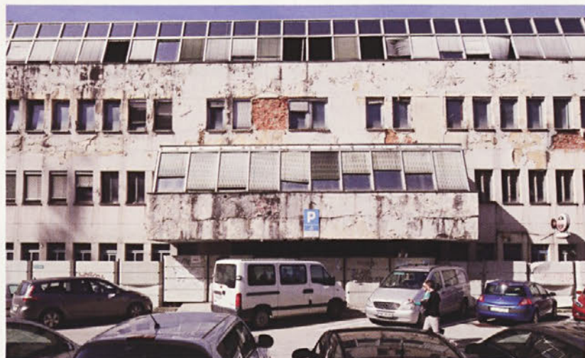
S svojim videzom je stavba na eni najbolj odličnih in vidno izpostavljenih lokacij resnična mestna sramota.

je podjetje Elektroservisi, d. o. o., leta 2008 objekt prodalo podjetju Betonai, d. o. o., iz Trebnjega, ki pa je od leta 2010 v stečaju. Njegovo premoženje je prevzela banka Hypo Leasing podjetje za financiranje, d. o. o., danes pa je v lasti podjetja HETA Asset Resolution, d. o. o., ki si na tem mestu prizadeva zgraditi manjši objekt, kot ga predvideva veljavni prostorski akt. Ker so spremembe in dopolnitve veljavnega prostorskega akta finančno breme investitorja