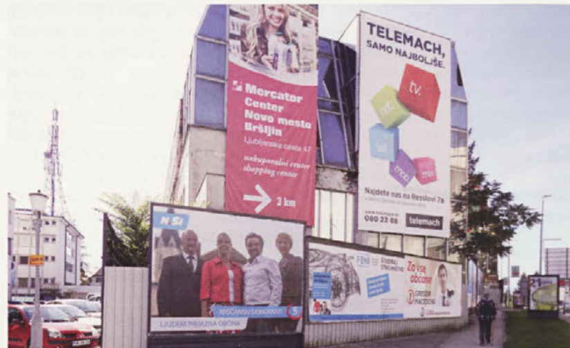
Medtem ko se menjajo lastniki, stavba služi kot ogromen oglasni pano.

Hkrati v mestu tečejo dejavnosti za prenovo mestnega jedra, ki bodo poleg fizičnih sprememb prinesle tudi organizacijske ukrepe in izboljšano podporo občinske uprave lastnikom stavb, ki potrebujejo vzdrževalna dela. Če takšni predhodni »mehki« ukrepi ne bodo dali zelenih rezultatov in se stanje objektov ne bo spremenilo, bo občina vnovič preučila možnost reševanja navedene problematike s sprejetjem odloka na podlagi 6. člena Zakona o graditvi objektov.