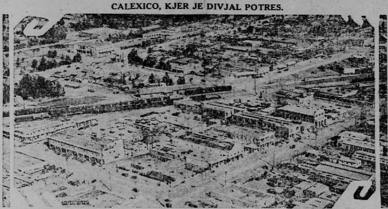
Slika nam predstavlja Calexico, Cal., ki je največ trpelo ob priliki zadnjega potresa, ki je napravil veliko škodo v Imperial dolini in severnem delu Mehike. Slika je bila vzeta kmalu po potresu.

Honolulu. — Delo se bo začelo v najkrajšem času v Pearl Harbor, kjer bodo poglabili v toliko, da bodo v pristanišču lahko pristajale največje bojne ladje. Delo bo končano v dveh letih, stalo bo $4,500,000.