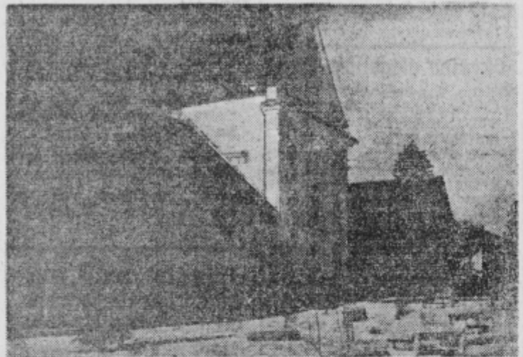
Ptujski muzej — Arheološki oddelek.

vsako prvo nedeljo v mesecu. Svoje pismene predloge in podobno predložijo v pisarno vsako nedeljo dopoldne.