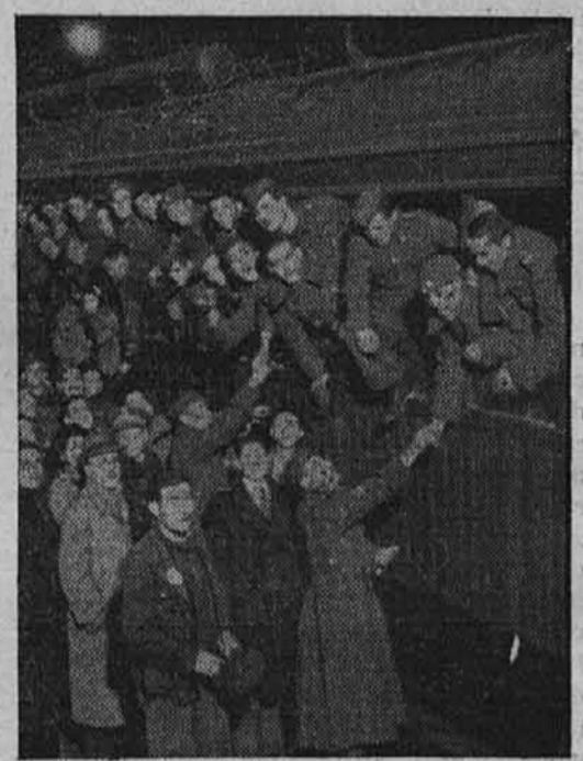
Zopet španski prostovoljci za vzhodno fronto

Prostovoljci španskega zračnega orožja pred odhodom iz Madrida na vzhod, kjer bodo zamenjali tovariše iz »Modre divizije«.