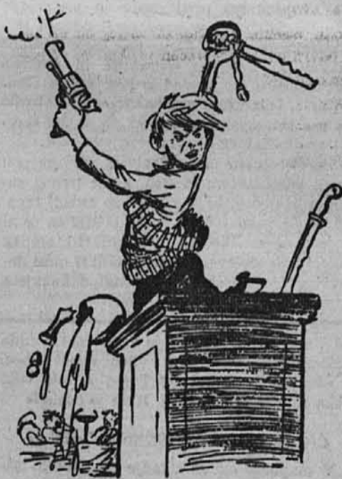
Govorniški tip: Bojaželjni fanti.

Karikature socialističnih časopisov nam pričajo o produktih take vzgoje. Ali je s tem dokazano, da je bila v Sovjetiji dovoljena kritika? Ah, ne; ta način glosiranja razmer je bil samo izhod, da so mogli od zgoraj dati prebivalstvu iluzijo, kakor da bi se za te nevzdržne razmere brigali in kakor da bi skrbeli za njih izboljšanje. »Izgovori se hudo, da ni treba izreči najhujšega«. Potem priredijo komedijo, »krivce« obtožijo, podtaknejo jim vse pogrške, obsojijo jih, pridejo nove moči na vodilna mesta in ostane tako, kakor je bilo že prej.