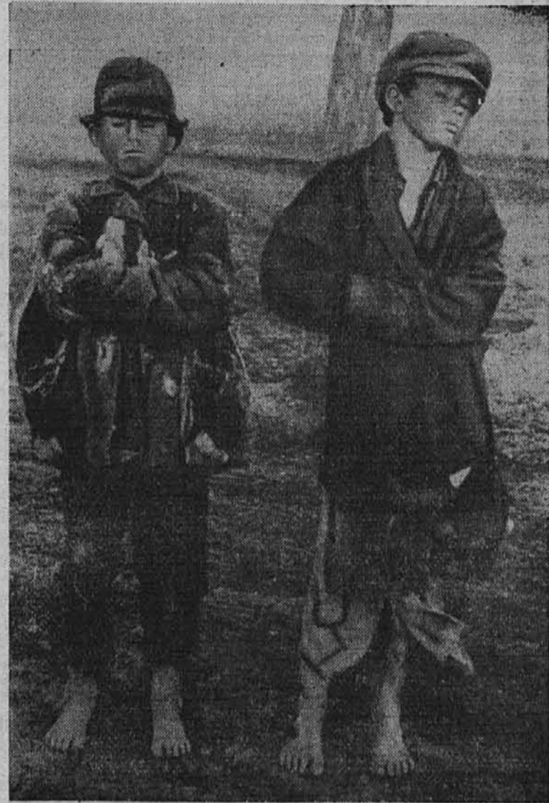
To so v resnici otroci sovjetskega raja

niku sodrugu Moskalenku trpelo tri dni in tri noči.« piše Kom. Prawda dne 28. V. 1938.) Posvetujejo se, kujejo načrte, toda nikoli jih ne izvedejo. Izoblikuje se oni govorniški tip, ki ga je karikirala »Komsomolskaja Prawda« z dne 22. IX. 1940., ki pa zavoženih razmer ne more izpremeniti. (V knjigi »Rdeči otroški raj«, ki je izšla v »Junge Generation Verlag«, prikazuje dr.