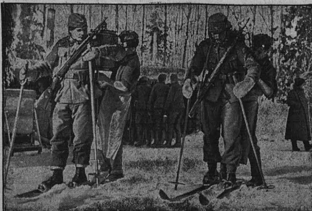
Nosilci jedi na smučih

prinašajo tovarišem v sprednje postojanke topla jedila.