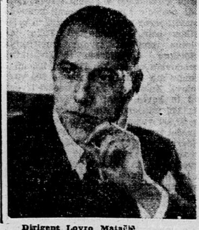
Dirigent Lovro Matačić