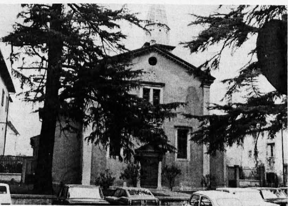
Cerkve sv. Ivana v Gorici, sedež slov. dušnopastirskega središča v goriškem mestu

Od 12. do 19. oktobra je bil v Jugoslaviji na obisku novi ruski patriarh Pimen. V Beograd je prispel s posebnim ruskim letalom in številnim spremstvom. Obiskal je razne kraje v Srbiji in se srečal z mnogimi osebnostmi. V Beogradu se je srečal tudi z apostolskim nuncijem Marijem Cagno. Iz Beograda se je patriarh odpeljal v Atene, na povratku pa se je ustavil v Romuniji.