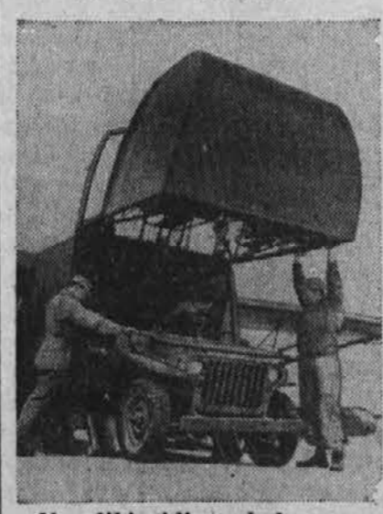
Na sliki vidimo, kako spravljajo vojaški avto v veliko jadransko letalo, ki bo ponosno avto na bojišče, kjer je potreben.