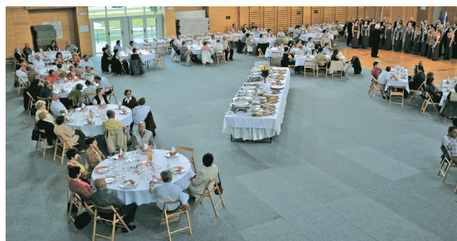
Dvorana OŠ AMS je bila prireditvi po meri