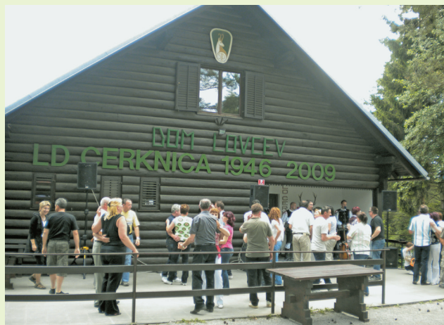
Trio Ugib s pevcem je marsikoga spravil v razpoložensko gibanje.