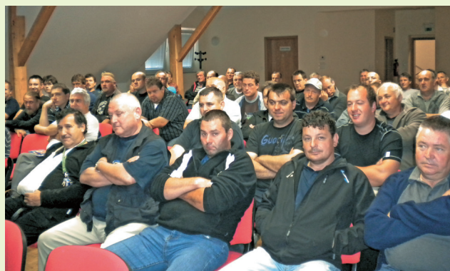
»Le kaj nam je tega treba bilo« bi lahko razbrali na obrazjih udeleženc-ev obnovitvenega usposabljanja