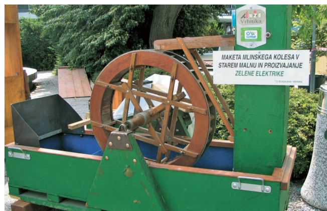
Tudi na LOS se je vrtno kolo, kakršno se vrti v Starem malnu

Trans Felix d.o.o. je predstavljalo nabor svojih storitev, ki jih opravlja v avto-servisnih delavnicah za tovorna vozila, obiskovalcem so bili na voljo številni katalogi za originalne rezervne dele za tovorna vozila. Obiskovalcev sejma je bilo veliko manj, kot smo jih pričakovali. Naša želja je, da bi bil sejem naslednje leto bolj uspešen za razstavljalce, za GR in za partnerje sejma.