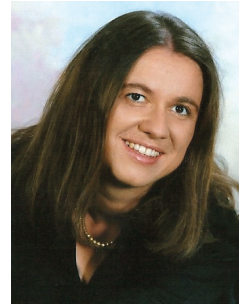
Pripravljala Barbara Grum Vogrin