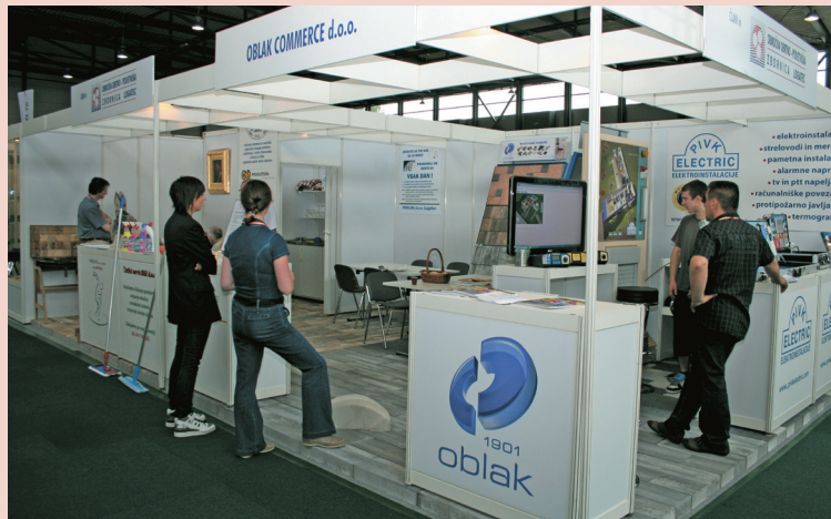
Lepo urejeni razstavniki prostori razstavljalcev iz OOO Logatec

Vsi naši razstavljalci pa so bili kljub kritikam o majhnem obseju sezma zelo zadovoljni.